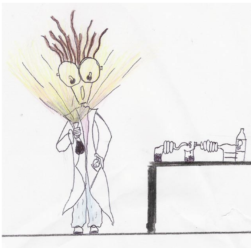
Figura 1 O conceito de cientista para um aluno do ensino básico: “Um homem de bata com um tubo de ensaio na mão, eventualmente um químico” (adaptada de um desenho realizado por um aluno do 2.º ciclo da Escola E.B. 2,3 D. Afonso III, de Faro).

É comum, para os alunos do ensino básico, definir um cientista como sendo: “um inventor”; “aquele que faz experiências”; “uma pessoa com um gosto enorme para descobrir” ou “um homem que fez uma descoberta muito importante”. Aparentemente, determinados conceitos devem ser transmitidos a alunos muitos novos ou com uma mentalidade aberta. Supostamente, a mente pode ser comparada a um pára-quadras: só funciona se estiver aberto. Nesse