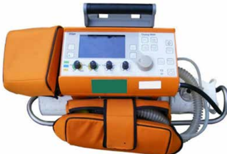
Figura 2. Ventilador Oxylog 3000® da Dräger

Atualmente, a título exemplificativo, a equipa médica de emergência pré-hospitalar do Algarve dispõe de um ventilador Stellar 150® da ResMed (representado na figura 1) e de um ventilador Oxylog 3000® da Dräger (figura 2). O ventilador Stellar 150® destina-se à utilização não invasiva, permitindo a ventilação invasiva mediante a utilização de uma válvula de fuga. Permite a administração de oxigénio a 30L/min,