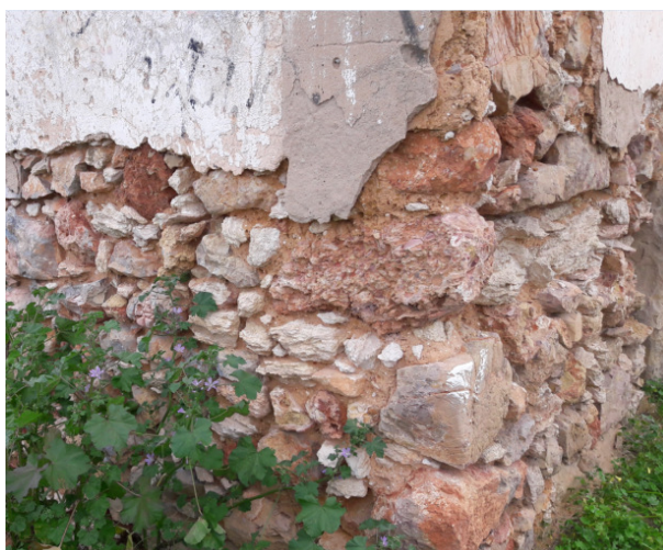
Figura 4. Exemplo do tipo de alvenaria existente na zona costeira do Algarve (foto tirada na freguesia de Albufeira).

O nível de vulnerabilidade sísmica das construções tradicionais do Algarve, executadas em alvenaria resistente, está intimamente relacionado com as características geológicas da região. Na serra algarvia predominam as construções de xisto, depois aparece uma faixa muito estreita onde existem construções em alvenaria com pedra mais ou menos aparelhada em arenito argiloso (o denominado "grés de Silves", de que é exemplo a construção da Figura 1), a que se segue uma zona com calcários de elevada resistência (de acordo com o resultados de ensaios laboratoriais [18]). Por fim, temos a zona costeira com alvenarias constituídas por pedras muito irregulares, onde é usual a existência de materiais com múltiplas origens na mesma parede (Figura 4), como, por exemplo, os denominados "caliços" (calcretos), os conglomerados, os arenitos e os calcários. Estas paredes combinam pedras de grandes dimensões, juntamente com pedras irregulares muito pequenas, normalmente ligadas com uma argamassa de fraca resistência, que se desfaz facilmente ao toque.