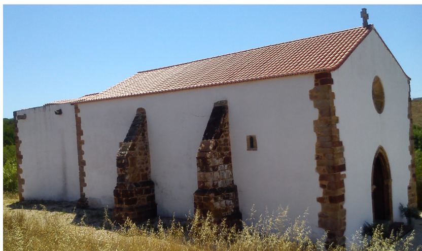
Figura 1. Estado atual da Ermida de Nossa Senhora de Guadalupe.

Tendo em conta toda a incerteza que reveste o risco sísmico do Algarve, no presente trabalho são apresentados alguns fatores que podem influenciar a segurança sísmica das construções tipicamente existentes em ARUs da costa algarvia.