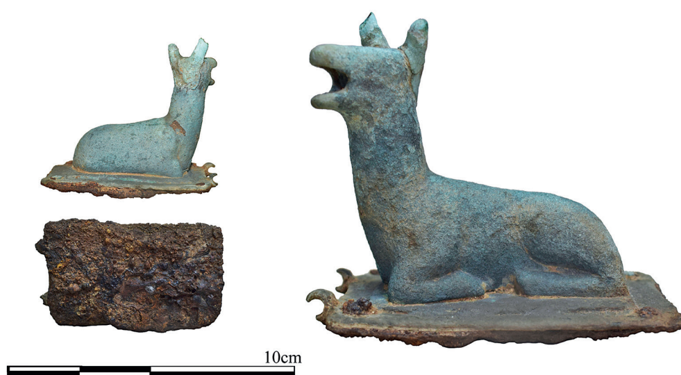
Figura 3 – Figura zoomorfa.

En cuanto a la figura zoomorfa, la cierva, presenta relieves de superficies suaves. Se dispone echada, con las cuatro patas flexionadas sobre el abdomen. La figura está bien proporcionada, aunque con un cuello un tanto engrosado para un cérvido. La cabeza es triangular y redondeada. En la parte superior destacan las orejas apuntadas, casi verticales, que sobresalen del relieve del animal. No aparecen rastros de relieve en la zona de los ojos. Presenta el hocico afilado y la boca abierta, en actitud de berrear, con la cabeza ligeramente erguida, como se colocan los ciervos en la época de brama. Esta representación de la boca abierta es recurrente en la mayoría de los cérvidos de los thymiateria . Las extremidades del lado izquierdo, sobre el que se inclina, se disponen paralelas a la base, sin distinguirse las pezuñas.