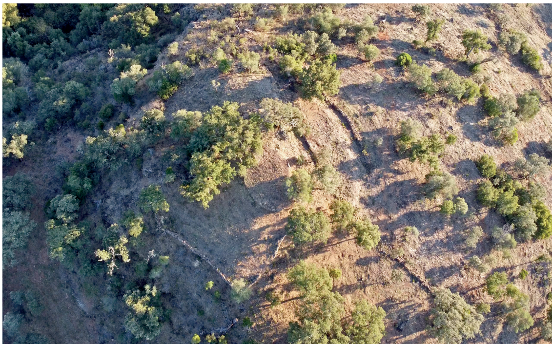
Figura 2 – Vista aérea del yacimiento Mezquita II.

presenta cierta dificultad, pero su ubicación responde a esta tipología de asentamientos en este territorio. El nuevo yacimiento se ha denominado Mezquita II (Fig. 2), dado que, en esa misma finca, ya la Carta Arqueológica recoge otro yacimiento. Su localización, apostado sobre una pequeña elevación junto a un meandro del río Chanza, da sentido a la necesidad de control del territorio y del agua. La primera inspección del yacimiento permitió identificar diversas estructuras en superficie, generando distintos niveles de terrazas, siendo el mayor el ubicado en la cima del cerro, enrasado, donde los lugareños recuerdan que existió una era o lugar de limpieza del grano.