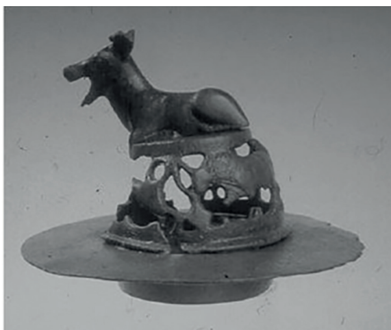
Figura 4 - Quemaperfume de Sierra de Fuentes (Cáceres). Museo de Cáceres (Enríquez y González, 2005: 45, fig.6).