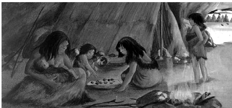
FIGURA 4. Cenas da vida doméstica... (Beaumont, 2000, p. 64).