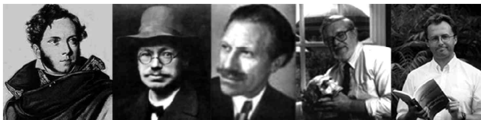
FIGURA 1. Faces, fatos e factos... Boucher de Perthes, Gordon Childe, Mortimer Wheeler, Lewis Binford, Julian Thomas.