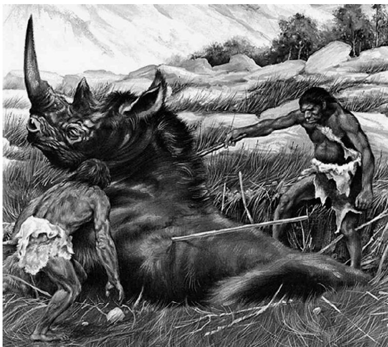
FIGURA 5. O lugar dos homens ( http://www.astrochem.org/bywb.htm ).