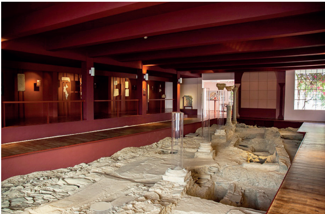
Figura 2 – Museu de Mértola/Basilica Paleocristã, inaugurada em 1993.

Ao longo do processo evolutivo do Museu entendeu-se que a melhor forma de apresentar os resultados da investigação era através da polinuclearização: uma museografia cuidada e adaptada a cada situação, expressa num diálogo natural entre as estruturas arqueológicas e os objetos, que dá a conhecer aos mertolenses, e a todos os que os visitam, uma realidade distante que ainda se pode identificar em tipologias, técnicas e tradições. A intenção nunca foi a de criar um grande museu. O objetivo sempre foi o de integrar o conhecimento histórico-arqueológico num âmbito