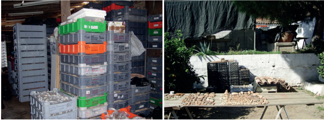
Figura 6 – Esq. aspeto do interior da zona de armazenamento de materiais cerâmicos localizados nas instalações da Rua da Igreja; dir. acumulação de materiais nas zonas exteriores.

Na primeira década do 2º milénio, com a intensificação das intervenções no centro histórico e arrabalde, assistiu-se ao crescimento exponencial do volume de materiais exumados e agudizou-se o problema do acondicionamento, em locais que se encontravam degradados e completamente subdimensionados e sem espaço para armazenamento. Neste período desenvolveram-se vários projetos museológicos 8 , o que colocou pressão sobre a atividade nas instalações da Rua da Igreja, manifestamente insuficientes e desadequadas. Os contentores com materiais começaram a dispersar-se por vários locais e a ser empilhados em zonas exteriores, sem condições de conservação e segurança, numa situação indigna para os bens patrimoniais.