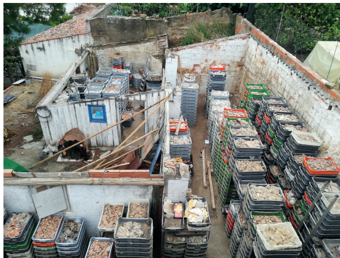
Figura 7 – Aspeto geral dos armazéns das instalações da Rua da Igreja, em fase de demolição e de transferência dos contentores com fragmentos cerâmicos.

Em 2004, a integração do Museu de Mértola na Rede Portuguesa de Museus e a assunção pela Autarquia deste como museu municipal 9 , levou à alteração de funcionamento e à procura de soluções para alguns problemas, entre eles os do inventário e conservação do acervo. A situação é de fácil solução e depois de várias tentativas, com implicações na conservação e gestão do acervo, só em 2018 se consegue uma viável, quando o panorama era já completamente insustentável e degradante.