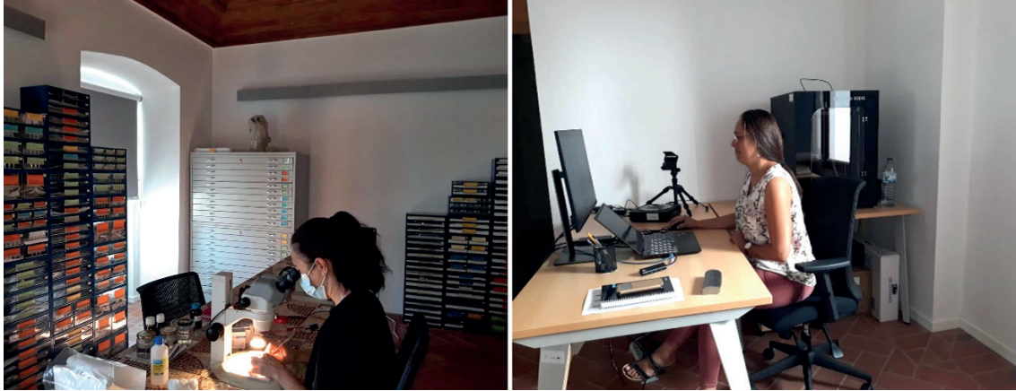
Figura 10 – Esq. aspeto geral do Gabinetes de Materiais não Cerâmicos; dir. Gabinete de Registo e Divulgação, ambos localizados na Área Técnica e Administrativa do Museu/Casa Branca.

Por outro lado, a melhoria nas condições de acondicionamento e acessibilidade possibilitou o avanço na informatização do inventário e a sua disponibilização online 12 , e permitiu uma clara melhoria nas condições de trabalho nas áreas da conservação e restauro, no estudo e investigação, na divulgação e no apoio às atividades educativas. A Tutela percebeu a importância das zonas menos visíveis do Museu e investiu no desenvolvimento de um projeto para a futura Área Técnica do Museu, que com o Arquivo Histórico e Municipal, serão instalados nos antigos celeiros da EPAC, edifícios que marcam a silhueta do Além-Rio, em Mértola (fot. 9). A obra, já em execução, enquadra-se num projeto mais abrangente que inclui a Estação Biológica de Mértola, a Galeria da Biodiversidade e a área Técnica do Museu e o Arquivo Municipal; as duas últimas contemplam zonas diferenciadas, adaptadas às tipologias dos acervos, e outras partilhadas por uma questão de otimização de espaço e de recursos.