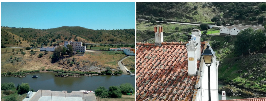
Figura 11 – Edifícios de antiga moagem e celeiros da EPAC cuja dimensão e imponência marca a silhueta do Além-Rio de Mértola.

A futura Área Técnica do Museu está virada ao Guadiana, com uma vista privilegiada sobre o centro histórico de Mértola. Terá cerca de 900m 2 , distribuídos por 2 pisos tendo no Piso 0 as reservas de materiais cerâmicos e não cerâmicos e osteológicos, uma área para materiais em trânsito e outra para a receção de grandes volumes. O Piso 1 é caracterizado por um laboratório e uma sala de trabalho ampla, uma sala polivalente, sala para fotografia e inventário, uma área de reserva de materiais etnográficos (de pequena/média dimensão), 5 gabinetes, e outras zonas