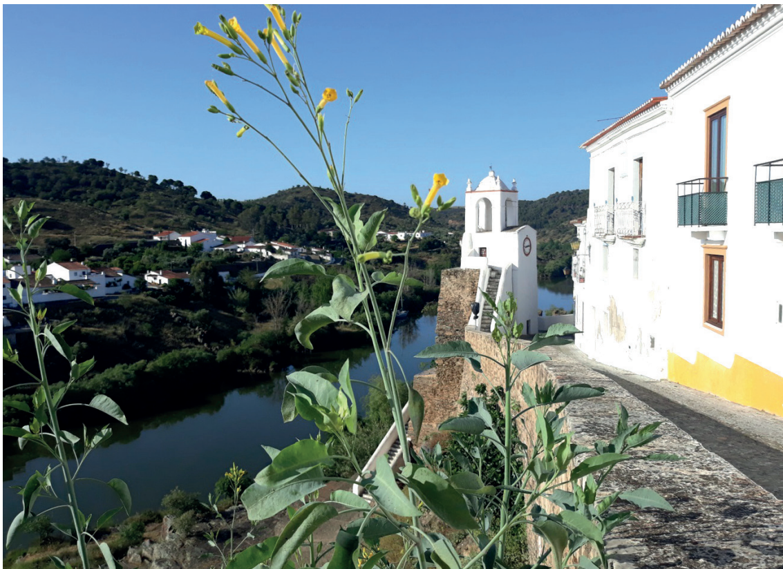
Figura 1 - A Vila de Mértola virada ao Guadiana, razão da sua existência desde tempos imemoriais.

Em Mértola, as últimas 4 décadas de trabalhos arqueológicos resultaram num acervo de dimensões consideráveis, de grande diversidade material e tipológica e com necessidades diversificadas ao nível do acondicionamento e das condições de preservação. A busca de soluções tem sido uma luta de muitos ao longo dos últimos anos. Felizmente estamos a virar a página! Um movimento lento, mas concreto e seguro, que se consubstancia na melhoria ao nível das instalações, das condições ambientais e de acessibilidades, com claras implicações na valorização e divulgação do acervo do Museu.