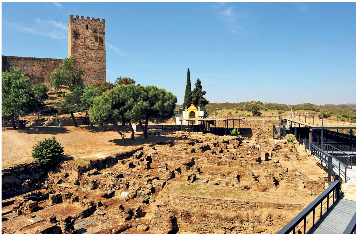
Figura 5 – Vista geral da intervenção arqueológica da Alcáçova.

Por outro lado, o trabalho a desenvolver com o estudo e tratamento de materiais, alguns já expostos nos primeiros núcleos do Museu de Mértola 6 , inaugurados nos finais dos anos 80 e durante a década de 90, a par da necessidade de intensificação do estudo e da intervenção prática de conservação e restauro, levaram à procura de um local mais adequado para a instalação do CAM 7 , com a possibilidade de ter zonas diferenciadas para investigação, gabinetes de conservação, registo gráfico e fotográfico, biblioteca e centro de documentação, entre outras. Esta Associação, que assumia na altura a gestão dos núcleos museológicos e todo o trabalho de investigação histórico-arqueológica, instalou-se numa habitação do centro histórico, localizada na Rua da Igreja, que dispunha de um quintal que dava acesso direto à Muralha Norte, a escassos metros da Alcáçova. Aqui se ergueram armazéns para acondicionar os fragmentos cerâmicos e pétreos, se instalaram os gabinetes de conservação, desenho e fotografia, e de apoio à investigação e funcionamento da instituição.