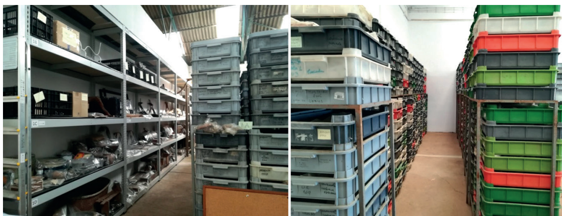
Figura 9 – Aspeto geral da Área Técnica da Mina de S. Domingos onde se localiza a reserva de arqueologia e de etnografia.