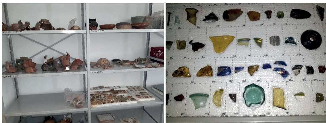
Figura 8 – Esq. aspeto do Gabinete de materiais cerâmicos; dir. acondicionamento de materiais não cerâmicos (vidros), ambos localizados na Área Técnica e Administrativa do Museu/Casa Branca.

Em junho de 2018, iniciou-se a demolição dos armazéns da Rua da Igreja e os materiais arqueológicos (cerâmicos e pétreos) e os etnográficos foram reacondicionados, transportados e reorganizados, num armazém de grandes dimensões, na localidade de Mina de S. Domingos 10 . Para além desse local, que oferece melhores condições, o Museu dispõe de mais 3 zonas de reserva diferenciadas: uma no núcleo de Arte Islâmica (reserva de cerâmica inventariada e restaurada); uma outra no Largo da Misericórdia para materiais osteológicos; e uma última na área Técnica e Administrativa do Museu – Casa Branca 11 , onde se encontram os materiais não cerâmicos (metais e ligas metálicas, osso trabalhado e vidro). Esta alteração não sendo a ideal corresponde a uma situação de compromisso e preocupação com a preservação dos materiais, com maior dignidade e respeito pelos vestígios do passado.