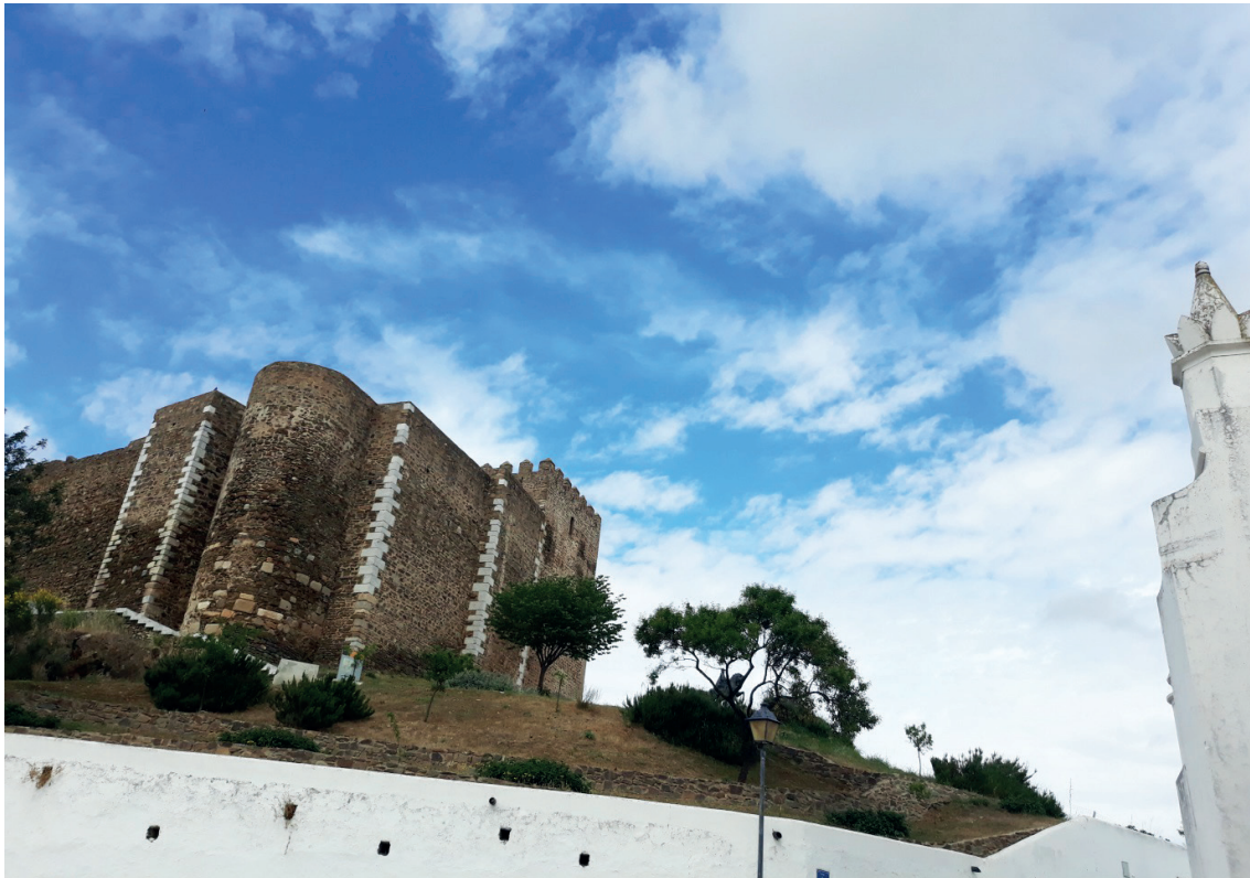
Figura 4 – Perspetiva do Castelo de Mértola, nas imediações o qual se localiza a principal zona de intervenção arqueológica – a alcáçova e encosta do Castelo.

A continuidade e o sucesso desta aliança entre museus, património e turismo residem no envolvimento da comunidade e na manutenção de uma forte parceria entre os diversos agentes locais, cimentada numa estratégia com objetivos e metodologias convergentes. O foco deve ser a continuidade numa investigação séria e de qualidade, em que os resultados se traduzem em novos projetos, exemplares em termos qualitativos e inovadores, capazes de atrair a Mértola um afluxo de visitantes/turistas que possibilitem a fixação da população e a sua sustentabilidade. O património enquanto recurso é quase inesgotável pelo que, as últimas 4 décadas constituem o início de um caminho que deve afirmar-se e reinventar-se enquanto efetivo motor de desenvolvimento deste território.