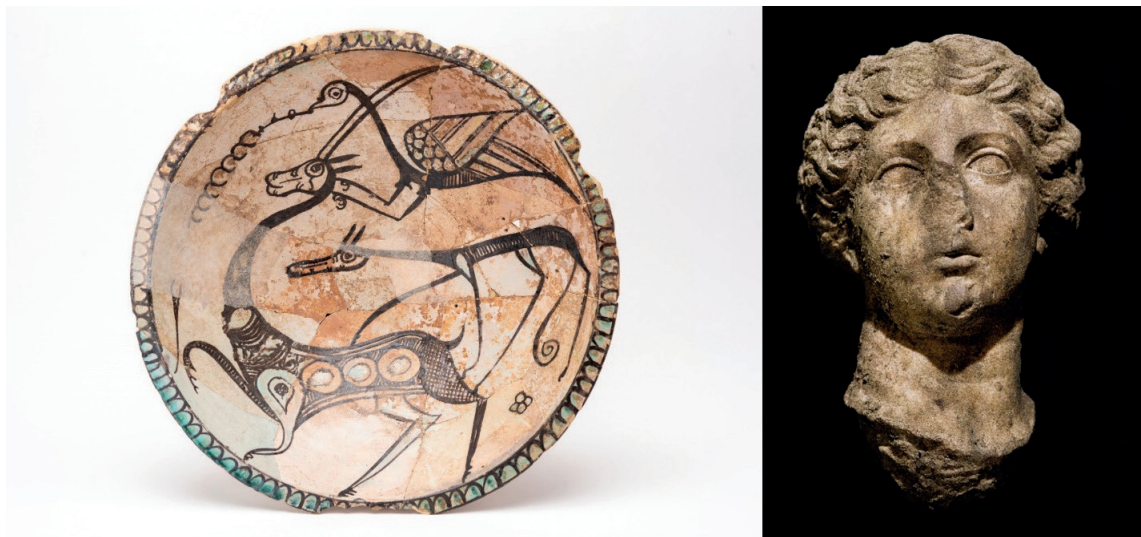
Figura 3 – Esq. tigela com cena de caça (2ª metade do século XII); dir. cabeça feminina de estátua do período romano resultante de uma intervenção arqueológica realizada em 2018 no centro histórico.

É evidente a importância da investigação nas mais diversas áreas, materializada na excelência e diversidade dos suportes de divulgação, assumindo especial destaque nos projetos museográficos. Trata-se de um processo dinâmico, que se renova e redescobre ao longo do percurso, e que tem na candidatura a Património Mundial o seu novo desafio. O Bem Mértola integra, desde 2016, a Lista Indicativa Nacional do Património Mundial da UNESCO 3 .