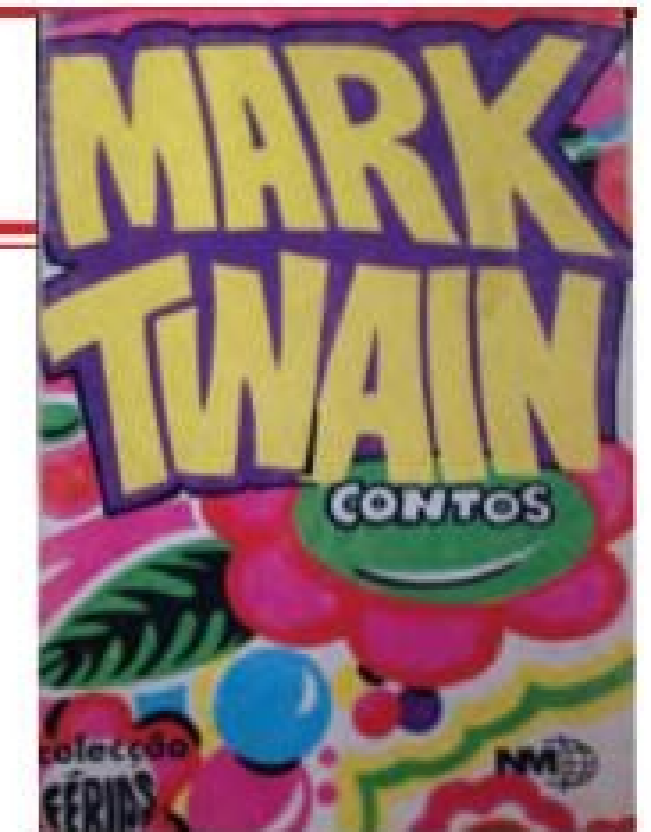
'Contos' de Mark Twain

marítima, não podiam permitir que houvesse uma ilha que não fosse sua aliada. O diálogo é cru: