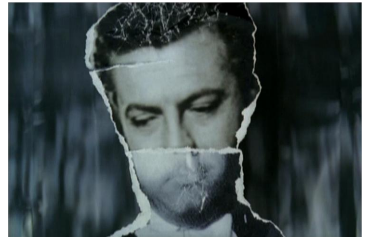
fotograma de Fast Film de Virgil Widrich