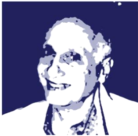
Michel Ocelot N. Versailles, França 8, Maio, 1963

O estilo das animações de Lotte Reiniger e as próprias características desta forma de animação fizeram com que fosse usada por diversos animadores, sobretudo realizadores independentes, com resultados bastante diferentes. A sua influência é bastante notória no conjunto de curtas-metragens de silhuetas chamado “Princes et Princesses” (1999) do francês Michel Ocelot.