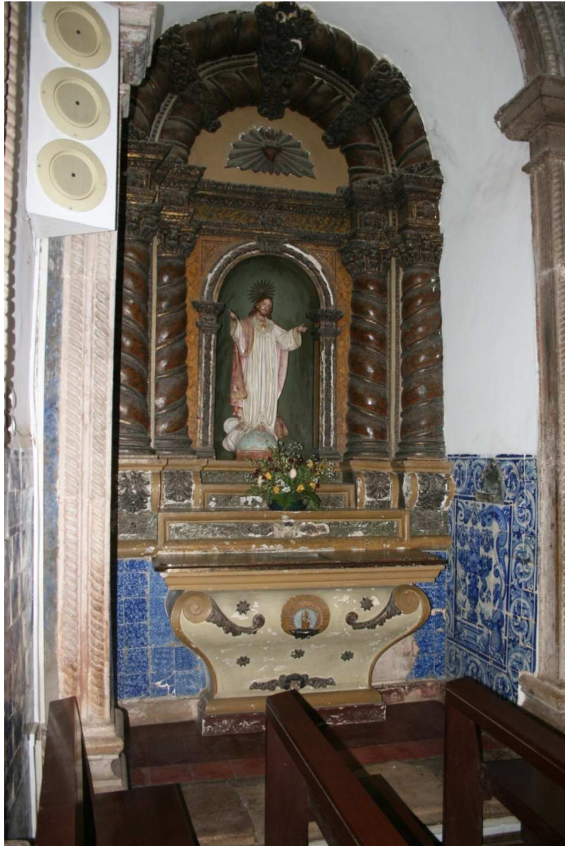
Figura 4 – Altar lateral gêmeo – Sagrado Coração de Jesus