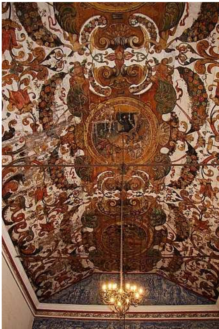
Figura 5 – Pintura do tecto da nave