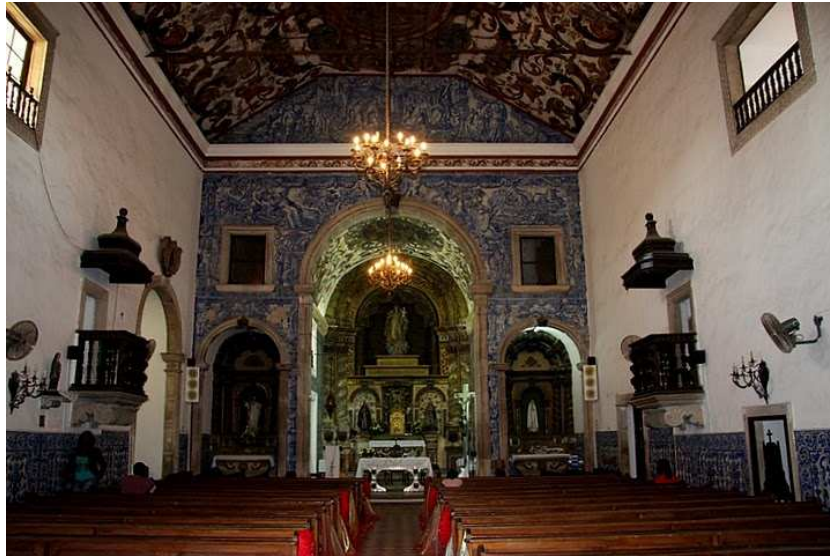
Figura 2 – Nave e frontispício da capela-mor