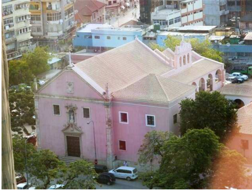
Figura 1 – Igreja do Antigo Convento de Santa Teresa de Luanda