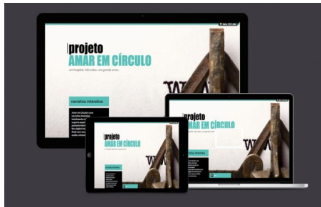
Figura 1 – Produtos a ser concebidos no âmbito do projeto Amar em Círculo

Criado em 2013, o projeto Amar em Círculo afirma-se, acima de tudo, como uma proposta para pensar a relação entre as novas tecnologias e a literatura, sob o viés da criação literária em ambientes digitais.