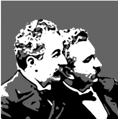
Auguste Marie Louis Nicholas Lumière Nasceu em: Besançon, 19 de Outubro de 1862 Faleceu em: Lyon, 10 de Abril de 1954