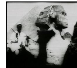
1897 Les pyramides (vue générale)