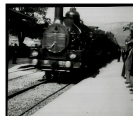
1896 Arrivée d'un Train en Gare à la Ciotat