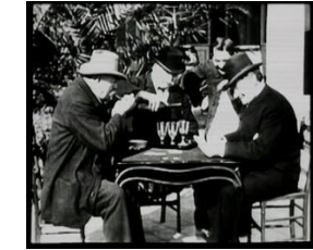
1895 Partie de cartes