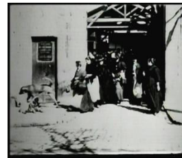
1895 La sortie de l'Usine Lumière

28 de Dezembro de 1895 (Salon Indien, Grand Café no Boulevard des Capucines, 14, Paris) “Saída dos Operários da Fábrica Lumière” Fotografias em movimento – revolução técnica e científica na projecção de imagens Filmes de 1 take (sem montagem) Documentários (“vistas de locais ou acontecimentos”) Filmagem no exterior Câmara fixa (esporadicamente surgem travellings) Enquadramentos abertos (predominam os planos de conjunto) Expansão do cinema