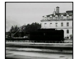
1896 Arrivée à Lyon