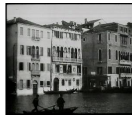
1896 Arrivée en Gondole à Venise