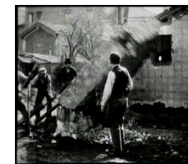
1896 Démolition d'un mur