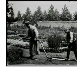
1895 L'arroseur arrosé