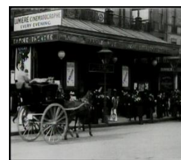
1896 Entrée du Cinématographe