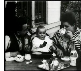
1895 Repas de bébé