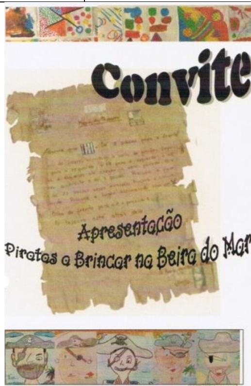
Quadro 10 – Atividades Espaço para o Gesto e Brincadeiras – junho/2007