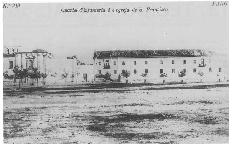
Figura 1. Antigo Convento de São Francisco em Faro durante a sua utilização como quartel do Regimento de Infantaria de Faro.