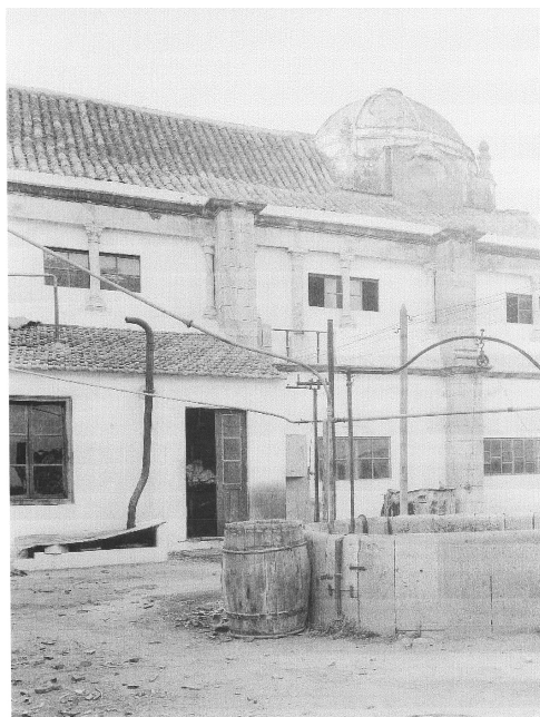
Figura 2. Claustro do antigo Convento de Nossa Senhora da Assunção em Faro durante a utilização do edifício como fábrica de cortiça.