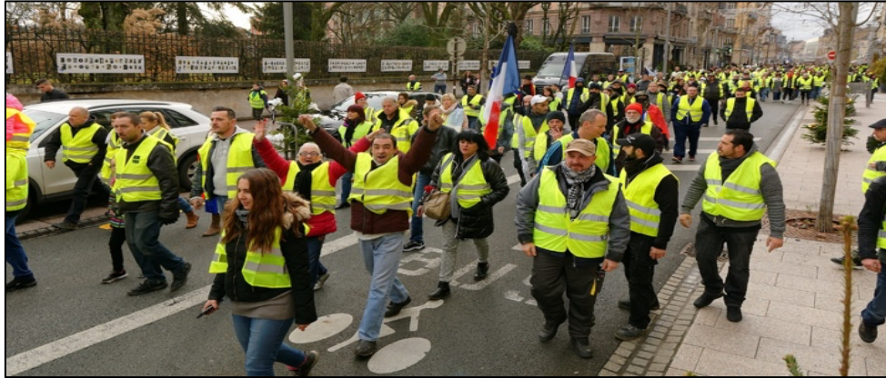
Figura 2.2 - Protestos dos "Coletes Amarelos"