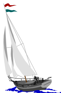
Figura 1. Exemplo (Microsoft © 1997)

Para introduzir a legenda Figura repetir os passos i) e ii), e substituir Quadro por Figura em i)