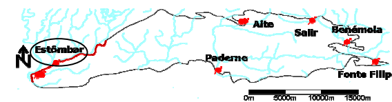
Geometria do Aquífero Querença-Silves e Localização das suas principais nascentes (adaptado de Monteiro, 2006).

Este sistema (também conhecido por aquífero Lias-Dogger) desenvolve-se em dolomitos e calcários do Jurássico inferior (entre 200 e 176 M.a.) e médio (entre 176 e 161 M.a.). Ocupa uma área de aproximadamente 317 km 2 , estendendo-se por uma faixa de direcção E-W, com cerca de 45 km de extensão e largura variável, diminuindo gradualmente para ocidente, desde Querença até Estômbar, abrangendo os concelhos de Loulé, Albufeira, Lagoa e Silves.