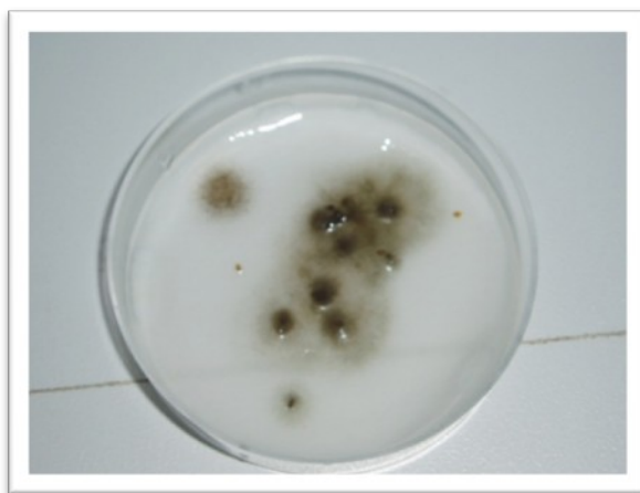
Figura. IV.1 – Fungos desenvolvidos nas placas com sementes pré tratadas com 120°C- 5 e 10 minutos; 140°C – 1,5 e 10 minutos.

O primeiro ensaio teve início no dia 10 de Agosto de 2007, tendo tido uma duração de 60 dias. Durante este ensaio, 8 a 10 dias após a sementeira, verificou-se a presença de fungos nas sementes com os pré tratamentos de 120°C – 5 e 10 minutos e 140°C -1, 5 e 10 minutos.