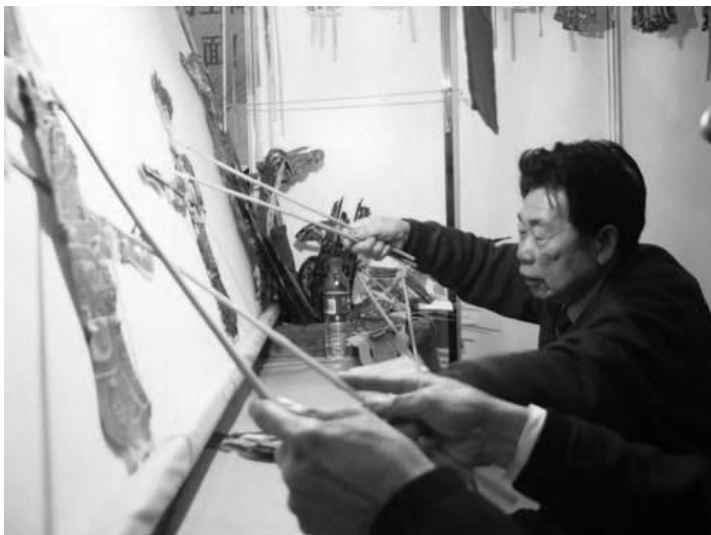
Representação da companhia de teatro de sombras, Shanhua, da cidade de Zaozhuang, na China

Apesar de serem vulgarmente conhecidas por sombras chinesas, acredita-se que as primeiras apresentações de silhuetas projectadas sobre uma parede ou uma tela tenham surgido na ilha de Java (Indonésia). As marionetas de sombras estenderam-se por toda a Ásia, ao Norte de África no sec. XIII e chegaram à Europa no sec XVII. Em 1784 foi criado por F. D. Séraphin um teatro de sombras fixo em Paris no Palais Royal. Actualmente, é na China que continua a ter mais divulgação principalmente nas zonas rurais, por se tratar de uma arte tradicional.