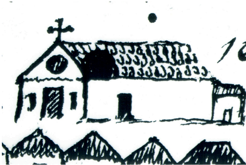
Figura 2 – Igreja de Nossa Senhora das Dores de Monte Gordo.