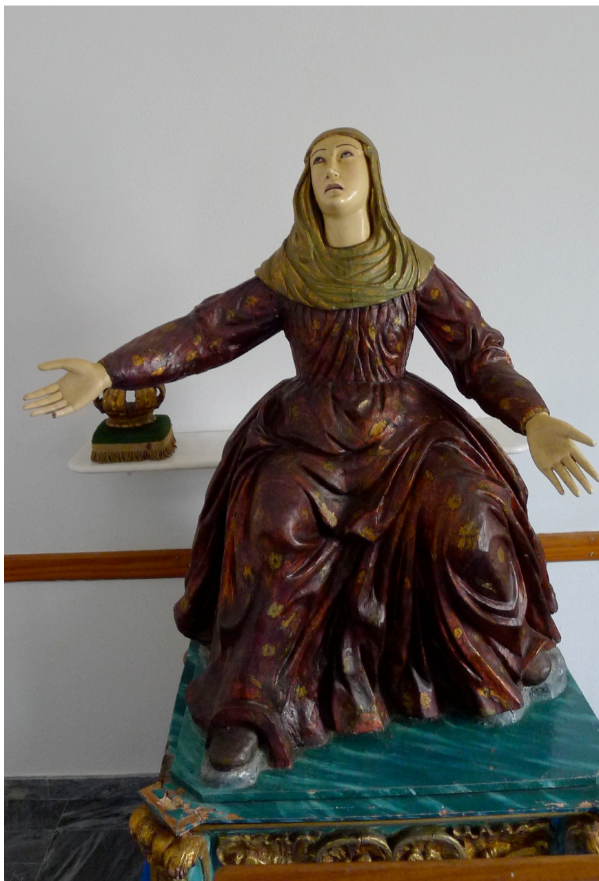
Figura 6 – Senhora das Dores sentada (finais do século XVII?).