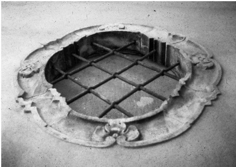
Figura 5 – Óculo da portaria do convento da Graça de Tavira.