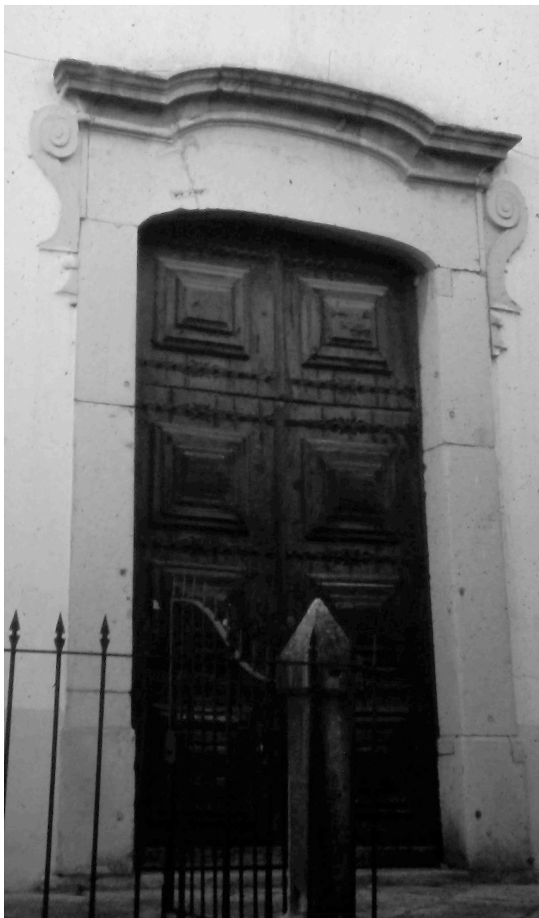
Figura 3 – Porta do convento de São Francisco de Tavira.