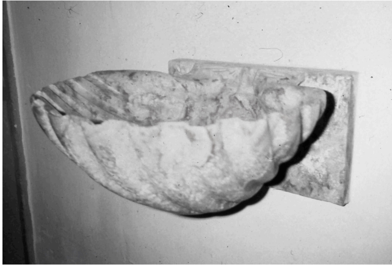
Figura 4 – Pia de água benta da igreja de São Paulo de Tavira.