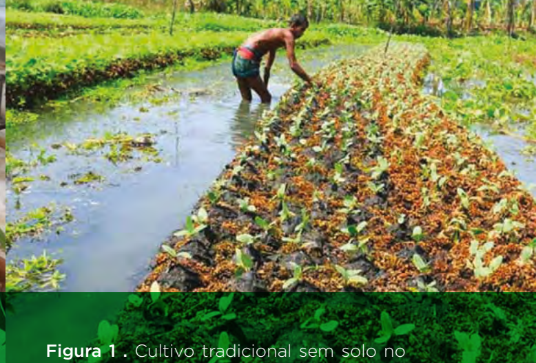
Figura 1. Cultivo tradicional sem solo no Bangladesh

O cultivo sem solo (CSS) é usado há séculos, mantendo-se ainda hoje alguns sistemas tradicionais na América Central e no Sudoeste Asiático (Fig. 1). No Ocidente, o CSS em escala comercial iniciou-se no final dos anos 30 do séc. XX (Gericke, 1937), e evoluiu rapidamente devido ao desenvolvimento de novos materiais e tecnologias (Steiner, 1977; Resh, 1997; Stoner, 1983; Schwarz, 1995; Urrestarazu, 2004)