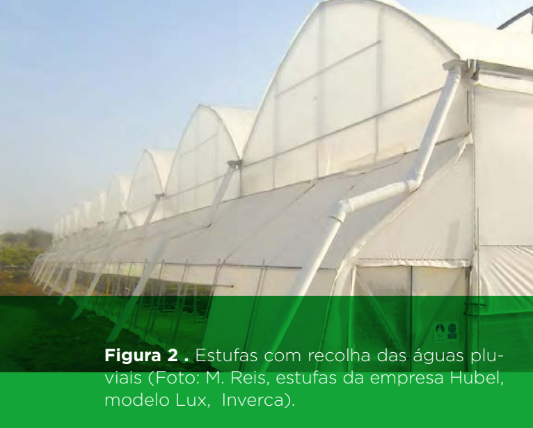
Figura 2 . Estufas com recolha das águas pluviais (estufas da empresa Hubel, modelo Lux, Inverca).

ção urbana da população, a horticultura urbana e peri-urbana (UPH, Urban and peri-urban horticulture ) constitui já uma parte significativa da produção de hortícolas frescos: 50% em Pequim, ou 60% da produção de Cuba em Havana (Pantoja, 2013), apoiada com numerosos projetos de CSS em meio urbano em desenvolvimento, incluindo em Portugal, como o caso do mercado de Arroios.