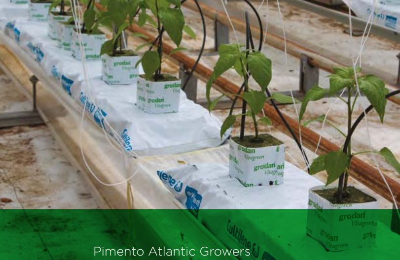
Pimento Atlantic Growers