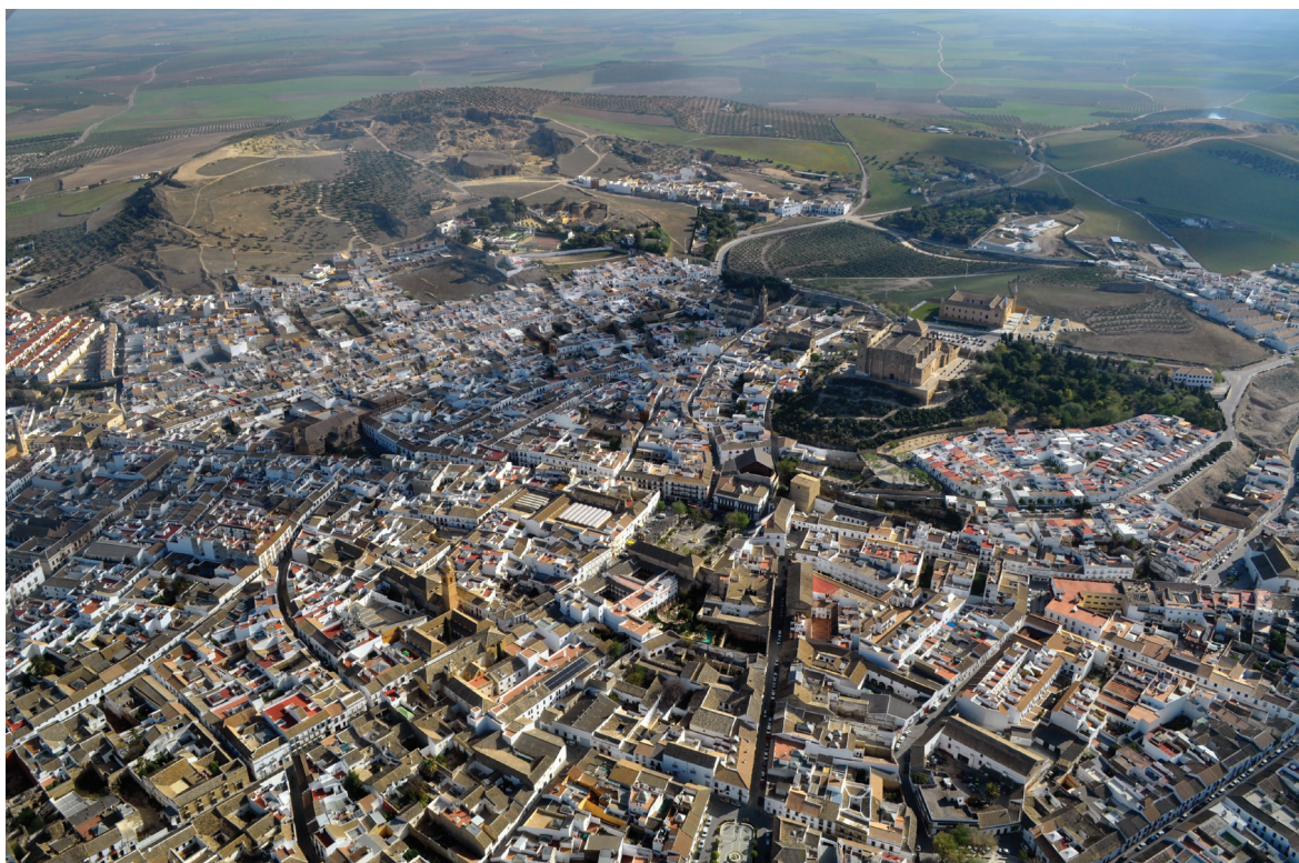
Fig. 1 Vista aérea de Osuna, con la Zona Arqueológica en el área superior

se proyecta en un rico patrimonio arquitectónico y en las numerosas fundaciones religiosas, asistenciales o civiles asociadas (García Hernán, 2007). Esta situación se prolongó hasta el final del Antiguo Régimen y la transformación de estos centros, en las agrocidades que hoy conocemos. Resulta evidente, pues, que el fenómeno urbano en Andalucía es el resultado de un proceso de longue durée que afecta, especialmente, a las ciudades medias del interior y, entre ellas, a los centros encaramados de la campiña y la sierra Subbética.