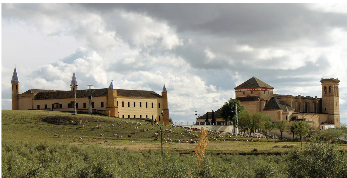
Fig. 2 Vista del área monumental de Osuna, con la Universidad y la Colegiata

A partir de ese momento se inicia un ambicioso programa constructivo que dota a la ciudad de un enorme patrimonio arquitectónico (fig. 2), como la Colegiata de Santa María de la Asunción, la Universidad de la Santa Concepción, el Hospital de la Encarnación, así como numerosos conventos y monasterios. Durante el periodo barroco este patrimonio inmueble sigue creciendo con nuevos edificios religiosos y edificaciones civiles de gran calidad que se establecen, principalmente, en tres calles cercanas al conjunto monumental. Debido al declive de la casa de Osuna desde el siglo XIX, la ciudad apenas acusa una transformación urbana en las últimas centurias, mientras que la tradición agrícola y ganadera, base de