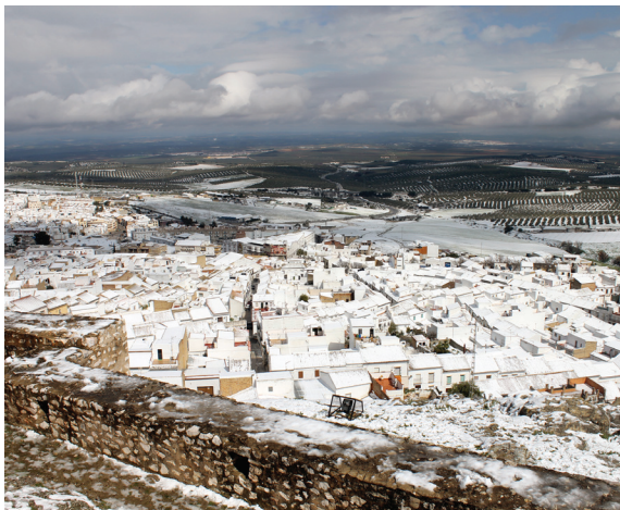
Fig. 5 Vista de Estepa y la campiña desde el área fortificada elevada

la expansión urbana por la ladera norte del cerro (fig. 4). Ya a mediados del siglo XVI, Felipe II transformó la encomienda militar en un señorío, el Marquesado de Estepa. En este momento se inicia el proceso de monumentalización de la villa, que la dota de un rico patrimonio arquitectónico, principalmente religioso, que se suma a la antigua mezquita y posterior iglesia de Santa María (Hernández Díaz et al. , 1955).