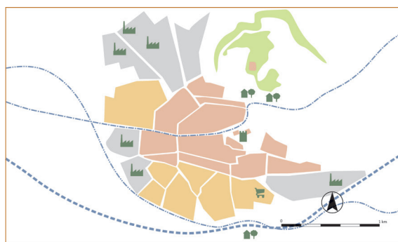
Fig. 3 Esquema del desarrollo urbano y los principales hitos de Osuna

Este último habría cumplido la función central ya en época romana y, especialmente, a partir de la Baja Edad Media, cuando se asiste a una nueva etapa de su monumentalización. En efecto, desde finales de la Antigüedad las evidencias arqueológicas que conocemos son tenues, al menos hasta época hispanomusulmana, cuando la población ya se había trasladado hacia la