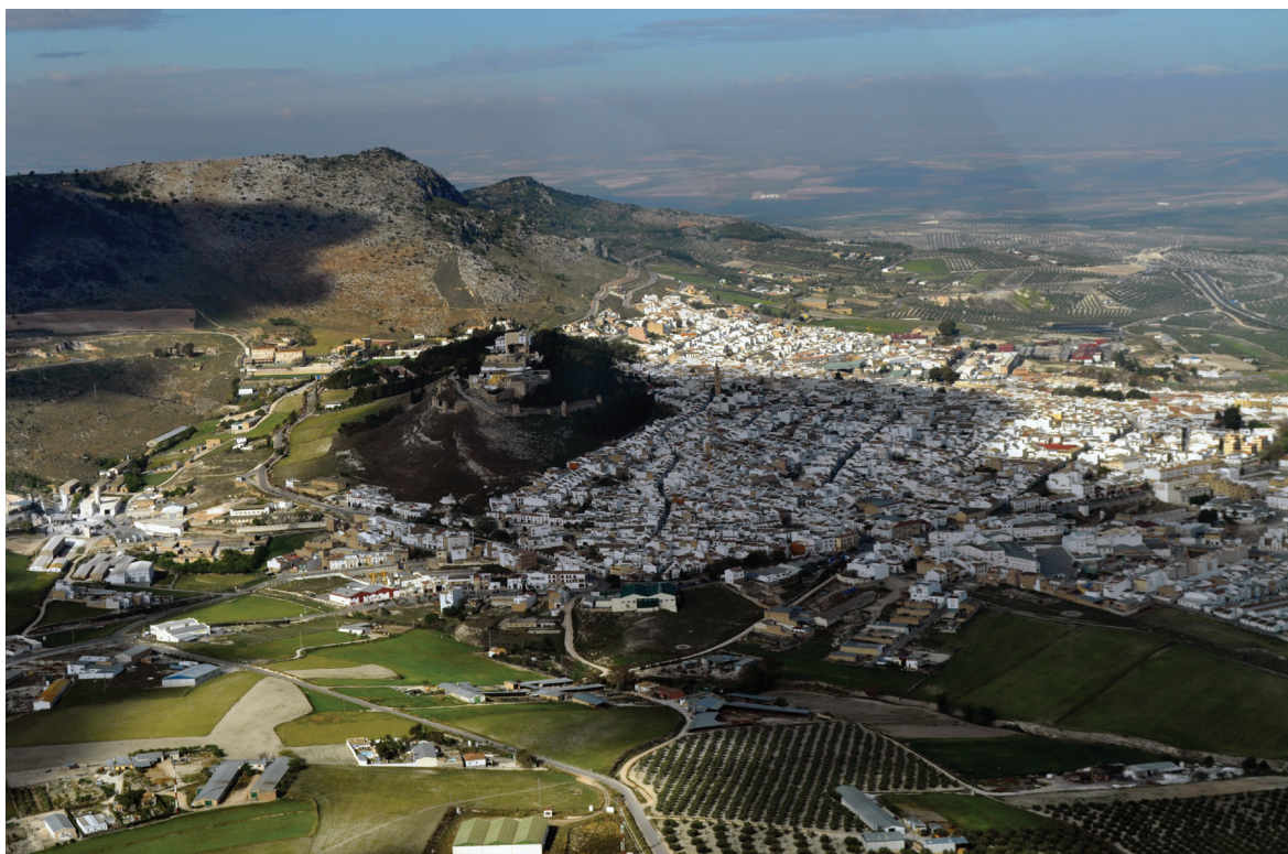
Fig. 4 Vista aérea de Estepa, con el Cerro de San Cristóbal a la izquierda (Grupo de Investigación HUM-152 “De la Turdetania a la Bética”)

su economía y parte de su caracterización patrimonial y productiva, se mantiene hasta la actualidad (Ledesma, 1999).