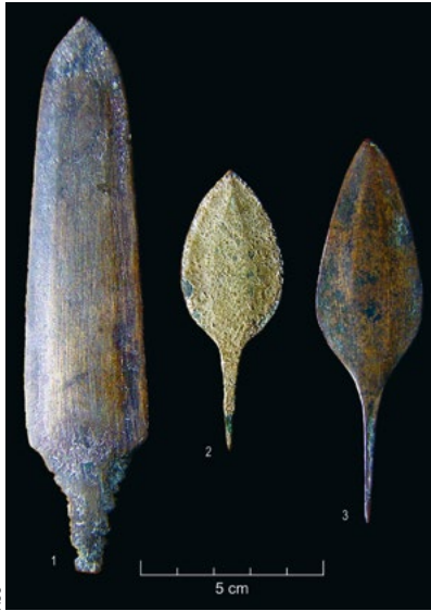
Punhal de lingueta e duas pontas Palmela da sepultura epicampaniforme de Montelavar (Sintra). Museu Geológico do LNEG.

tuam-se, como acima se referiu, os vasos marítimos, cujas funções ou valor social «ultrapassam amplamente o simples uso quotidiano», como justamente salientou Laure Salanova em 2005.