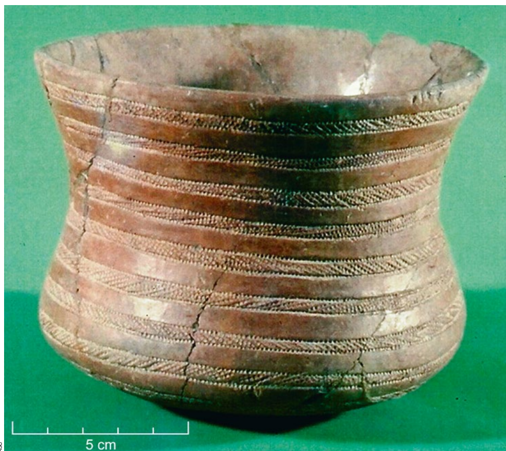
Vaso marítimo recolhido na gruta artificial n.º 2 de Alapraia (Cascais).

Por outro lado, na Estremadura, tendo em consideração a existência de espaços, habitados ou funerários, com espólios exclusivamente campaniformes, admitiu