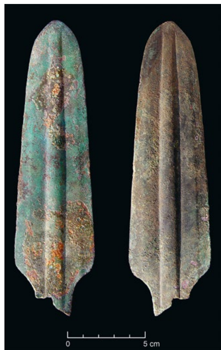
Alabarda de lingueta de cobre recolhida no povoado calcolítico fortificado do Outeiro Redondo (Palmela). Escavações e fotografias de João Luís Cardoso.

O incremento da importância destes itens , na transição para a Idade do Bronze, verificada ao longo do último quartel do 3.º milénio a.C. em todo o território português, pode ser associado à emergência de sepulturas individuais do tipo cista. Tal período de transição., no qual já não ocorriam os vasos campaniformes decorados, associa-se à tradicional existência de dois Horizontes arqueológicos epicampaniformes identificados no território português, um respeitante aos domínios a norte do Rio Tejo, o Horizonte de Montelavar, o outro correspondente ao sul do mesmo rio, o Horizonte de Ferradeira, ambos com terminus cerca de 1800 a.C. Na verdade, estes dois horizontes deveriam fundir-se numa única designação, de tal forma são homogêneas as produções que os caracterizam.