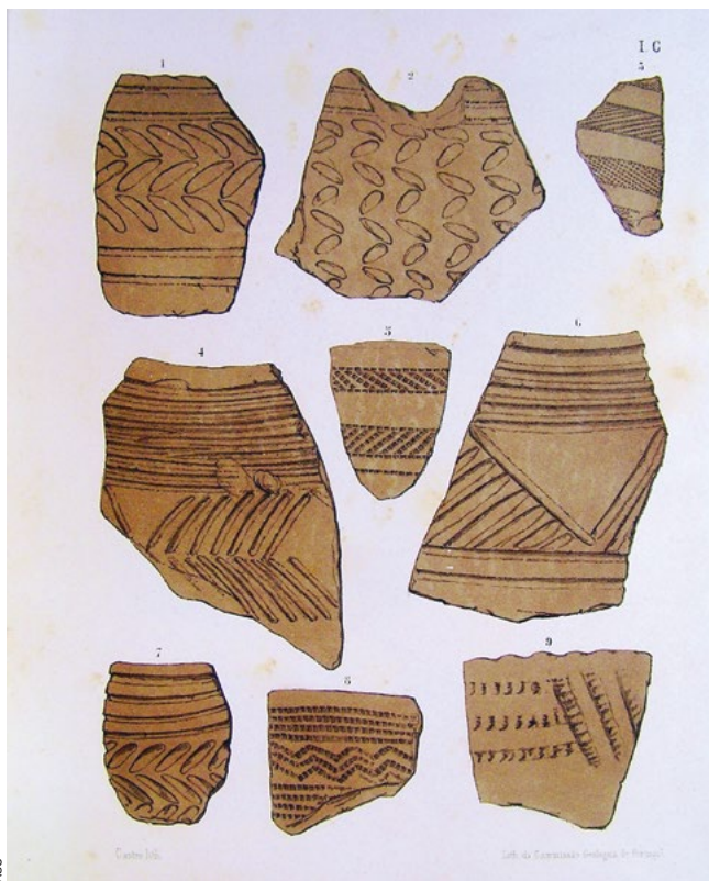
Litografia de conjunto de fragmentos de cerâmicas calcólicas do povoado da Rotura (Setúbal), destinada a integrar álbum sobre a Pré-História Portuguesa por ocasião da Exposição Universal de Paris de 1867, o qual jamais chegou a realizar-se. Os exemplares n.ºs 3 e 8 correspondem aos primeiros fragmentos de vasos campaniformes estudados do território português e dos primeiros a nível europeu.