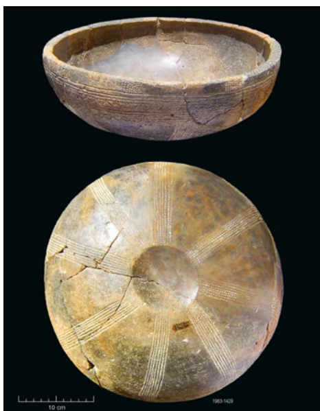
Grande taça Palmela, com «omphalos» na zona central da base, para permitir maior estabilidade do recipiente, da gruta artificial de S. Paulo II (Almada). Museu de Almada.