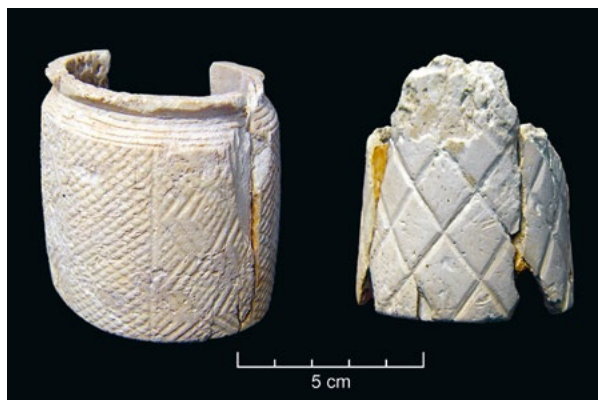
Dois boiões decorados de marfim, destinados a guardar cosméticos ou outras substâncias, da gruta artificial n.º 2 de S. Paulo (Almada). Museu de Almada.

Deste modo, o cruzamento dos dados genéticos com a cronologia absoluta das amostras analisadas veio dar credibilidade às influências campaniformes oriundas da Europa Central que aqui se teriam feito sentir a partir de 2500 a.C., através da