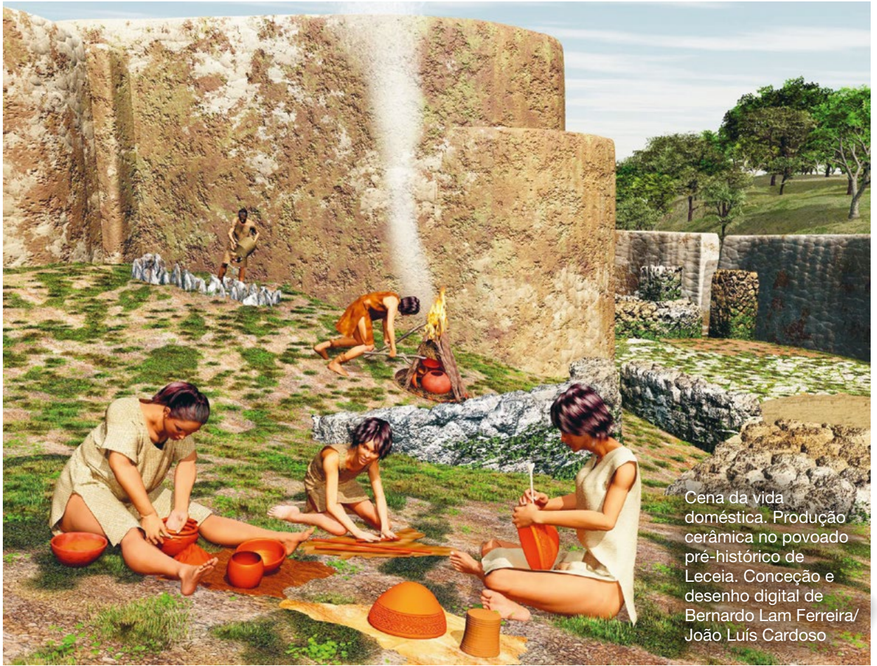
Cena da vida doméstica. Produção cerâmica no povoado pré-histórico de Leceia. Conceção e desenho digital de Bernardo Lam Ferreira/ João Luís Cardoso