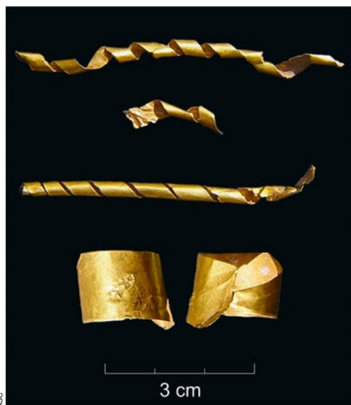
Objetos de ouro recolhidos na necrópole campaniforme da gruta natural da Verdelha dos Ruivos (Vila Franca de Xira). Observam-se finas tiras de ouro espiraladas, possivelmente adereços de cabelo ou de barba e uma folha recortada e dobrada, possivelmente utilizada como anel.

A circulação e comercialização de produtos preciosos, como é o caso do marfim, de origem norte-africana, teve também assinalável expressão nesta mesma época, atestando a existência de vias de comércio estabelecidas, neste caso, com o território marroquino, como comprovam objetos de indumentária, como os alfinetes de toucado de marfim comuns no Calcolítico da Estremadura, como os recolhidos em Leceia (Oeiras) a par de outras produções de luxo, como os boiões para a conservação de cosméticos ou unguentos, como os recolhidos na gruta artificial São Paulo 2 (Almada). Tais objetos de indumentária acompanham, por seu turno, a emergência de jóias de ouro, presentes em contextos já da segunda metade do 3.º milénio a.C. Estas produções, por seu turno associam-se a armas, também de cobre arsenical, cada vez de maiores dimensões, e mais sofisticadas, representadas por adagas longas e pelas primeiras espadas e alabardas, que corporizam a plena afirmação