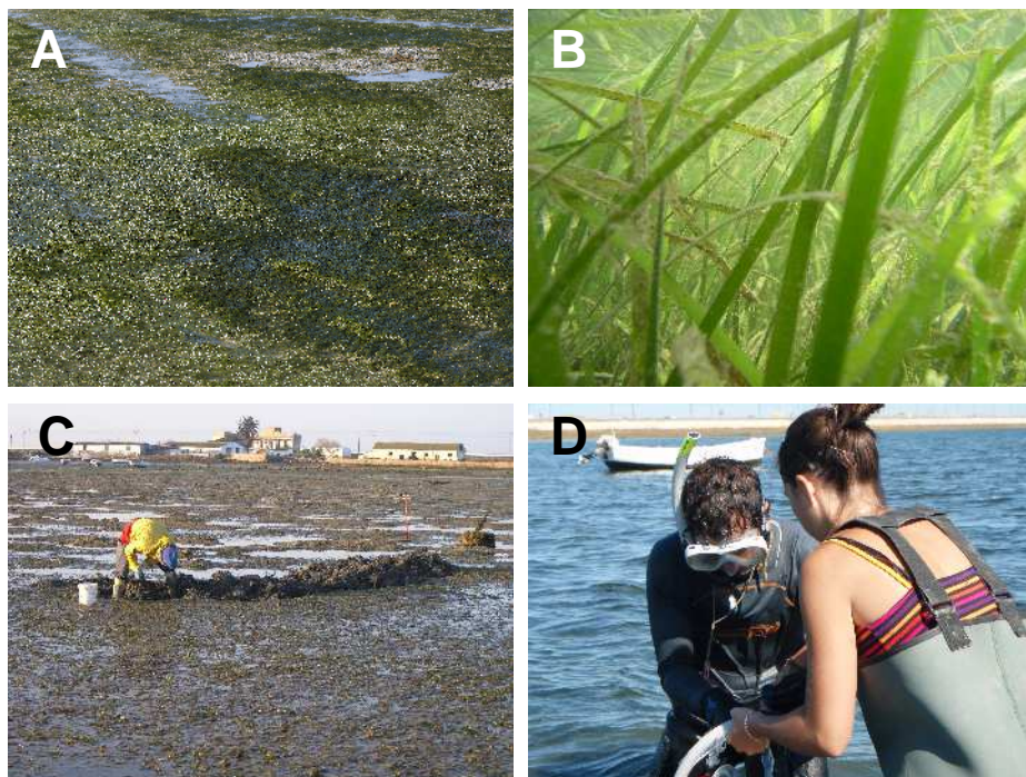
Figura 1. Praderas de fanerógamas marinas, impactos y voluntariado: (A) Pradera de Zostera noltii (“pelillos”) durante la marea baja, (B) pradera submareal de Cymodocea nodosa , (C) mariscador buscando “gusanos” en praderas de Z. noltii , y (D) voluntarios directos durante un muestreo del seguimiento ambiental.