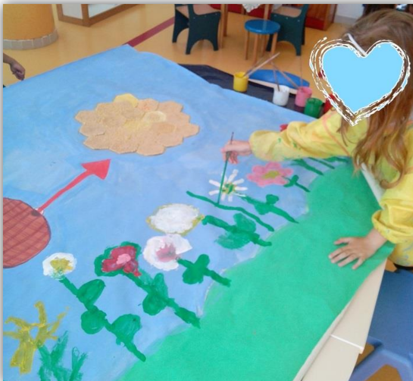
Figura 4.18- Criança C3 a desenhar a flor no painel

Na mesma semana que desenharam as abelhas, o grupo passou a trabalhar noutra atividade paralela, que consistia na construção de um favo de mel em forma hexagonal. Para o construírem tinham apenas que recortar a cartolina e em seguida colar massas para lhe dar relevo. Foi interessante verificar que o grupo participava com entusiasmo e se preocupava com o sentido estético, pois queriam preencher toda a cartolina com a massa. O nosso objetivo com esta parte da atividade era construir um favo em ponto grande, com todos os favos das crianças, formando deste modo um favo gigante em forma hexagonal. Foi bem visível a curiosidade das crianças para verem como ficaria o resultado final, uma vez que era necessária uma espécie de construção para formar o hexágono. Mesmo nesta parte da atividade foi importante a participação das crianças, pois queríamos que estas se envolvessem em todas as partes da atividade.