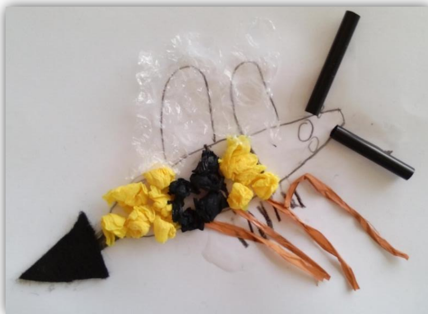
Figura 4.14- Abelha da criança C3 com patas feitas de rafia

“As patas da minha abelha vão parecer verdadeiras.” (C10)