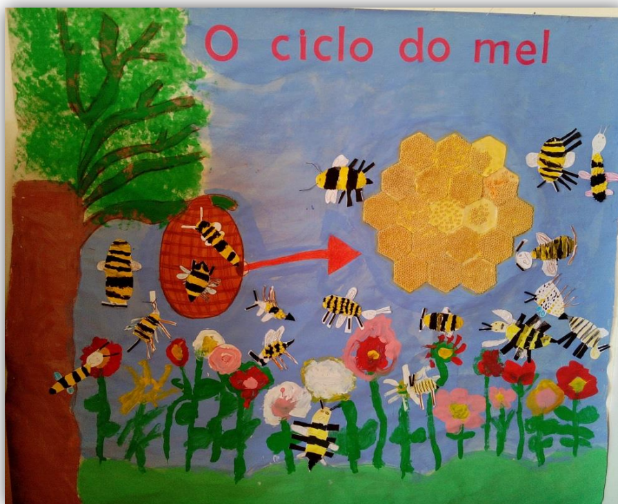
Figura 4.19- Paineil "O ciclo do mel" construído pelas crianças

o colocaríamos (figura 4.19), de modo a dar visibilidade a todo o jardim de infância e aos pais.