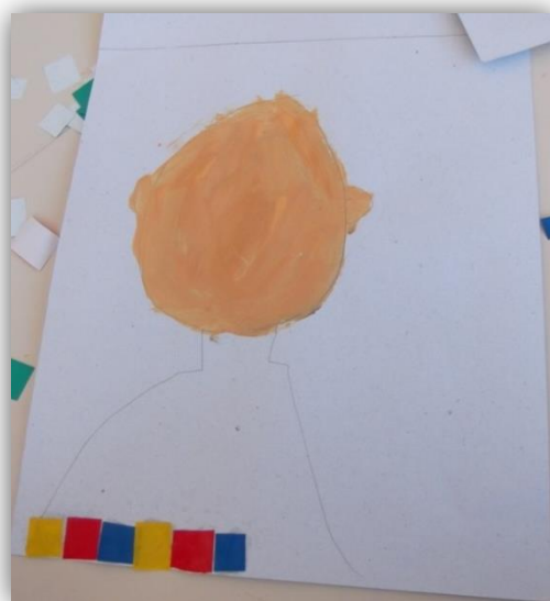
Figura 4.3- Padrão de repetição feito pela criança C16 na camisola

“Eu fiz um padrão na blusa do pai já viste?” (C16)