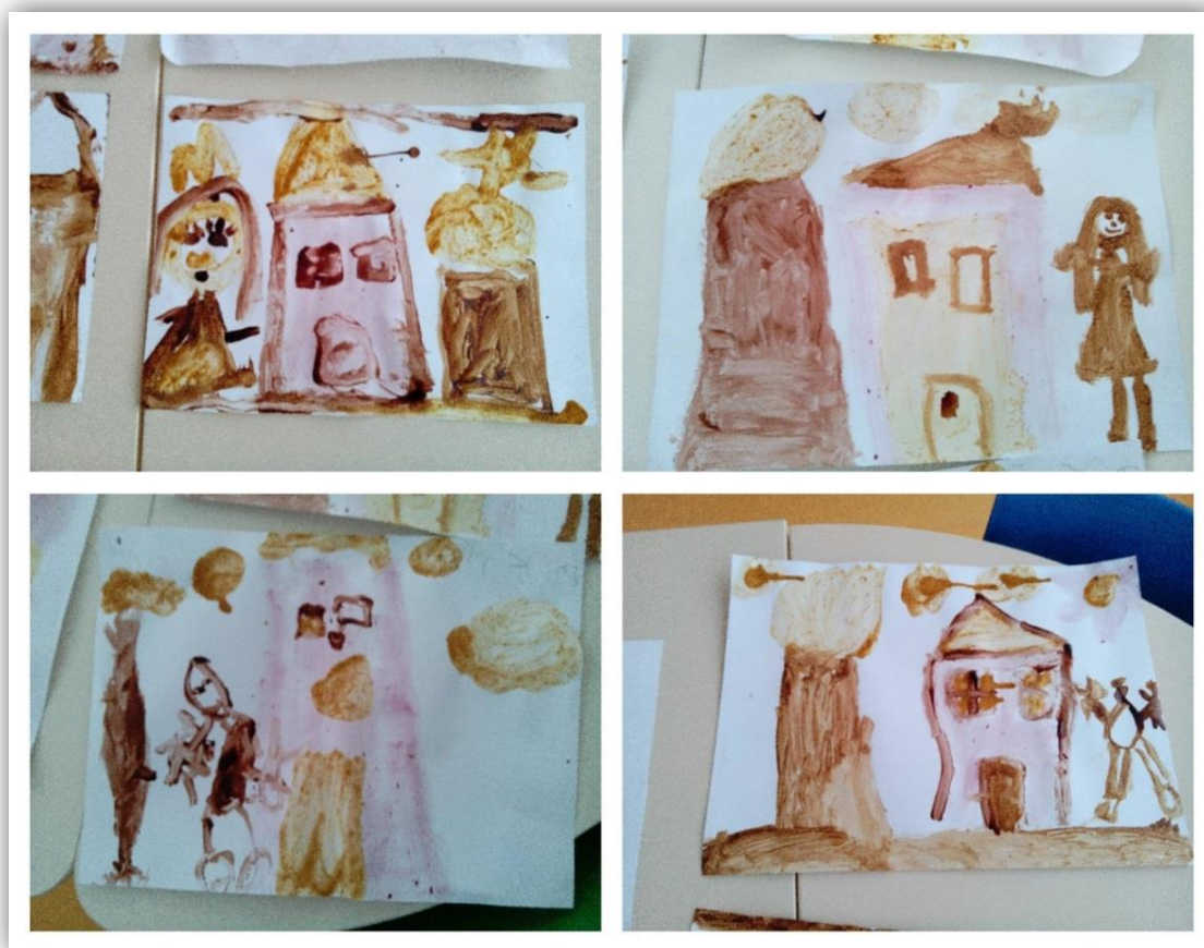
Figura 4.6- Produções das crianças C3, C8, C12 e C14

Das produções que fomos vendo, reparámos que o grupo não variava muito naquilo que desenhava, pois eram visíveis os mesmos elementos nas diferentes produções. Em quase todos os registos observámos uma casa, uma árvore, nuvens e uma menina ou um menino, consoante quem estivesse a desenhar. Destacámos também em alguns registos o sol e o céu, aspetos que são frequentes nos desenhos livres das crianças (figura 4.6). Deste modo verificámos que algumas das produções criativas ficaram limitadas aos aspetos mais comuns na prática do desenho.