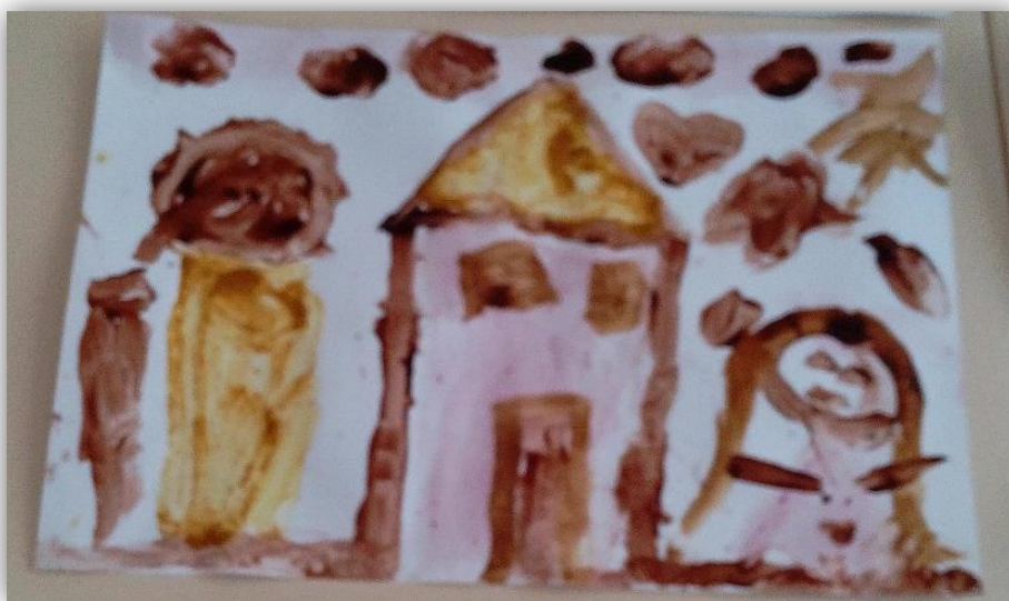
Figura 4.7- Contorno da casa feito no registo da criança C17

Apesar de quase todas as crianças terem utilizado os mesmos elementos nos seus desenhos, houve algumas que se preocuparam em utilizar diferentes “tintas” para fazer as diversas partes do desenho. Exemplo disso são as casas contornadas com uma “tinta” como se fosse uma linha (figura 4.7).