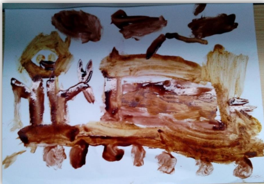
Figura 4.9- “Um comboio com nuvens e um menino a andar de comboio” desenhado pela criança C4

Por outro lado, a criança (C4) optou por desenhar, tal como nos disse: “(...) um comboio com nuvens e um menino a andar de comboio (...) ” (figura 4.9). Esta era uma das crianças que quando tinha trabalhos de expressão plástica para fazer, tentava acabá-los o mais rapidamente possível, sem se preocupar com o que realmente fazia. Pensamos que devido a ter acesso a materiais diferentes para essa atividade, a criança (C4) tenha tido uma preocupação acrescida em criar algo diferente e que estivesse mais próximo das suas preferências pessoais.