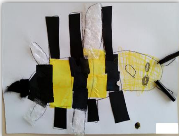
Figura 4.16- Abelha da criança C6 com as antenas feitas de palhinhas

Por último, mas não menos importante, observámos que houve uma grande parte do grupo que não desenhou o ferrão da abelha. Apesar disso, verificámos que entre as restantes crianças houve uma grande variedade na utilização de materiais, o que permitiu que existisse um maior desenvolvimento da criatividade. Neste caso, observámos que as crianças utilizaram diversos materiais como o feltro (figura 4.17), a cartolina, o papel de seda, a tinta com cotonete e até os lápis de cor para pintar.