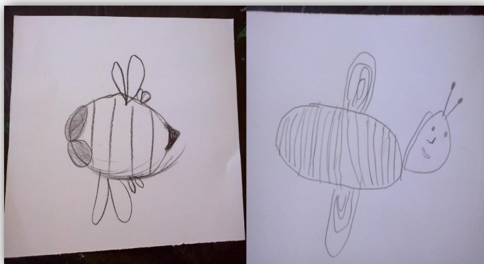
Figura 4.12- Abelhas das crianças C10 e C8 desenhadas a lápis de carvão

Pudemos observar através dos seus registos que as crianças desenhavam também as diferentes partes constituintes da abelha, as patas, as asas e as antenas.