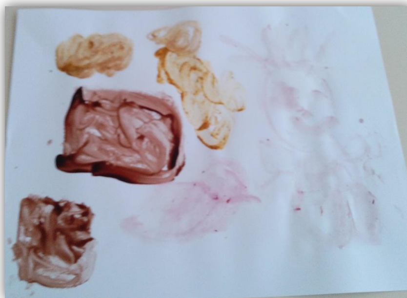
Figura 4.10- "Um menino a comer caril, chocolate, café e morango" desenhado pela criança C5

A criança (C5), por seu lado, tal como nos disse, desenhou “(...) um menino a comer caril, chocolate, café e morango (...)” (figura 4.10). Verificamos então, que esta criança no seu trabalho teve a preocupação em utilizar todos os elementos com cheiro. Neste caso, optou por desenhar através da sua imaginação um menino com a “tinta” de morango e fazer várias manchas espalhadas pela folha com tinta de vários sabores, dando-nos a entender que o menino estava a degustar os mesmos, tal como fizeram no jogo anteriormente descrito. Pode-se dizer que a criança foi criativa, pois foi capaz de criar um trabalho diferente das restantes crianças, de onde se destacaram todos os materiais utilizados.