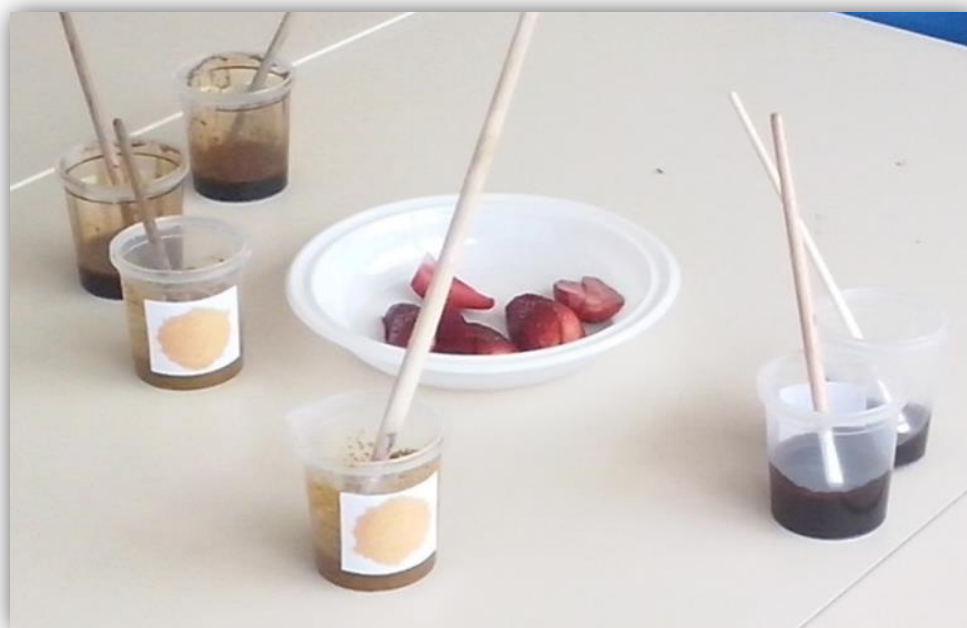
Figura 4.5- Tintas com cheiro (café, morango, chocolate e caril)

Dos diversos cheiros indicados anteriormente, seleccionámos em conjunto com as crianças apenas quatro para realizar a atividade plástica. Os cheiros elegidos foram o café, o morango, o chocolate e o caril (figura 4.5). Escolhemos estes quatro porque foram os que ganharam em consenso numa votação realizada com o grupo, como passaremos a falar mais à frente. Para realizarmos esta imitação da “tinta”, no café e no caril, juntámos apenas água aos ingredientes, o chocolate utilizámo-lo derretido e os morangos apenas recortados ao meio.