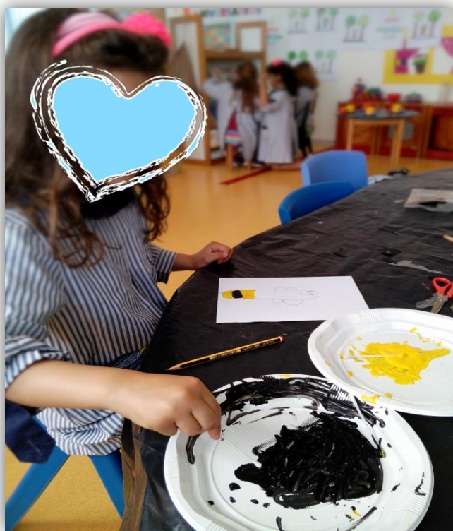
Figura 4.13- Criança C17 a pintar o corpo da abelha com tinta e cotonete

Para analisarmos melhor esta atividade, decidimos construir uma grelha que nos permitia observar quais os materiais que as crianças utilizavam nas suas construções. Assim, verificámos através da grelha de observação (apêndice XIX) que a maioria optou por realizar o corpo com riscas pretas e amarelas através da tinta com cotonete. É de salientar que dentro desta maioria, algumas crianças exploraram os cotonetes para fazer bolinhas com as respetivas tintas e outros acabaram por utilizar o cotonete como se fosse um pincel (figura 4.13). Observámos também que as restantes crianças se dividiram pelos restantes materiais tais como: papel crepe, papel de seda e lápis de cor.