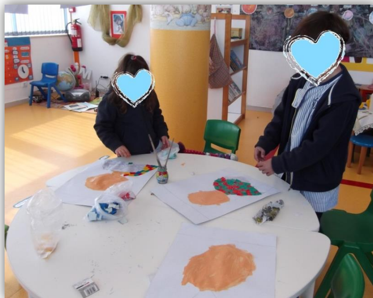
Figura 4.2- Crianças C6 e C7 colando os quadrados para construir a camisola

No decorrer da atividade observámos também que o processo de escolha de cores dos quadrados para formarem a camisola foi muito diversificado, pois a partir dos trabalhos das crianças observámos que nove destas utilizaram três cores, seis utilizaram quatro cores e apenas três utilizaram duas cores para completar o retrato. Reparámos ainda que houve a preocupação em produzir trabalhos diferentes por parte das crianças, pois cada uma fez os trabalhos segundo as suas preferências. Nesta fase foi importante ouvirmos o que as crianças nos tinham para contar, para completar o que observámos, como foram os casos das crianças C4, C7 e C2, tal como registámos na grelha de observação direta (apêndice IX):