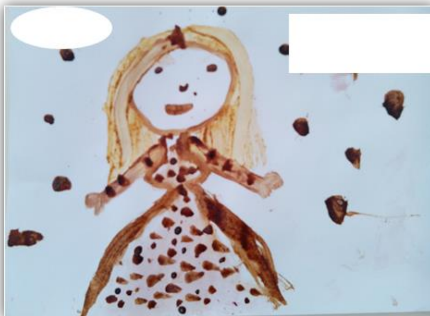
Figura 4.11- "Uma menina e neve" desenha pela criança C10

Nestas crianças notámos que o trabalho foi feito de acordo com os seus gostos, ao contrário dos restantes, que falámos anteriormente, que se basearam naquilo que fazem no dia-a-dia, já que são crianças que estão habituadas a fazer estes registos nos seus trabalhos livres. O facto de as crianças não mostrarem trabalhos diferentes tornou a nossa tarefa mais difícil, pois com base nos objetivos, estávamos à espera que um maior número de crianças, fosse mais imaginativo e que desenvolvesse algo diferente, fora do contexto de dia-a-dia. Apesar de tudo, destacamos que cada criança, com mais ou menos criatividade, à sua maneira, acabou por fazer um trabalho diferente e inovador.