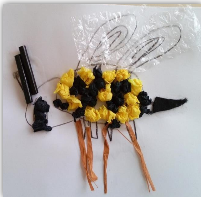
Figura 4.17- Abelha da criança C3 com o ferrão feito de feltro

Por último, mas não menos importante, observámos que houve uma grande parte do grupo que não desenhou o ferrão da abelha. Apesar disso, verificámos que entre as restantes crianças houve uma grande variedade na utilização de materiais, o que permitiu que existisse um maior desenvolvimento da criatividade. Neste caso, observámos que as crianças utilizaram diversos materiais como o feltro (figura 4.17), a cartolina, o papel de seda, a tinta com cotonete e até os lápis de cor para pintar.