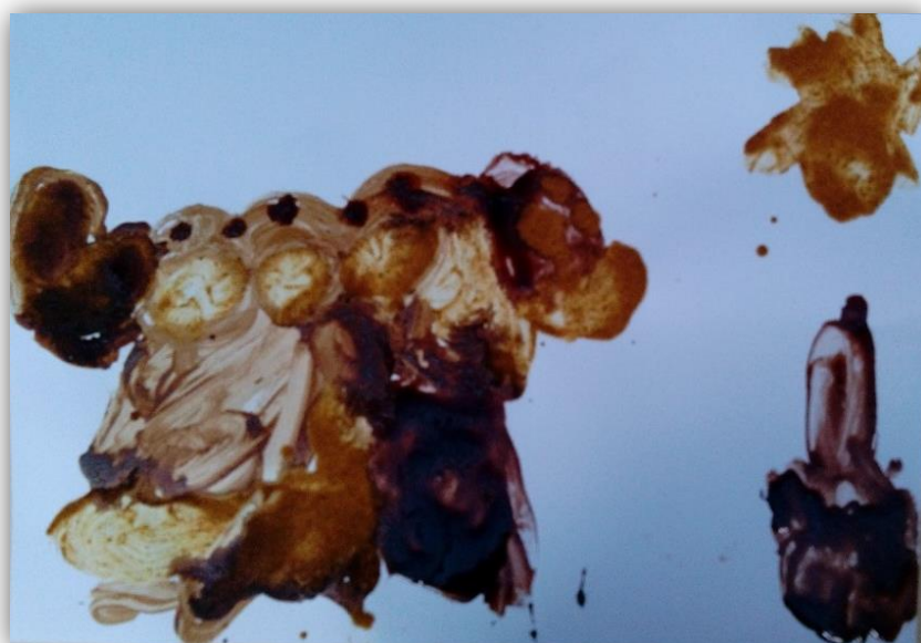
Figura 4.8- “Cão” desenhado pela criança C2

Por outro lado, a criança (C4) optou por desenhar, tal como nos disse: “(...) um comboio com nuvens e um menino a andar de comboio (...) ” (figura 4.9). Esta era uma das crianças que quando tinha trabalhos de expressão plástica para fazer, tentava acabá-los o mais rapidamente possível, sem se preocupar com o que realmente fazia. Pensamos que devido a ter acesso a materiais diferentes para essa atividade, a criança (C4) tenha tido uma preocupação acrescida em criar algo diferente e que estivesse mais próximo das suas preferências pessoais.