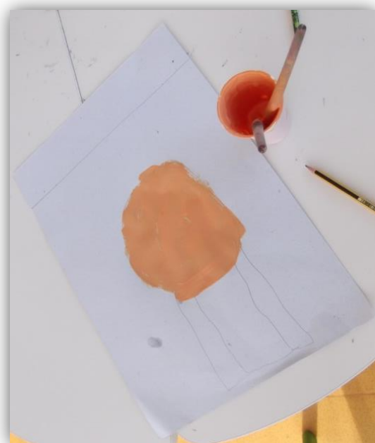
Figura 4.1- Rosto do pai pintado pela criança C4

É de referir que nesta atividade foi mais fácil dividi-la por etapas. Decidimos fazer desta forma porque permitia-nos ter uma melhor organização da atividade e do grupo em si.