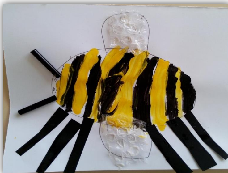
Figura 4.15- Abelha da criança C7 com as asas feitas de plástico bolha

No que se refere as asas, ao contrário das patas, não houve nenhuma criança que se tivesse esquecido de as desenhar. Observámos que as crianças optaram por escolher os materiais transparentes que se encontravam na mesa para completar esta parte da abelha, pois sabiam que as asas eram transparentes, através da morfologia anteriormente descrita. Neste caso, a maioria das crianças optou por utilizar o plástico bolha, onde desenhavam e posteriormente recortavam a forma das asas para colar no registo (figura 4.15). Algumas crianças optaram por utilizar a mica, mas nesta houve uma maior dificuldade, pois o material era difícil de manusear e recortar. Houve ainda um número significativo de crianças a pintar e a desenhar as asas com as cores que mais gostavam.