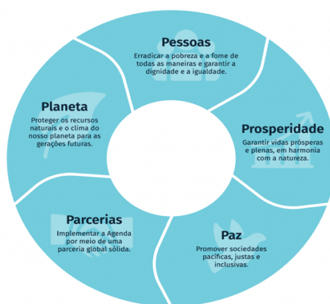
Figura 2. 5 P's da Agenda 2030

Os ODS abrangem diversas áreas, projetando um futuro sustentável ao abordar desafios como a ação climática, erradicação da pobreza e fome, redução da desigualdade social, promoção da paz e justiça e crescimento económico. Deste modo, ODS podem ser divididos em 4 dimensões distintas: Social (ODS 1-6), Económica (ODS 7-11), Ambiental (ODS 12-15) e Institucional (ODS 16-17), a que estão inerentes 5 princípios fundamentais, os 5 P's: Pessoas, Planeta, Prosperidade, Paz e Parcerias (conforme figura 2), integrados e inseparáveis dos 17 ODS.