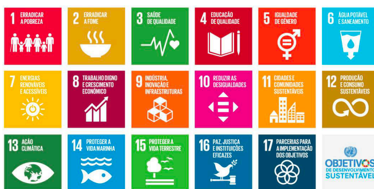
Figura 1. Objetivos de desenvolvimento sustentável