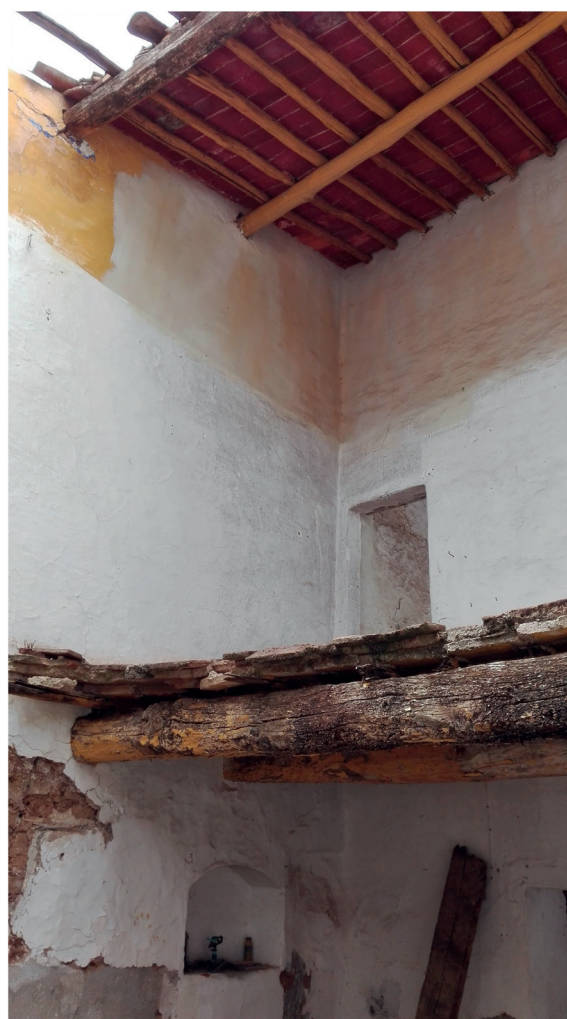
Fig. 5 Estruturas de piso e cobertura em madeira e ladrilho

A Rua Direita tem uma largura variável entre 3,75 e 4,20 metros ao longo dos seus 265 metros de comprimento. As paralelas ruas do Peixeiro e do Arco variam em largura entre os 3,15 e 3,50 metros e as restantes ruas entre 3 e 4 metros. As parcelas, tal como sucedia no Castelo, apresentam uma profundidade aproximadamente constante, entre os 13,50 e os 17 metros, a maioria com quintais a tardo. A largura das parcelas é muito variável, entre um máximo de 13 metros e um mínimo de 3,50 metros, embora seja notória uma prevalência de casas de frente estreita, sendo mais frequentes as parcelas inferiores a 6 metros.