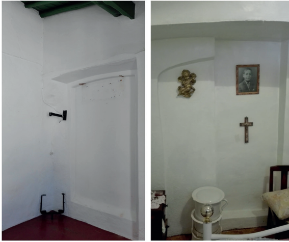
Fig. 6 Vãos em paredes meãs, agora fechados

Nas fontes documentais encontram-se medidas de casas para o ano de 1515 na descrição das habitações do Tombo dos Bens da Confraria de Nossa Senhora dos Mártires (Rosado et al. , 2017, p. 288). São descritas variações de implantação de casas construídas, com medidas oscilando, em Santiago, entre os 3,25 e os 6,60 metros de largura por 8,30 a 14,30 de comprimento. Também se encontram medições realizadas pelo exterior das habitações, como no caso de quatro habitações na Rua do Arco em 1516 (IANTT, CC, livro 4, fl.144) com larguras de 3, 6 e 9 varas por 11 a 13 de comprimento (3,30, 6,60 e 9,90 metros por 12,10 e 14,30 metros). Repete-se então a medida de 6,60 por 14,30 metros como um lote recorrente, e é de notar que 3,30 e 9,90 são submúltiplos e múltiplos de 6,60, respetivamente. Levanta-se a hipótese da parcela original de loteamento do bairro corresponder a 6,60 por 14,30 metros (6 por 13 varas), sendo depois dividida ou aglutinada conforme a necessidade dos moradores.