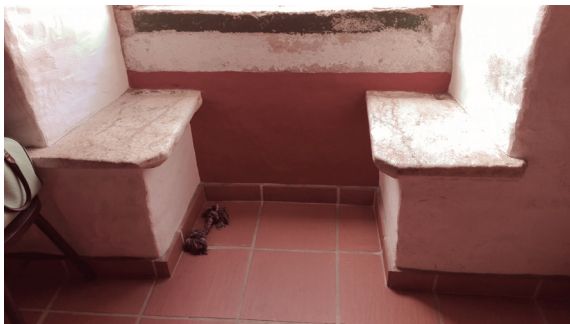
Fig. 3 Conversadeira em mármore, Rua da Cadeia 11

centralidade para o Rossio, praça de Armas, espaço gerador do polígono radial das muralhas (Teixeira & Valla, 1999, p. 158), e à instalação de outros equipamentos na cidade baixa, como ou o Hospital Real de São João de Deus em 1669. Até ao fim do século XVII ainda se mantêm vastos vazios urbanos dentro do recinto amuralhado, que se vão densificar durante o século XVIII (Teixeira & Valla, 1999, p. 158).