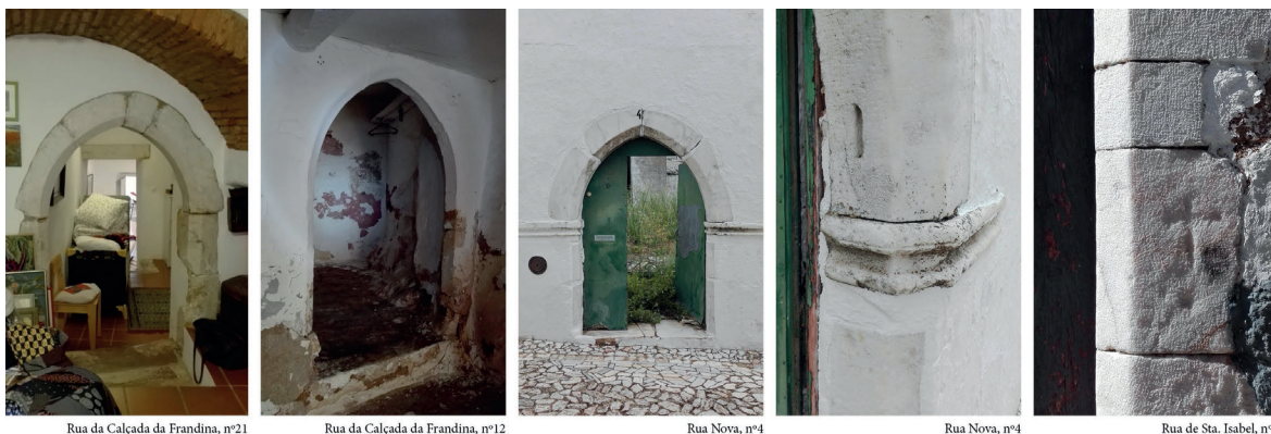
Fig. 4 Arcos ogivais em mármore e tijolo. Marcas em cantarias exteriores

construção do pavimento do piso elevado são assentes ladrilhos cerâmicos sobre os barrotes (fig. 5), técnica frequentemente repetida para construção dos telhados, com as telhas apoiadas sobre ladrilhos. As coberturas são quase sempre de duas águas com a cumeeira paralela à fachada principal. As casas são invariavelmente caiadas. Os compartimentos interiores são adossados, sem que uma única lógica de distribuição prevaleça no conjunto. São visíveis com frequência fenómenos de aglutinação de compartimentos vizinhos de diferentes parcelas através da abertura de vãos em paredes meãs (fig. 6).