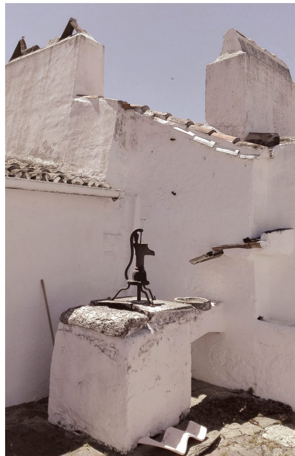
Fig. 7 Entrada de cisterna sob açoteira

Os núcleos alcandorados estão hoje numa posição de periferia e segregação em relação à cidade, e enfrentam o estigma de pobreza e exclusão, extensível às próprias casas tradicionais. Dentro da cidade são entendidos como áreas de difícil acesso e mobilidade, infraestruturas antigas e pouco comércio e serviços. A degradação física e