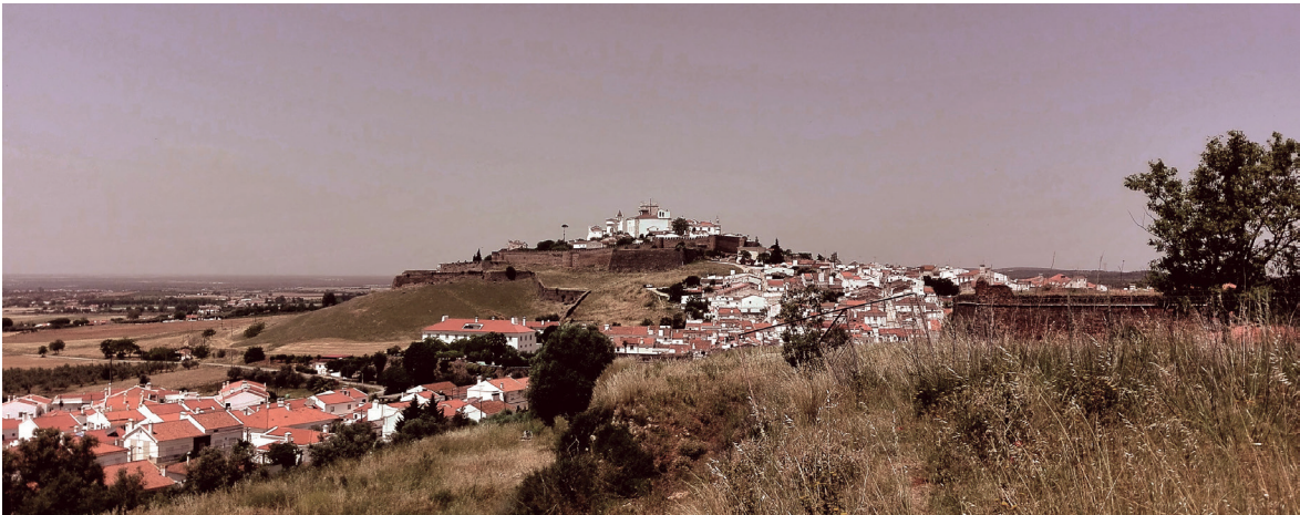
Fig. 2 Vista do Castelo desde Este com bairro dos Currais na encosta

Viçosa – para potenciar o crescimento da urbe estremocense ao longo do século XIII. A ocupação consolida-se progressivamente durante a primeira metade de trezentos, e mesmo as ordens mendicantes, dependentes da existência de núcleos populacionais, buscam instalar-se nesta área em crescimento. Na planície circundante, entre datas apontadas tão díspares como 1239 e 1277 (Costa, 1961, p. 15; Espanca, 1974, p. 1; Costa, 1997, p. 1), funda-se o convento de S. Francisco. Uma das razões para a posição periférica do Convento em relação ao núcleo fortificado da vila pode ser encontrada na natureza do local: o Convento implanta-se entre as duas nascentes de água, num ponto para onde se vai expandir a urbe num futuro próximo à fundação (fig. 1).