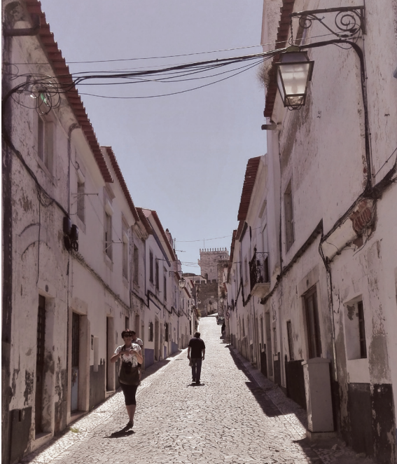
Fig. 8 Rua Direita de Santiago com Castelo ao fundo

social destes bairros aumenta numa espiral descendente: as casas tradicionais sem conservação oferecem condições de habitabilidade abaixo dos padrões atuais de conforto e ficam tendencialmente inabitadas por períodos longos, degradando-se mais depressa e, então, cada vez menos propensas a atrair novos residentes. Também os bairros, cada vez com menos habitantes, vão recebendo menos serviços e manutenção urbana, aumentando ainda mais a tendência de perda de residentes. Uma população diminuta e tendencialmente envelhecida tem menos participação cívica e pouca influência nas decisões concelhias que poderiam ajudar a recuperação destas áreas.