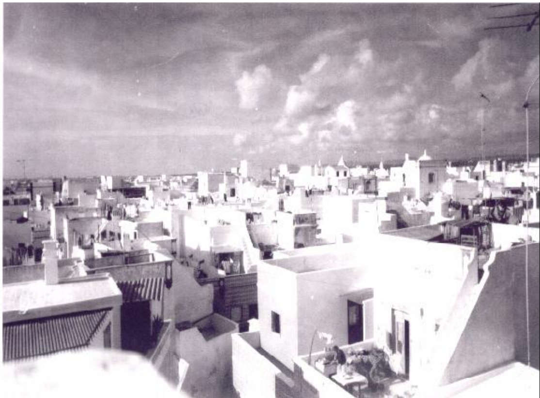
Figs.4 e 5 – Fotos antigas do panorama típico das açoteias olhanenses.