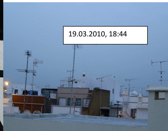
Vistas 'panorâmicas' das traseiras do 3º Esq. do nº3 da Rua da Liberdade