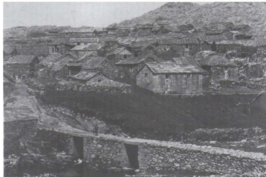
Fig.4 Albergaria da Serra, 1920 (Filomeno Silva, "Arouca d'ontem", p.137)

Um dos temas mais recorrentemente associados à transformação dos povoados de montanha do norte do país corresponde à casa do emigrante, construída, em especial, a partir das décadas de setenta e oitenta do século passado. Entre os lugares das cumeadas da Freita e da Arada onde a presença da casa do emigrante é particularmente expressiva, poderíamos distinguir a aldeia de Albergaria da Serra que, na primeira metade do século passado, se restringia a um núcleo de edificações indiferenciadas de alvenaria de granito encimadas por coberturas de duas ou mais águas de lousa ou colmo fixo por varedos em tesoura (fig. 4).