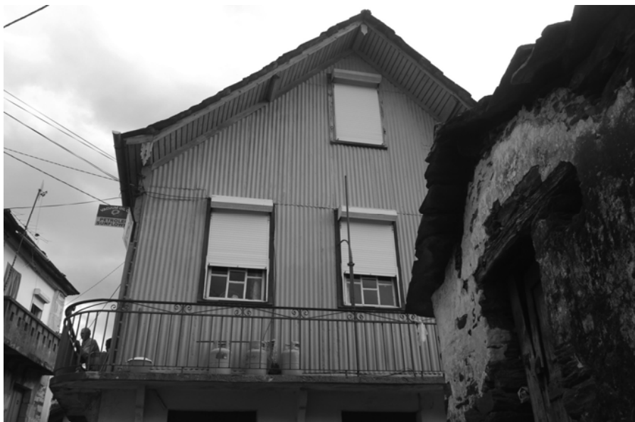
Fig.3 Parada de Ester (mrc)

Esta arquitetura do tabique junta vários temas, como a presença da cor, a diversidade formal da cobertura, o recurso a pendentes acentuadas nos telhados com aproveitamento do desvão, a integração frequente de trapeiras ou a presença dos beirados alpendrados em madeira com lambrequins, que poderão aparecer combinados num processo de miscigenação com a arquitetura preexistente (da alvenaria de pedra e das lousas que se mantêm na cobertura), adquirindo uma expressão que, ainda que de forma modesta, remete para alguns dos temas da arquitetura dos chalets e do Romantismo. A presença generalizada do tabique adquirirá simultaneamente uma dimensão urbanística , na medida em que corresponde a um quadro mais diverso de soluções na relação do edifício com o espaço público, conformada por corpos balançados, varandas, passadiços e cobertos que chegarão a atravessar a rua dum lado ao outro.