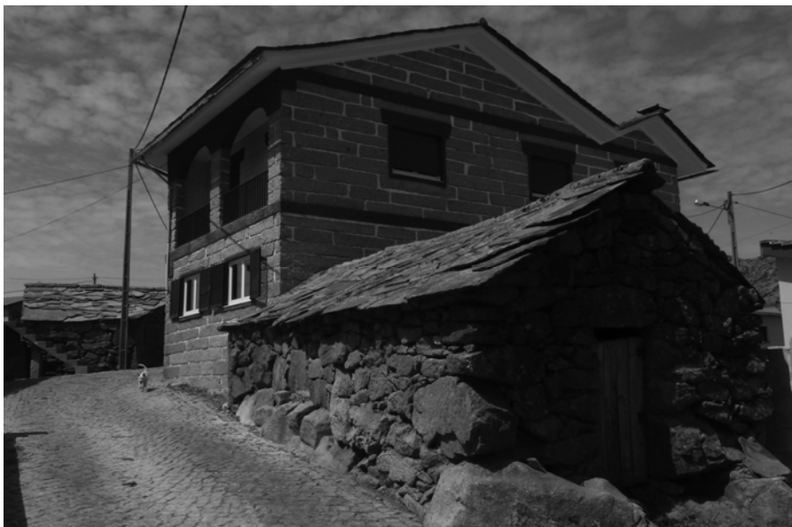
Fig. 5 Albergaria da Serra, 2010 (mrc)

Para lá das diferentes perspetivas que se tenderão a opor entre as apreciações negativas ou de defesa desta arquitetura 7 , importaria no presente contexto retomar a leitura da casa do emigrante enquanto forma onde se combina o desígnio de renúncia à morfologia, escala e materialidade da arquitetura tradicional (que remetem, no entendimento dos seus proprietários, para os períodos de pobreza e miséria ) com a preservação de determinados hábitos da cultura tradicional que se procuram, apesar de tudo, conciliar com a importância conferida aos espaços de representação.