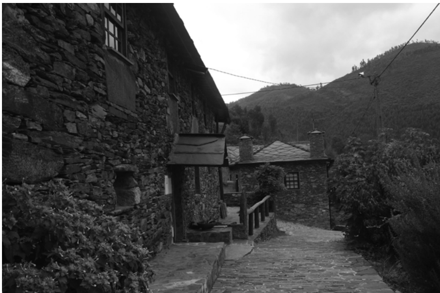
Fig. 6 Paradinha (mrc)

Em qualquer caso, este desígnio não resulta necessariamente num conhecimento efetivo da arquitetura vernacular e tenderá a coligir um conjunto de temas que tanto podem ser característicos desta região como se inscreverem numa cartilha sem território de (re)invenção das morfologias tradicionais que, nalguns casos, poderá mesmo invocar alguns tópicos da arquitetura “à antiga portuguesa”.