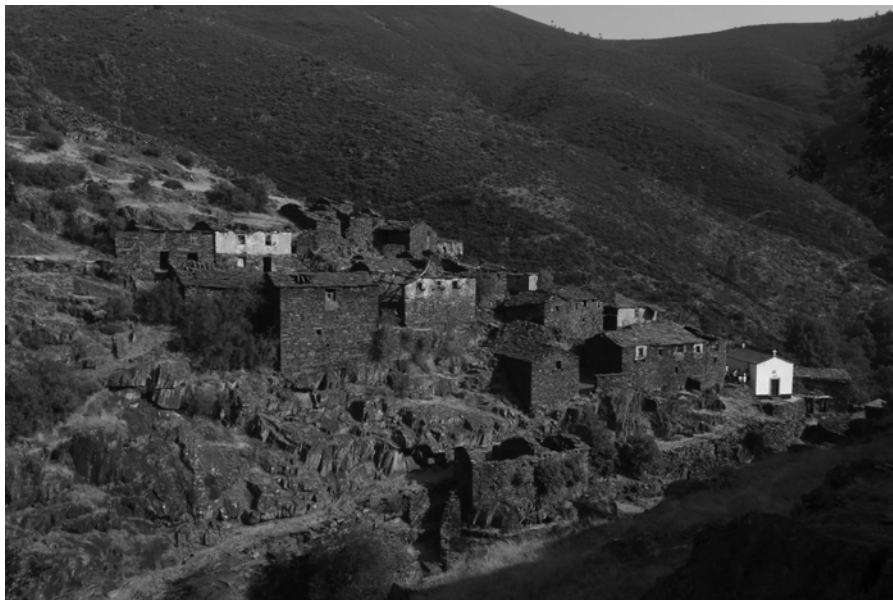
Fig. 2 Drave. Vista a partir de ponte (mrc)

Nas áreas de vertente e nas zonas ribeirinhas dos afluentes do Paiva e do Vouga, caracterizadas pela presença de bolsas de terras melhores, a casa serrana tenderá a adquirir uma maior diversidade morfológica que se acentuará, expressivamente, a partir da primeira metade do século XIX. Com muita frequência, a habitação aproximar-se-á aqui da descrição genérica da casa tradicional de dois pisos do norte do país, ainda que a escada exterior possa desaparecer com o aproveitamento da implantação em ladeira para garantir o acesso direto ao piso superior.