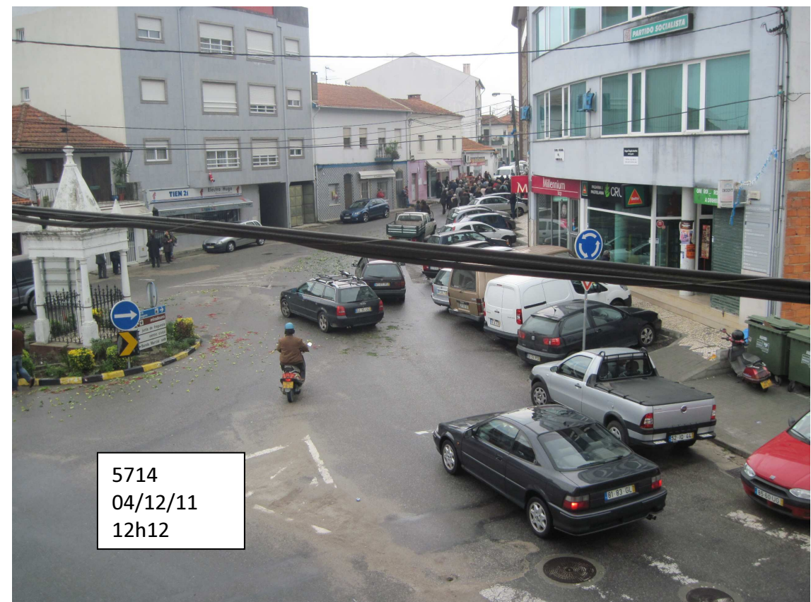
5714 04/12/11 12h12