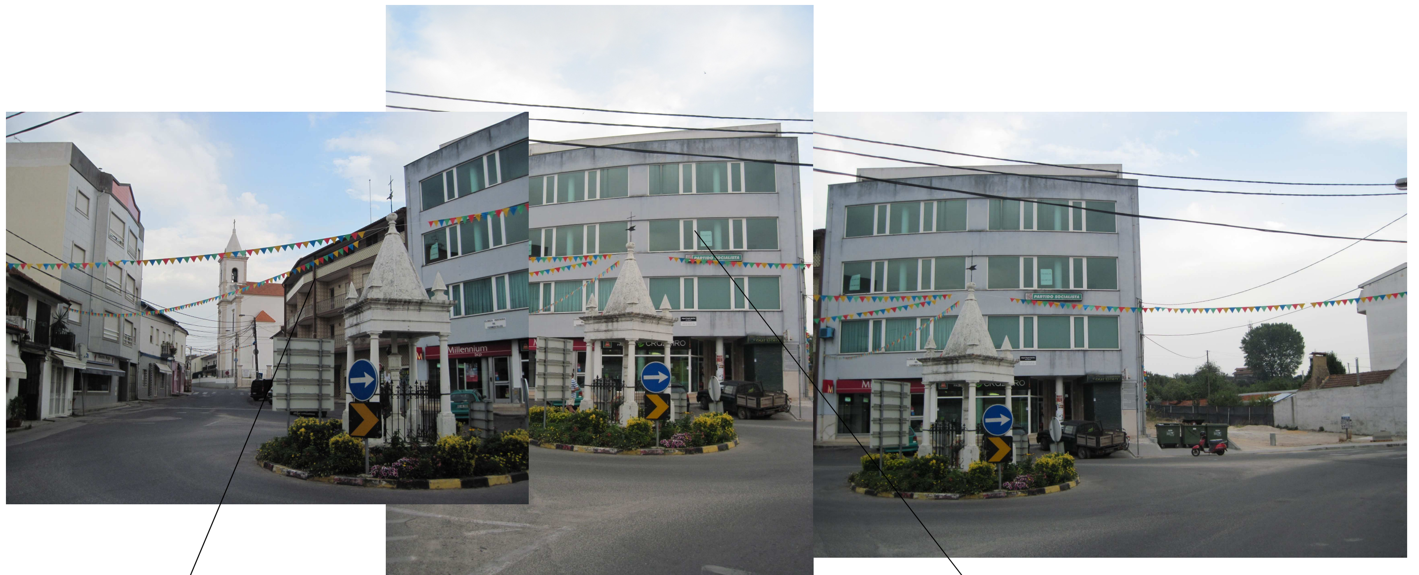
Edifício D. Augusta