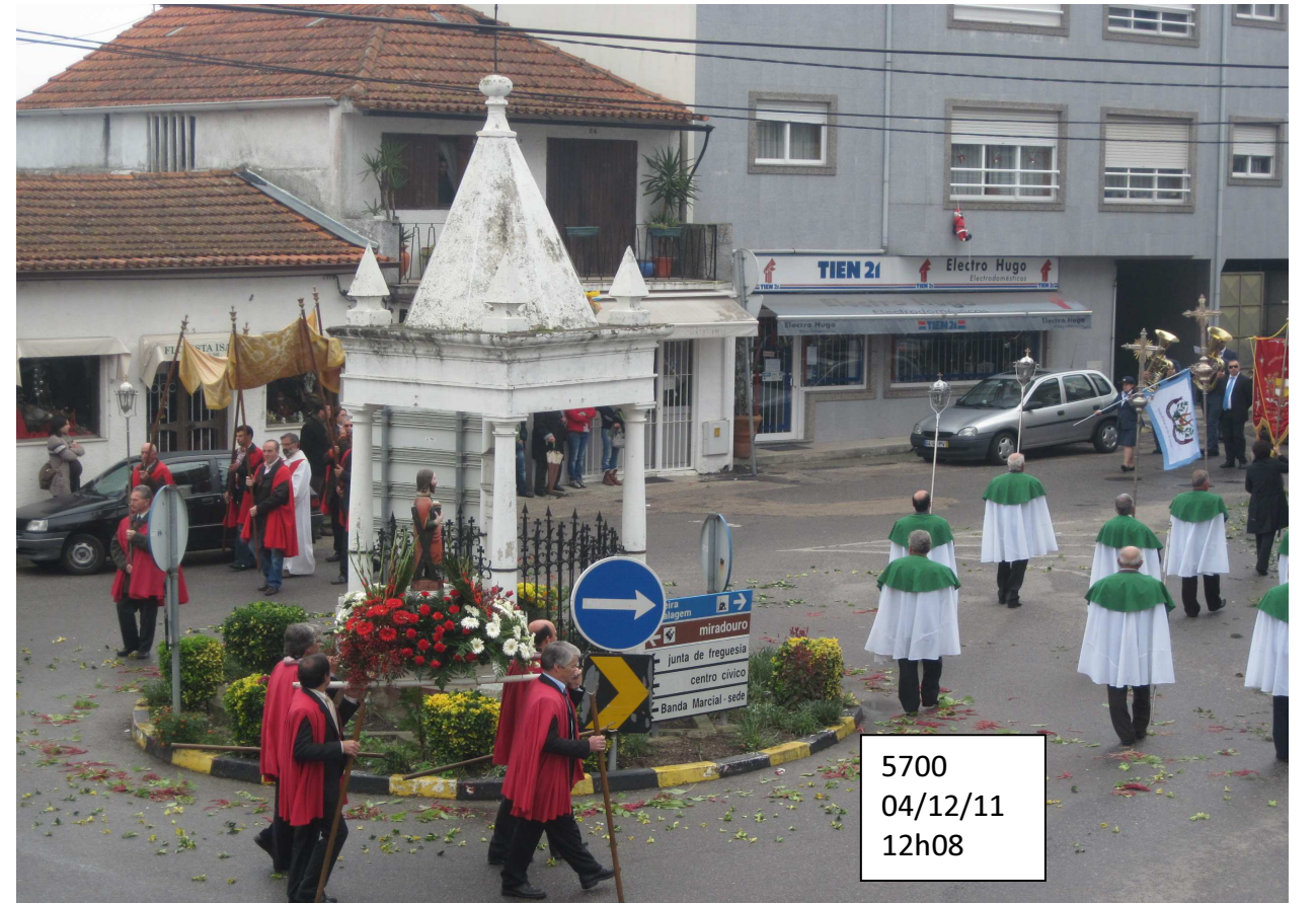
5700 04/12/11 12h08