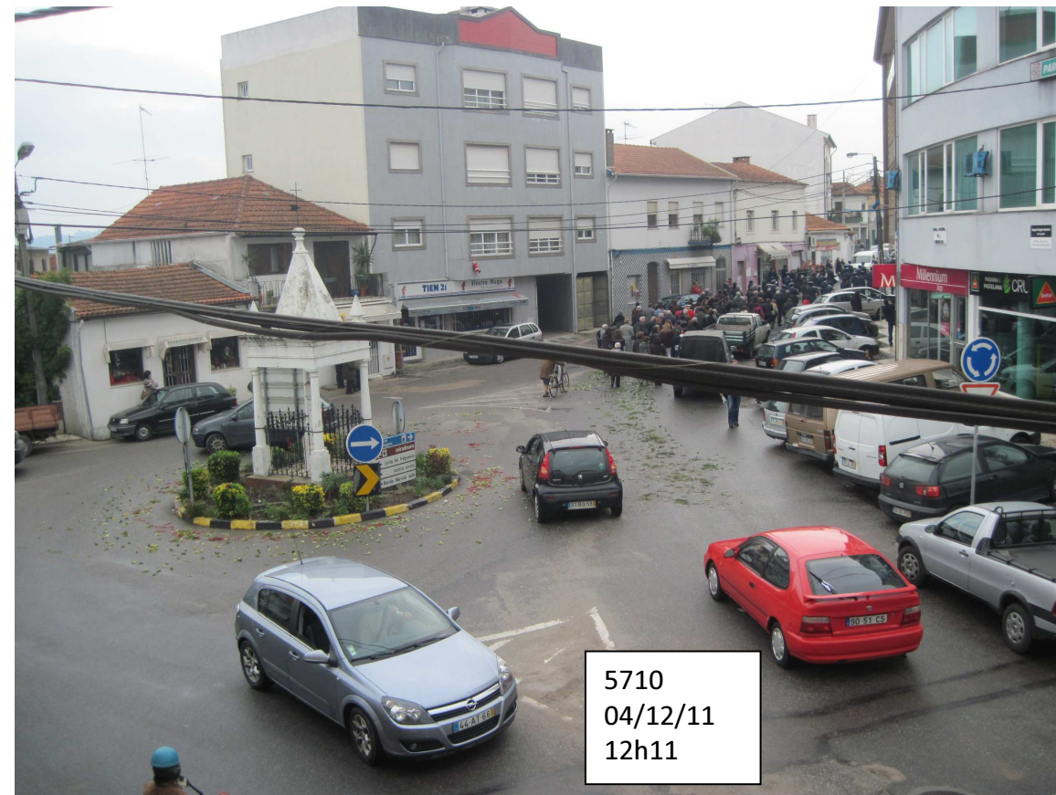
5710 04/12/11 12h11