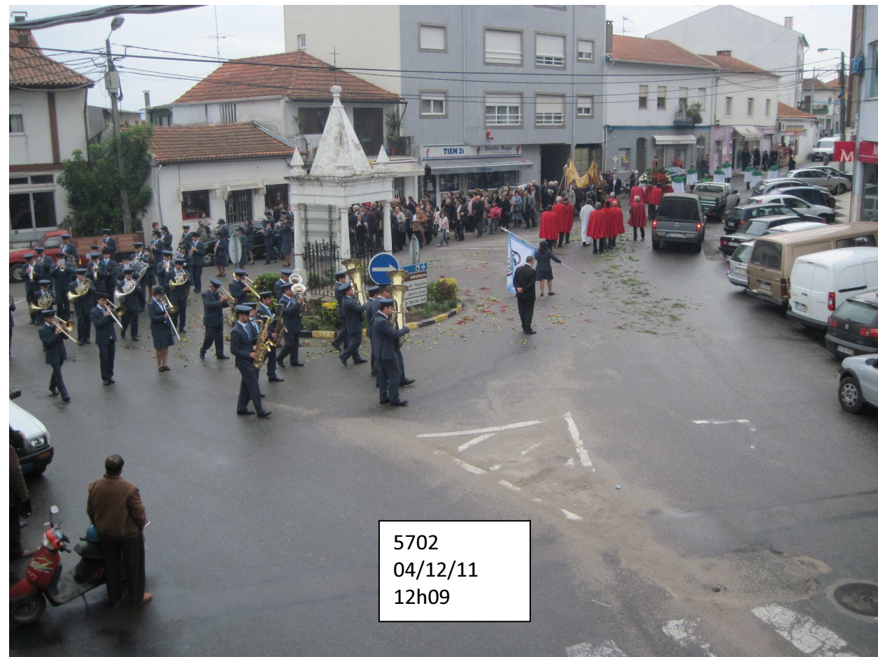
5702 04/12/11 12h09