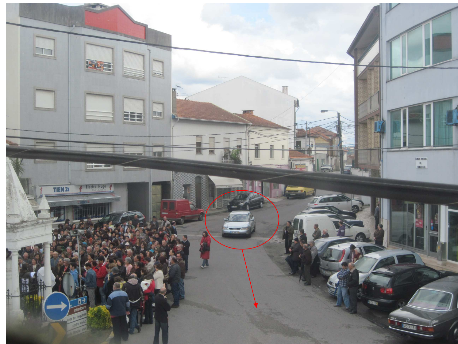
06/04/2012 - 15h13-4 - Sexta-Feira Santa – nova performance ao Cruzeiro de chancela paroquial, implicando momentânea disrupção da rotunda, qual reclamação ritual.