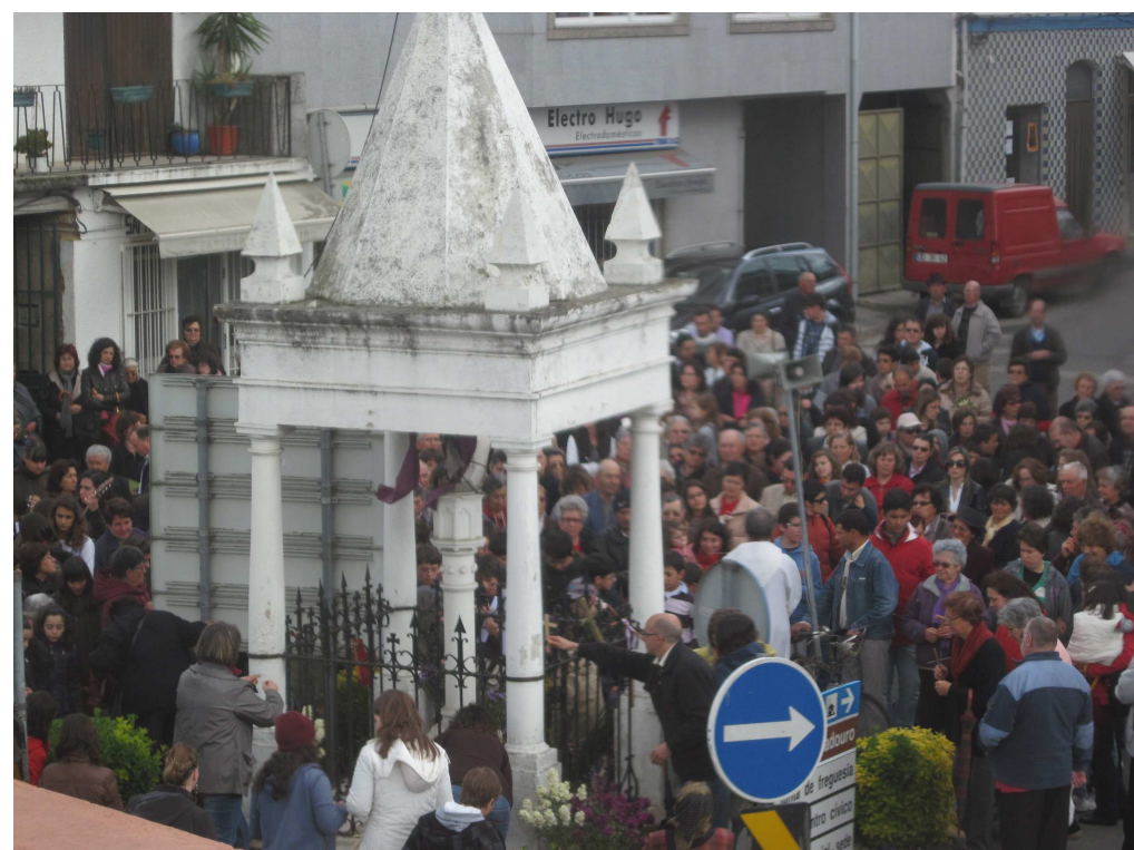
15h18-22 Cerimonial consiste na deposição de uma cruz de madeira no gradeamento do Cruzeiro; que se saiba, foi o 1º ano em que tal aconteceu.