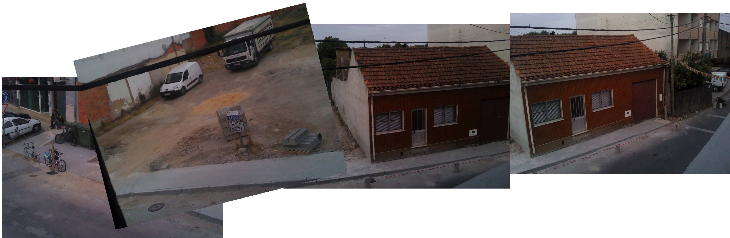
09/06/11 – 2º estágio da requalificação cimentícia do Cruzeiro pela JFF