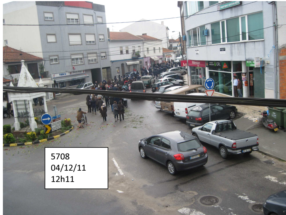
5708 04/12/11 12h11