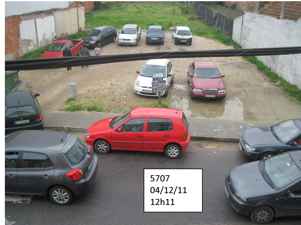
5707 04/12/11 12h11