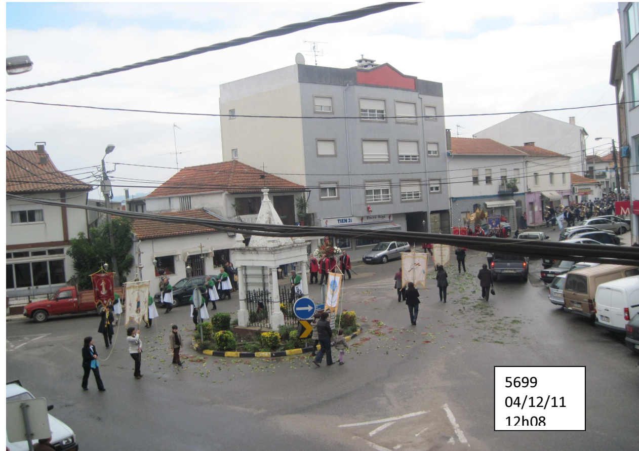
5699 04/12/11 12h08