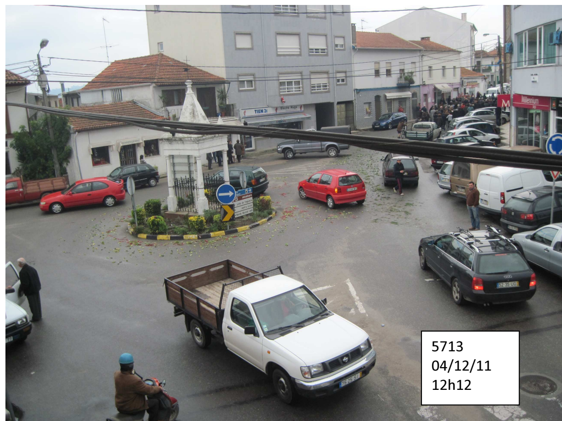
5713 04/12/11 12h12