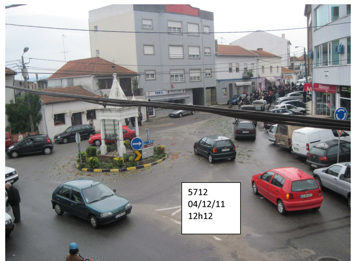
5712 04/12/11 12h12