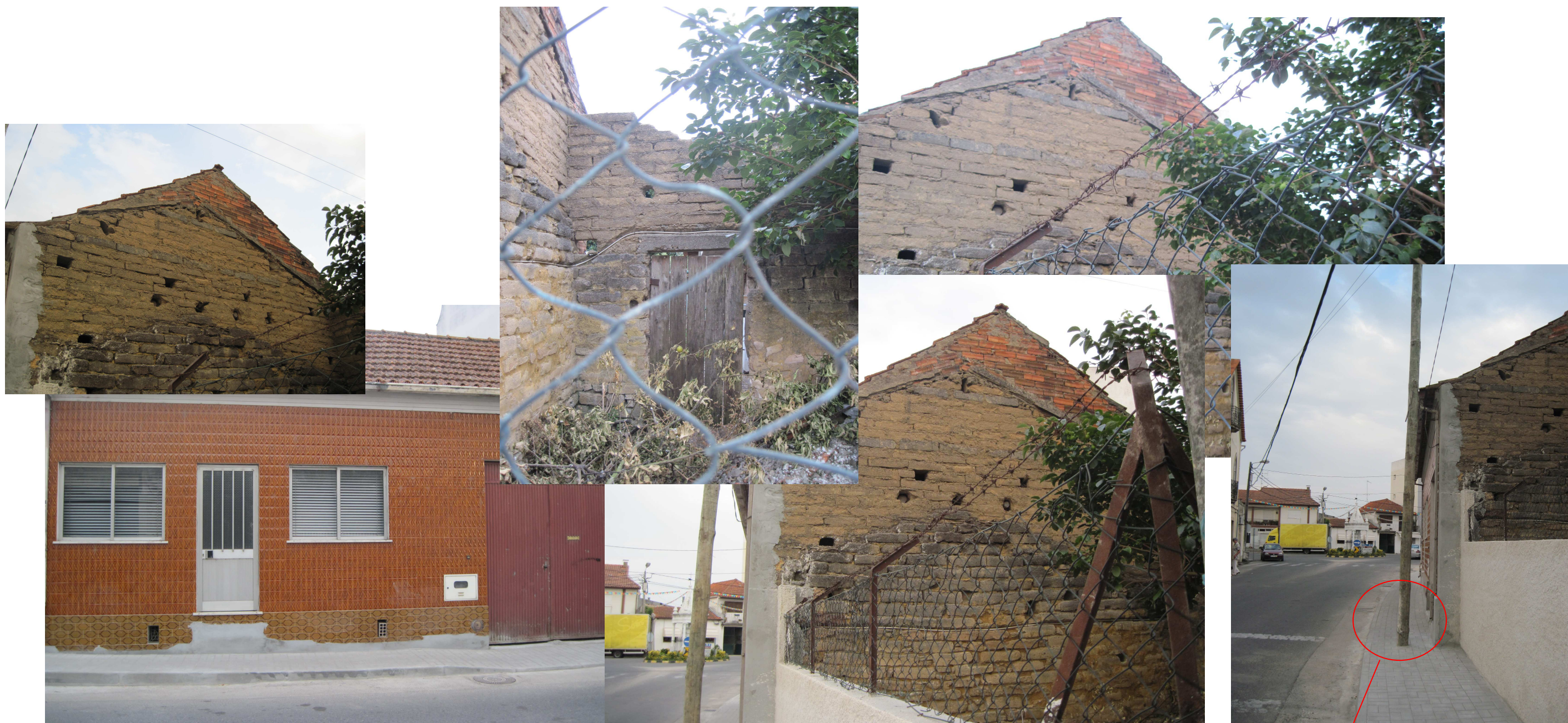
Desabitada há meia dúzia de anos, a casa da Sr a M a Luciana, confinando a Sul com a IJTN, é um bom exemplo da evolução moderna por enxertia da ATF; 15/10/11, 10h36