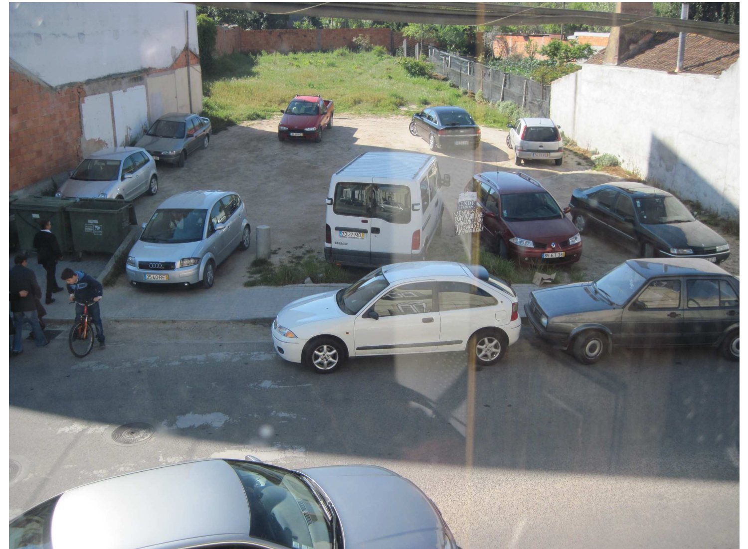
08/04/2012 - 9h56; pelo Domingo de Páscoa, levantamento das cruzes apostas na antevéspera, no Cruzeiro, pelos fiéis. Destaque para a hibridação automóvel no contexto da performance religiosa – e para o terreno escancarado evidenciando ainda outra geometria sombria.