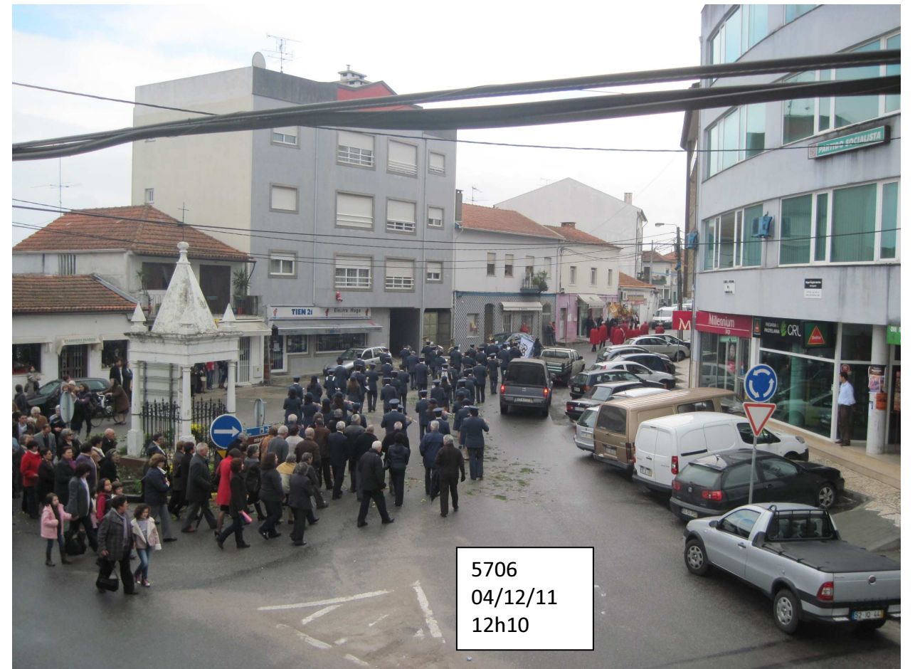
5706 04/12/11 12h10