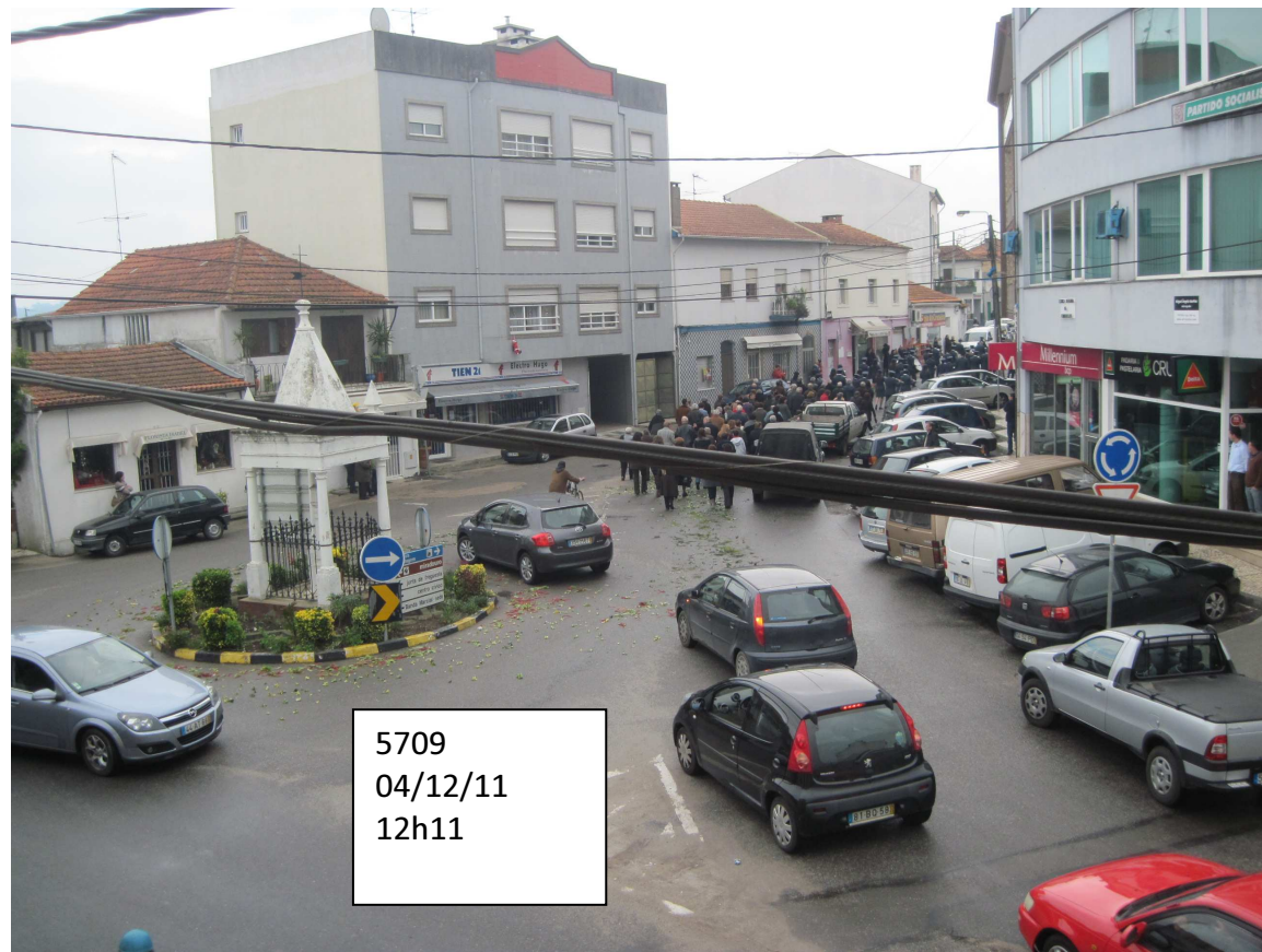
5709 04/12/11 12h11