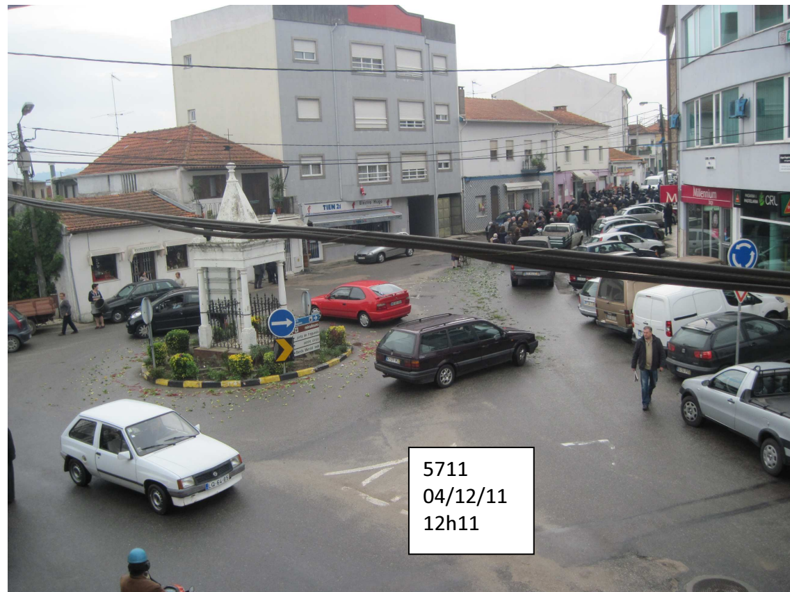
5711 04/12/11 12h11