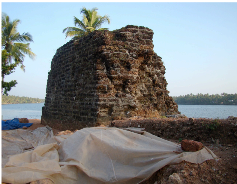
Figura 3 – Torreão da fortaleza de Cranganor.