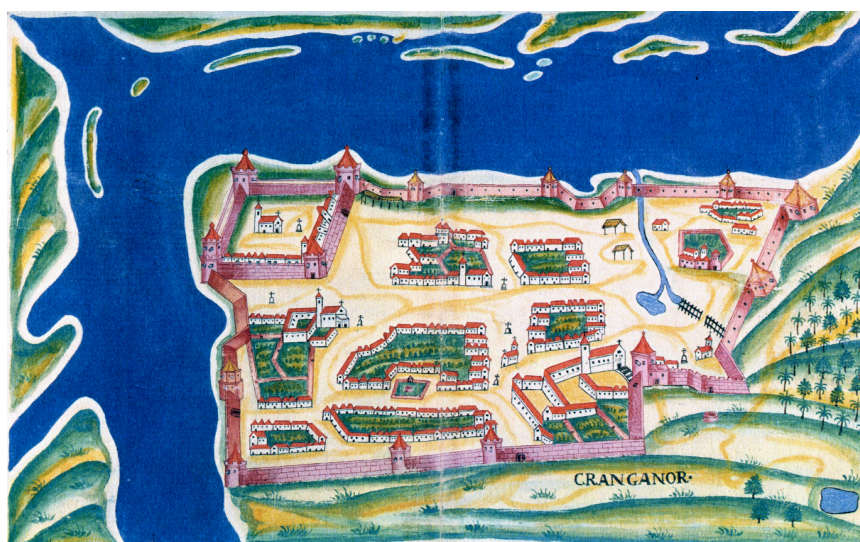
Figura 4 – “Planta da Fortaleza de Cranganor [1635]”, por Pedro Barreto de Resende, in Livro das Plantas de Todas as Fortalezas ... , Mss. Évora.