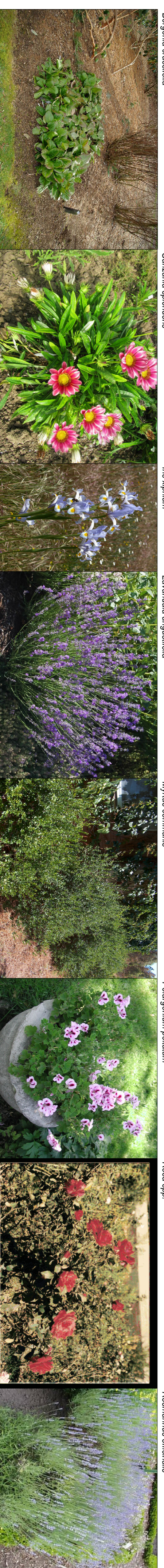
Exemplares das Espécies