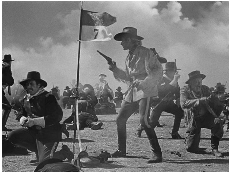
They Died with Their Boots On (1941), coleção do autor, ©Warner Home Video.

batalha de Little Big Horn, uma notória influência da tradição representativa deste episódio histórico, em particular pinturas como Custer's Last Rally (1881) de John Mulvany, Custer's Last Stand (1891) e Caught in the Circle (1892) ambas de Frederic Remington, e o popular Custer's Last Fighth (1886) de Cassily Adams, obras bastante conhecidas pois haviam sido reproduzidas em massa através de litografias.