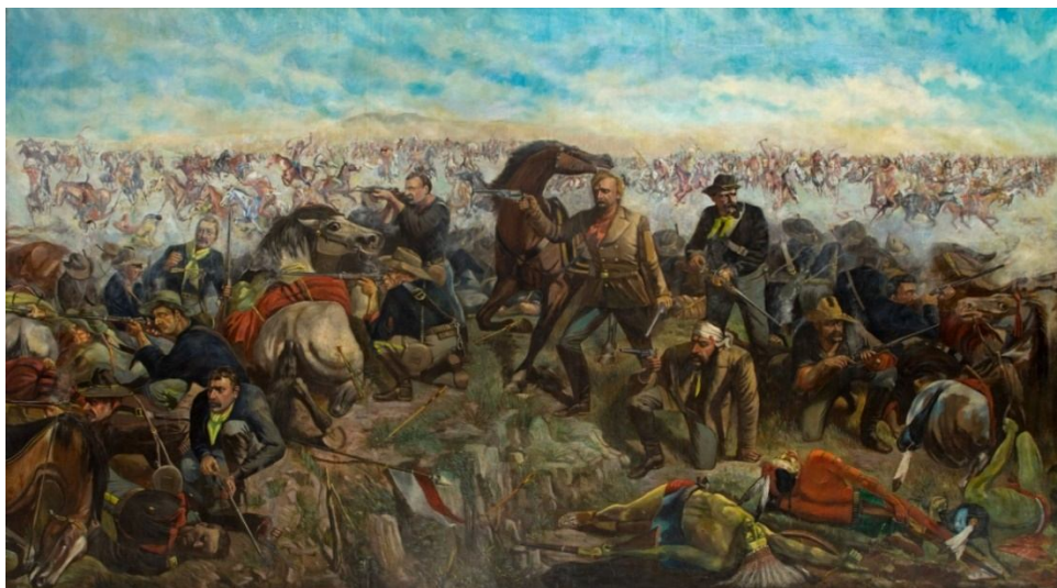
Custer's Last Rally de John Mulvany ( www.stilllifewithgirl.files.wordpress.com ).