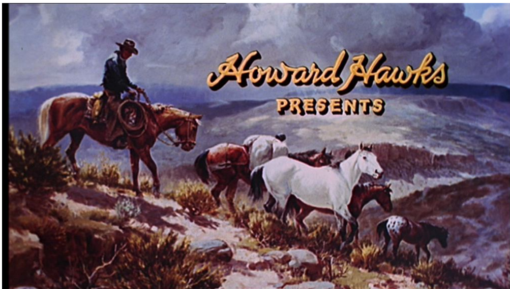
El Dorado (1966)

Keywords: Art of the American West, Hollywood western movies, John Ford, Michael Curtiz, Frederic Remington, Charles Russell.