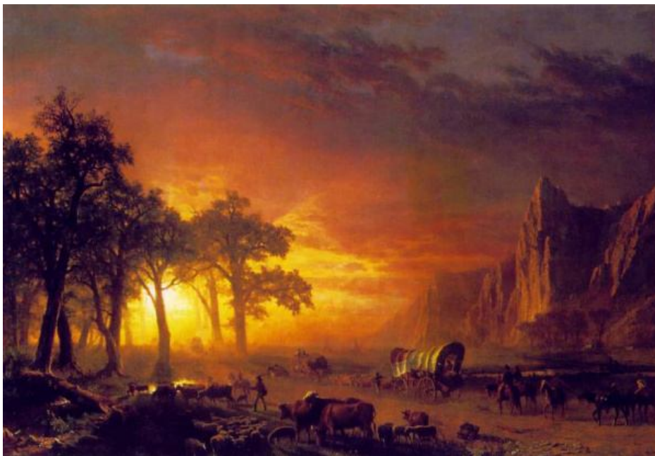
Emigrants Crossing the Plains de Albert Bierstadt.

identidade dos EUA. A busca da terra prometida transforma-se deste modo num tema central da cultura americana, expressa na obra de pintores como George Caleb Bingham e Albert Bierstadt que, em trabalhos como The Emigration of Daniel Boone (1851) e Emigrants Crossing the Plains (1867), respetivamente, imortalizaram esse enorme êxodo populacional que veio dar nova forma à nação americana. Várias décadas depois, o cinema viria também a representar esta epopeia migratória do Oeste, em filmes como The Covered Wagon (J. Cruze, 1923), The Big Trail (R. Walsh, 1930), Cimarron (W. Rugles, 1931), Wagon Train (J. Ford, 1950) e Across the Wide Missouri (W. Wellman, 1951), que beberam inspiração no trabalho dos pintores do séc. XIX.