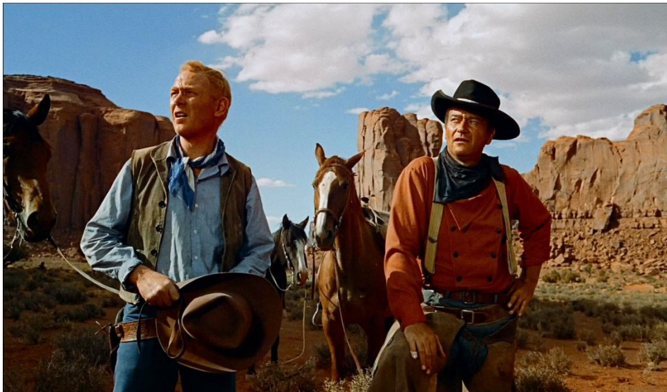
The Searchers (1956), coleção do autor

entre John Sturges e Charles B. Lang Jr., em filmes como Gunfight at Ok Corral (J. Sturges, 1957), Last Train to Gun Hill (J. Sturges, 1959) e The Magnificent Seven (J. Sturges 1960). Com efeito, Lang Jr. foi um dos mais solicitados diretores de fotografia nos westerns de Hollywood dos anos cinquenta, tendo trabalhado com Anthony Mann em The Man from Laramie (A. Mann, 1955) e Budd Boetticher em Decision at Sundown (B. Boetticher, 1957). Igualmente interessante foi o trabalho desenvolvido por Charles Lawton nos westerns de Delmer Daves: Jubal (D. Daves, 1956) e Cowboy (D. Daves, 1958), e nos clássicos de Budd Boetticher: The Tall T (B. Boetticher, 1957) e Ride Lonesome (B. Boetticher, 1959) que lhe valeram o reconhecimento do mestre Ford, com quem colaborou em Two Rode Together (J. Ford, 1961). Por fim, merece ainda destaque Lucien Ballard, especialista da série B que valorizou com o seu talento filmes como White Feather (R. Webb, 1955), The Proud Ones (R. Webb, 1956) e Buchanan Rides Alone (B. Boetticher, 1958), transitando em meados da década de 1960 para westerns de grande orçamento como Nevada Smith (H. Hathaway, 1966), True Grit (H. Hathaway, 1968) e o célebre The Wild Bunch (S. Peckinpah, 1969).