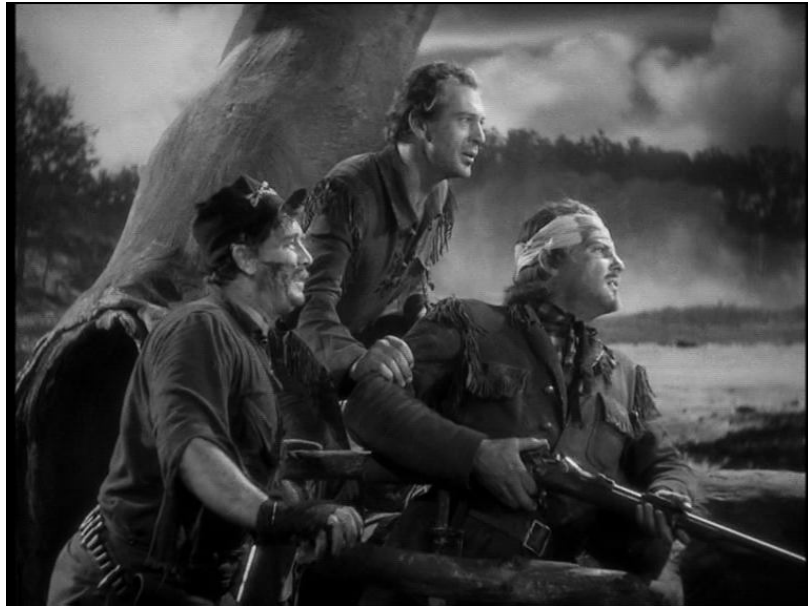
The Plainsman, coleção do autor

Tão importante como DeMille e Ford, no renascimento do western em finais dos anos trinta, foi o húngaro Michael Curtiz, que realizou três êxitos consecutivos: Dodge City (M. Curtiz 1939), Virginia City (M. Curtiz, 1940) e Santa Fé Trail (M. Curtiz, 1940). O realizador era então o mais importante house director da Warner Bros., o primeiro estúdio americano a assumir uma política anti isolacionista e a denunciar abertamente a séria ameaça que o regime nazi constituía, não apenas para os EUA, mas para os valores civilizacionais do mundo ocidental iv .