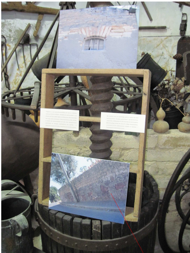
Instalação sobre molde de adobes; fotografia de cima ilustra pormenor de prédio devoluto local, exemplo da inevitável desagregação do chapisco de cimento quando aplicado sobre estruturas de terra; na fotografia de baixo, pormenor de muro híbrido vernáculo (pedra vermelha e adobe), sito na Rua da Pateira; como fundo, in situ , réplica de poço de adobe com sistema hidráulico - e artefactos diversos.