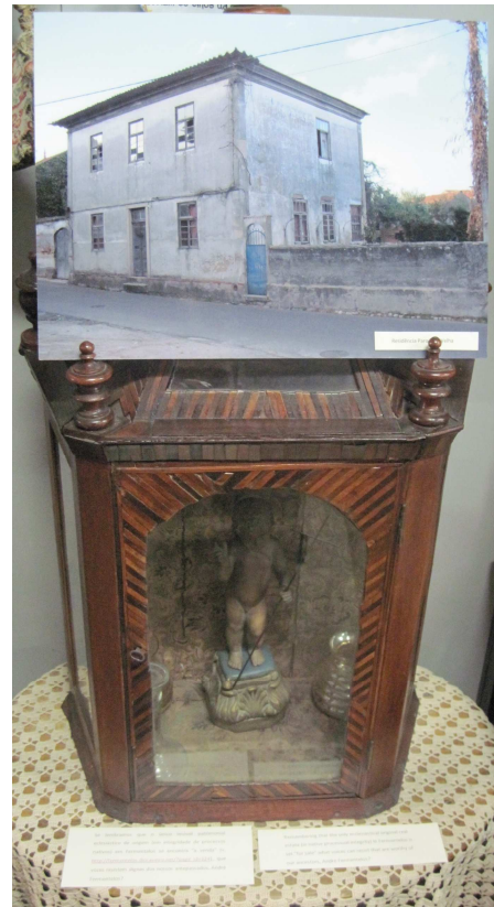
Instalação sobre oratório; fotografia da Residência Paroquial Velha, exemplo de arquitectura de terra local, devoluto e 'à venda'