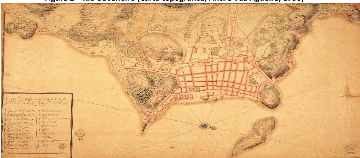
Figura 2 – Rio de Janeiro (Carta topográfica, André Vaz Figueira, 1750)