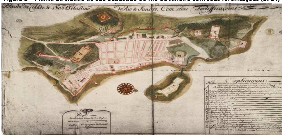
Figura 1 – Planta da cidade de São Sebastião do Rio de Janeiro com suas fortificações (1714)

14