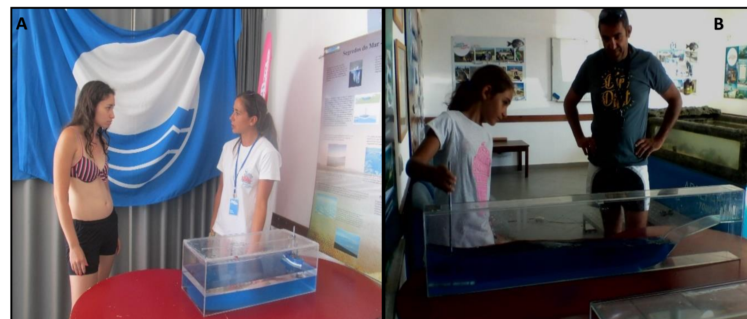
Figura 2 – A – Maquete das Ondas Internas. B – Maquete do Tsunami.