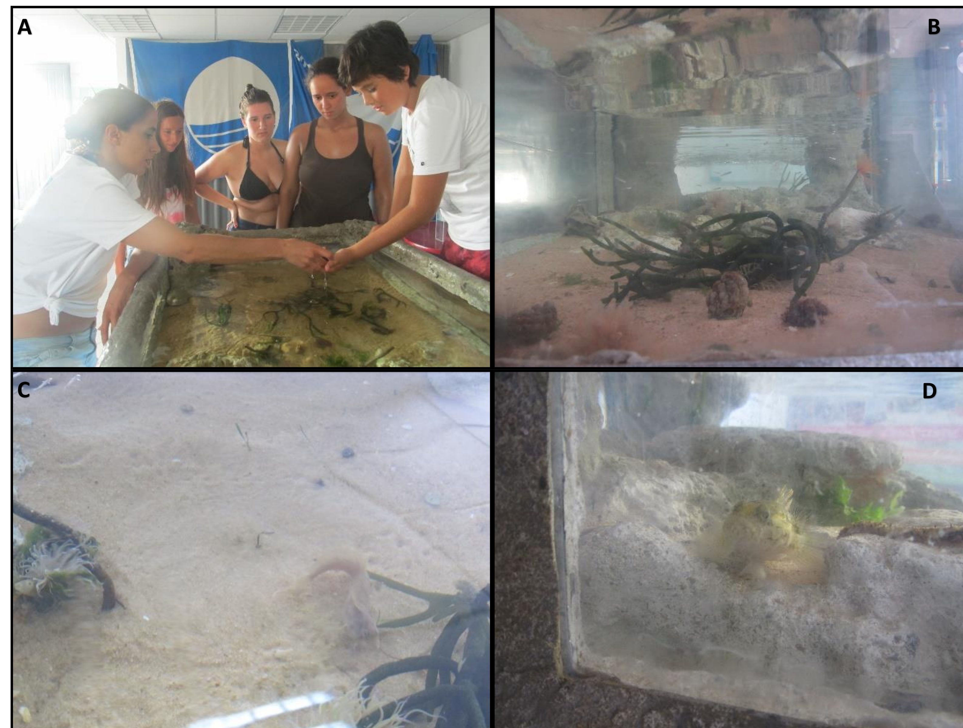
Figura 1 – Apalpário e alguns dos seus organismos. A – Visitantes a “apalpar” os organismos. B – Algas (codium) e ascídeas. C – Blénio Pavão, algas (codium) e anémonas. D – Caboz e algas (ulva).