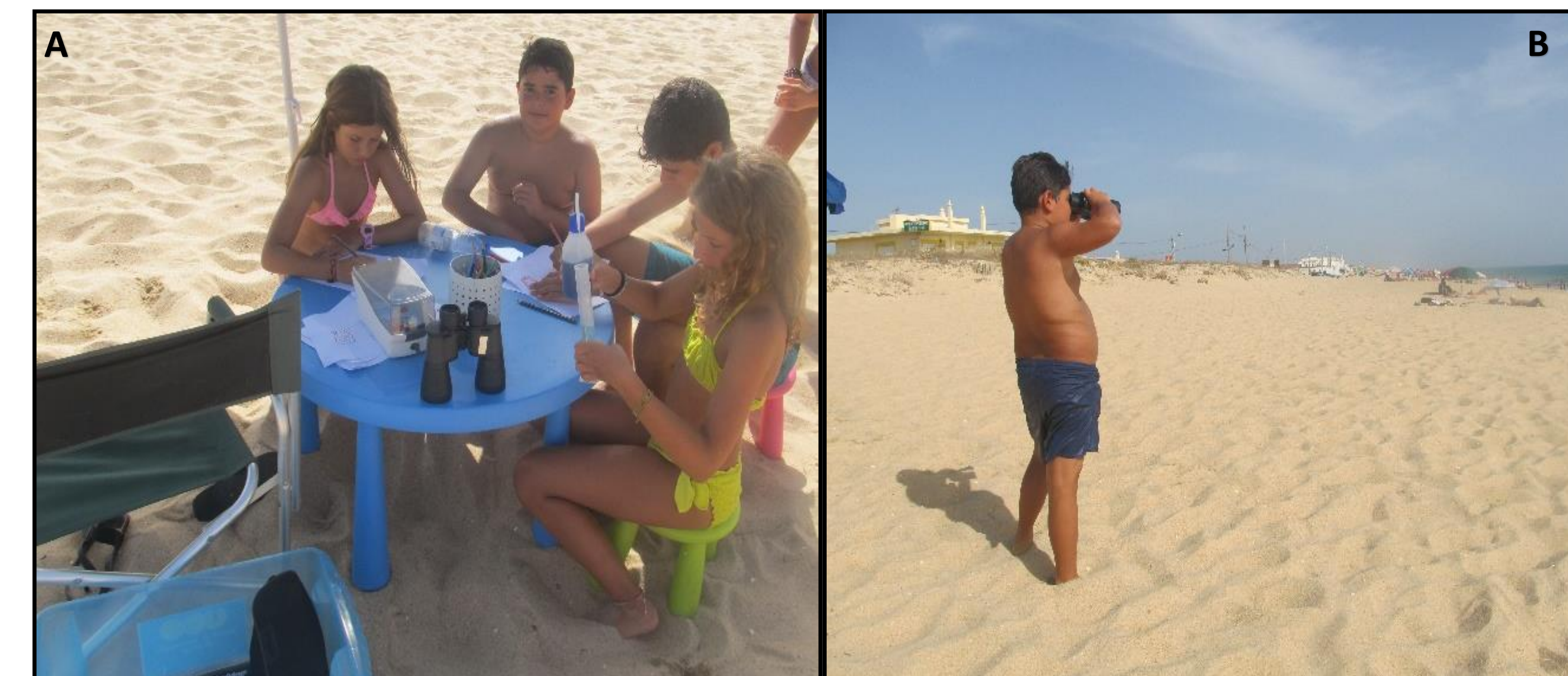
Figura 4 – A – Atividade no areal da Praia de Faro (mistura de água com diferentes densidades). B – Visitante a observar aves e/ou cetáceos.