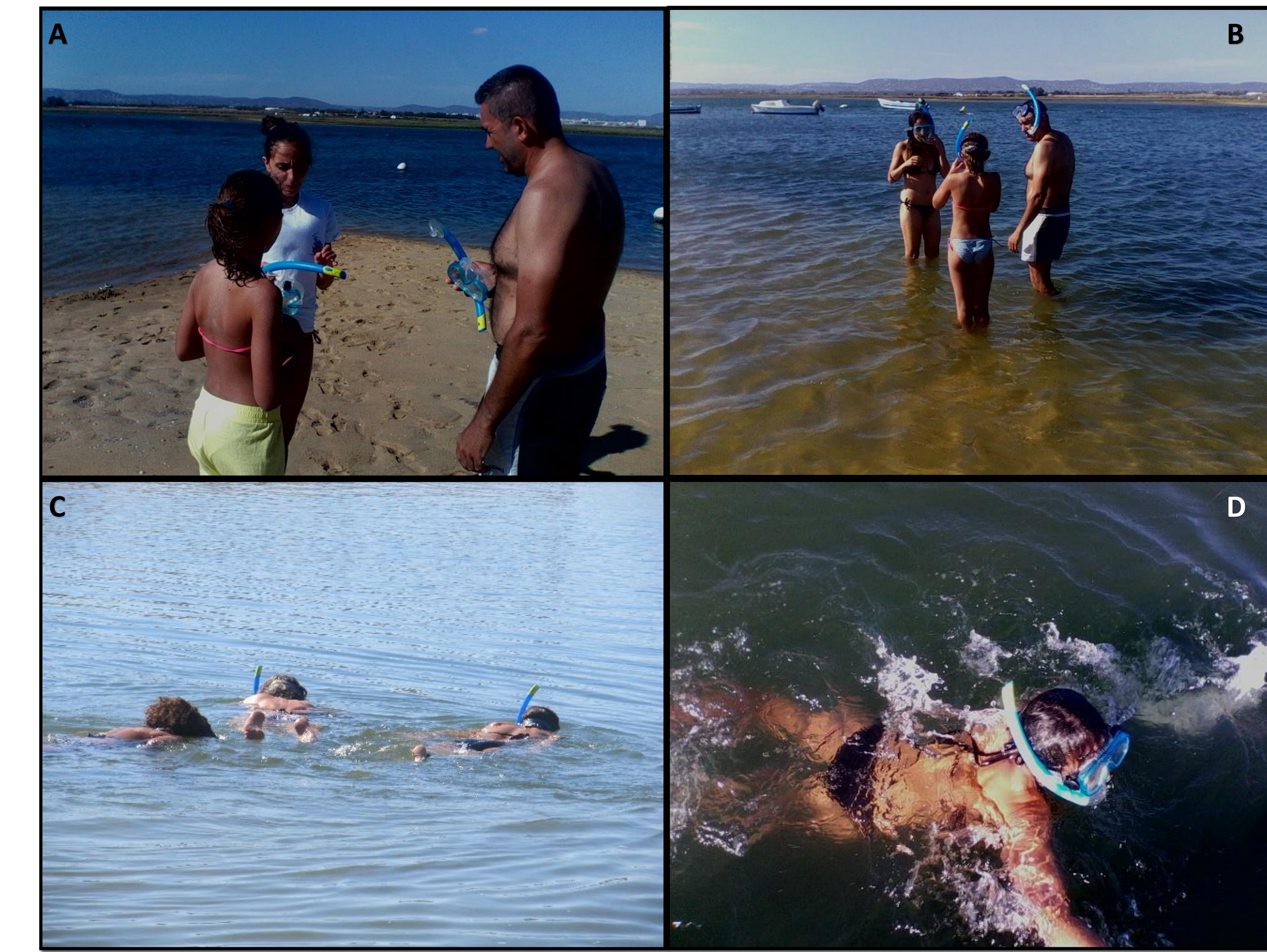
Figura 5 – A – Introdução teórica ao snorkeling. B – Preparação para entrar na água. C e D – Visitantes à descoberta dos fundos marinhos da Ria Formosa por snorkeling.