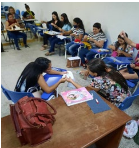
Figura 2 – Momento de produção coletiva do retalho

Ao situar essas narrativas no contexto das interações e relações com os alunos, as imagens não são apenas ferramentas visuais, mas catalisadores que enriquecem o ambiente educacional, estimulando um pensamento crítico e uma conexão emocional mais profunda com o conteúdo ensinado.