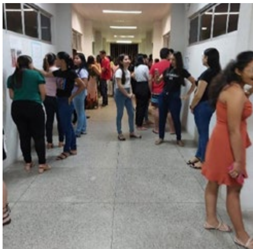
Figura 1 – A mostra artística nos corredores