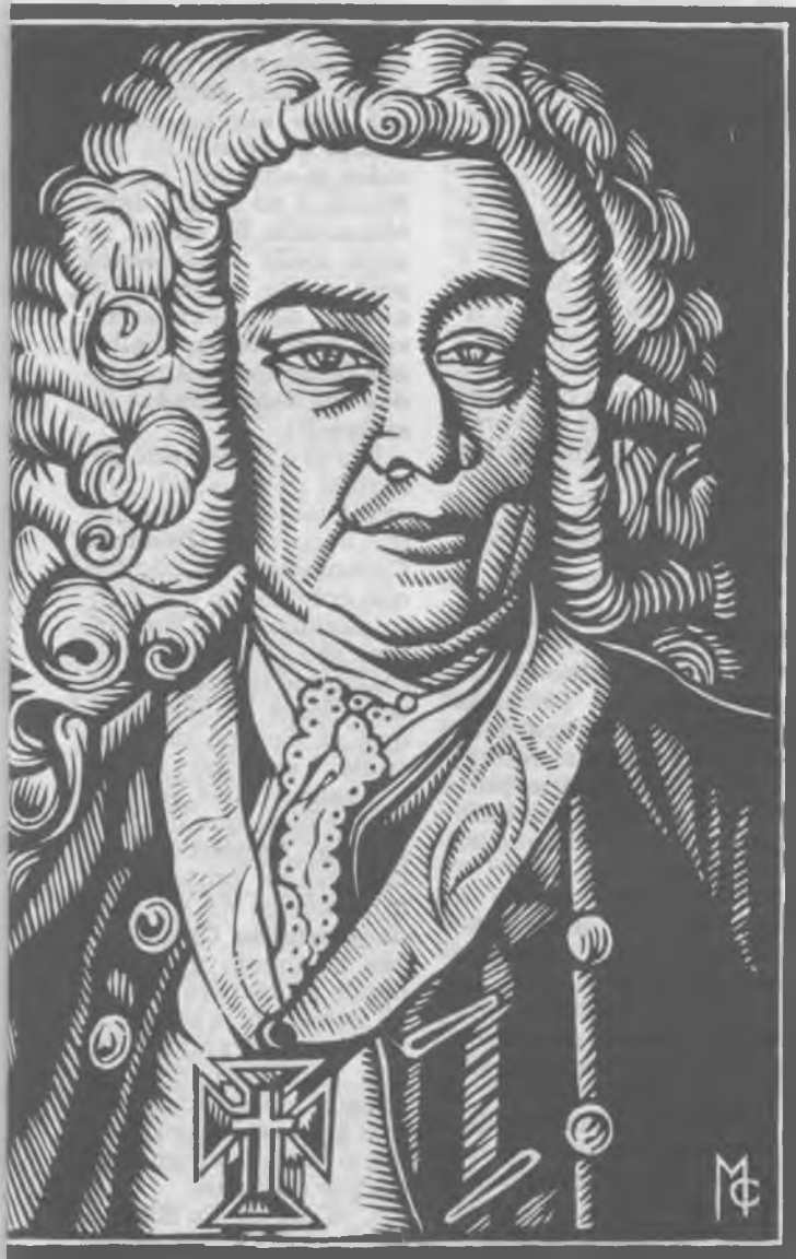
Marquês de Pombal

Gravura em madeira de Manuel Cabanas (1985)