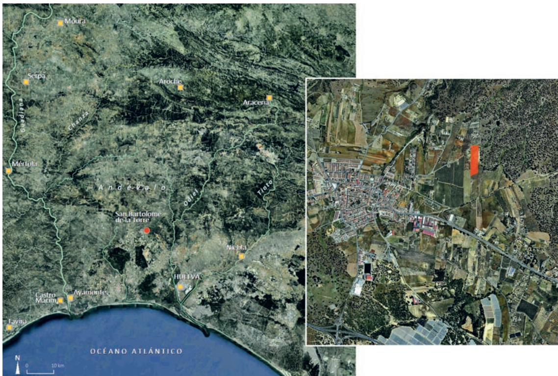
Figura 1 – Ubicación de San Bartolomé de la Torre en la provincia de Huelva (izquierda) y la finca “Huerta La Mina” (derecha).

Se tiene noticia de este yacimiento por primera vez en 2016 como consecuencia de una serie de hallazgos casuales por parte del entonces propietario de la parcela “Huerta La Mina” durante el desarrollo de unas labores agrícolas. Estas remociones de tierra supusieron el desmonte completo de seis cistas — según el testimonio del propietario —, siendo sus materiales posteriormente recogidos por la Delegación de Cultura y depositados en el Museo de Huelva. De aquí que la información reunida se limite a la descripción de unos materiales procedentes — en un principio — del interior de las cistas, así como de posteriores hallazgos fortuitos en superficie.