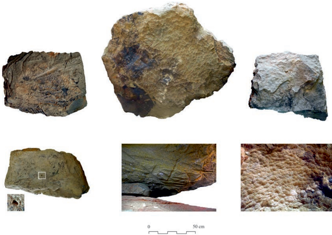
Figura 4 - Lajas de grauvaca y pizarra que conformaban las cistas dismanteladas en 2016. En algunas caras se observan marcas de tallado, huellas de arado y una posible cazoleta.

- Cuenco con carena baja, cuerpo superior con perfil cóncavo, ligeramente menos acusado que el anterior, fondo convexo y borde redondeado (Figs. 5.2, 6.2). Está elaborado a mano y cocido en atmosférica reductora. El desengrasante es muy fino y la superficie presenta un bruñido muy cuidado que le otorga un aspecto brillante. Tiene 14,2 cm de diámetro en la boca y una altura de 4,9 cm. Hemos identificado varias incisiones oblicuas bajo el borde, muy lavadas, que podrían pertenecer a una decoración perdida casi por completo (Fig. 7).