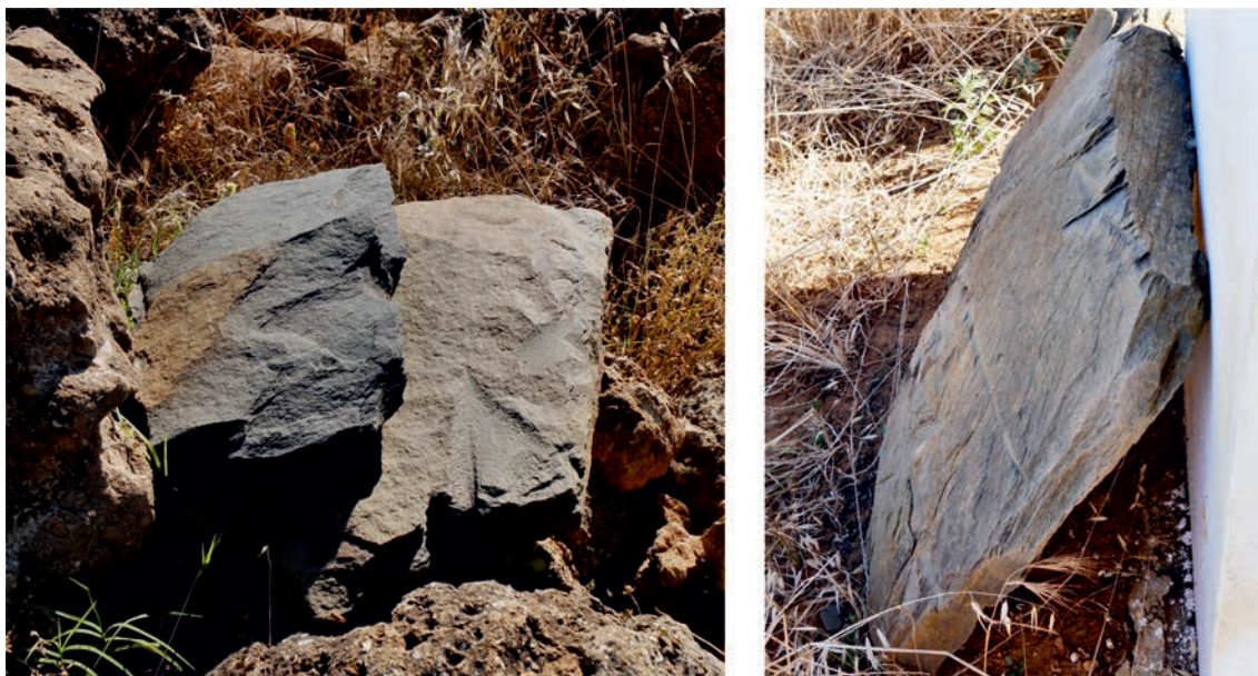
Figura 3 – Lajas de grauvaca y pizarra localizadas en un antiguo majano de la finca (izquierda) y, ya en la finca vecina, apoyadas contra el lindero oeste (derecha).

Durante nuestra visita a la parcela se nos refirió por parte del dueño que, de las seis cistas, cinco se encontrarían en la zona más elevada, en el tercio norte, manteniendo una distancia de 10 a 20 m entre ellas. La sexta se situaría a unos 150 m al sur de las anteriores, en cuyo entorno aparecieron dos lajas aisladas adicionales. Las seis cistas presentarían una orientación aproximada Este-Oeste.