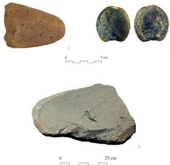
Figura 9 - Material lítico depositado en el Museo de Huelva. Hacha pulimentada (1), ficha discoidal (2) y molino barquiforme (3).