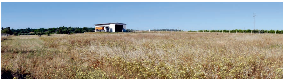
Figura 2 – Vista general de la finca “Huerta La Mina”.