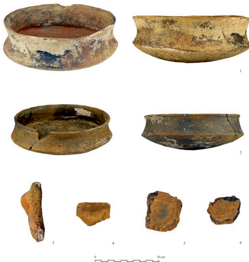
Figura 6 – Cerámicas depositadas en el Museo de Huelva. Cuenco carenado de cocción oxidante (1), reductora (2) y vasos hemisféricos (3-6).

- Dos galbos de posibles vasos hemisféricos de borde entrante (Figs. 5.5-6, 6.5-6). Están elaborados a mano y cocidos en atmósferas reductoras. El desengrasante es de tamaño medio-grueso y no se aprecian tratamientos de la superficie.