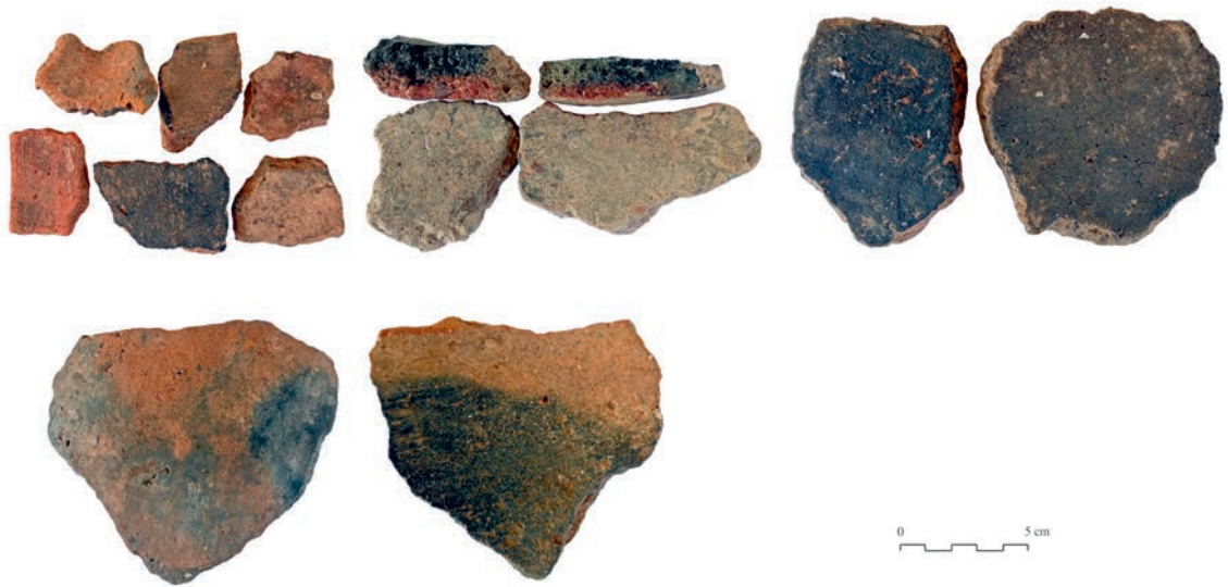
Figura 8 - Cerámicas recogidas durante posteriores labores de desbroce.