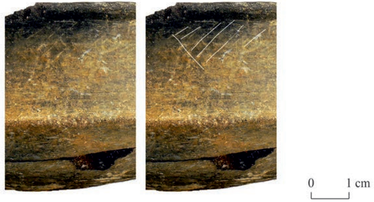
Figura 7 - Detalle de las líneas incisas bajo borde en el cuenco carenado de cocción reductora.