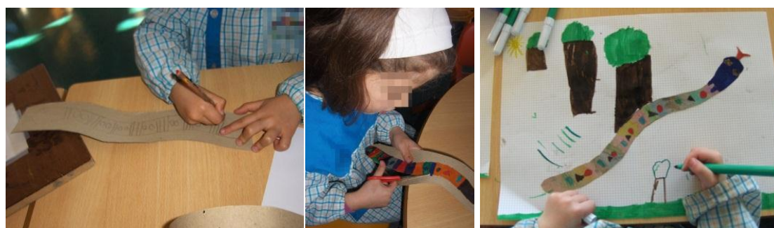
Figura 6 - Processo de construção da cobra dos padrões

Seguidamente, desenharam o habitat deste réptil numa folha branca e colaram a cobra dos padrões, previamente pintada ao gosto de cada criança (Fig. 6).