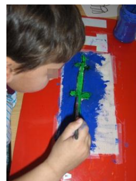
Figura 14 - Representação do crocodilo

Quando solicitado a realizar uma pintura no tecido, não hesitou em desenhar um crocodilo (Fig. 14). Como referem Hohmann e Weikart (2003) “(...) criar representações a partir das experiências reais das crianças, fortalece as suas imagens mentais e torna mais vivo o significado por detrás dos símbolos que encontram no mundo.” (p. 477)