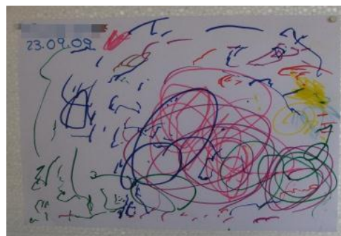
Figura 16 - 1 ano e 11 meses: momento “Voluntário”

Nesta fase as manchas e os rabiscos vão adquirindo formas com algum significado. (Fig. 16) A criança começa a atribuir ao desenho uma forma de linguagem, embora os seus objetivos possam não coincidir com o produto final. (Luquet, 1979)