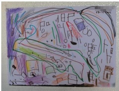
Figura 17 - "Incapacidade Sintética": 4 anos