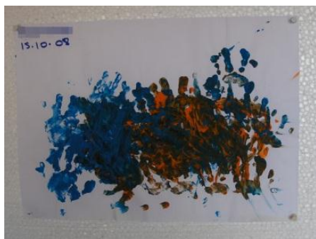
Figura 15 - 11 meses: momento “Involuntário”

Na classificação de Luquet (1979) a primeira fase do desenho infantil, intitula-se “Realismo fortuito” que se divide em dois momentos, sendo o primeiro denominado de “Involuntário”. O segundo momento decorre até por volta dos dois anos e meio e denomina-se “Voluntário”.