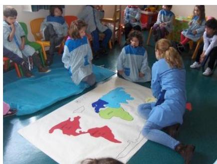
Figura 1 - Construção do puzzle dos cinco continentes.