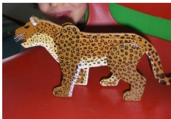
Figura 8 - Trabalho realizado em parceria com os pais: Leopardo

De entre os diversos temas abordados no âmbito do projeto, as crianças escolheram livremente aquele que mais lhes agradou. De entre os diversos trabalhos, surgiram temas como o leopardo (Fig. 8) e o cajueiro que, posteriormente tiveram a oportunidade de apresentar aos colegas (Fig. 9).