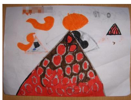
Figura 20 - Atividade autónoma: utilização da técnica aprendida

Por tudo isto, podemos afirmar que as atividades artísticas contribuem para o desenvolvimento ser humano, na medida em que potenciam toda uma infinidade de