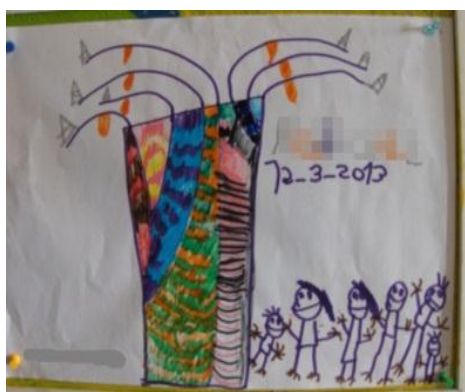
Figura 12 - 1.ª Representação do imbondeiro

Decorrido algum tempo após estas aprendizagens, uma das crianças da sala de atividades, o Renato, realizou espontaneamente dois desenhos de um imbondeiro, tendo reunido nas suas representações, dois conhecimentos adquiridos no âmbito do projeto: os padrões africanos (Fig. 12) e o imbondeiro (Fig. 13).