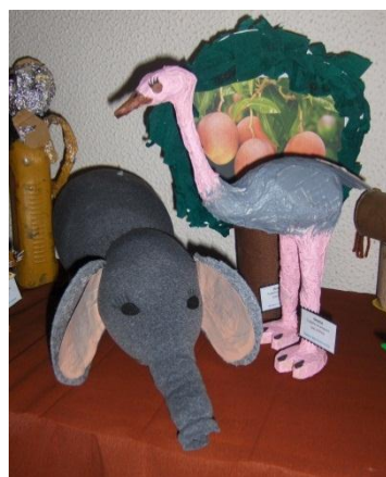
Figura 11 – Animais da savana

A exposição pretendia representar uma aldeia africana (Fig. 10), reproduzindo também o ambiente envolvente da savana, através da figuração da fauna e da flora características da região. (Fig. 11)