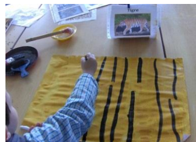
Figura 7 - Produção da pele do tigre

Em suma, as atividades realizadas no âmbito da exploração da fauna e da flora africanas tiveram um cariz extremamente rico, tendo permitido a exploração de diversas áreas de conteúdo.