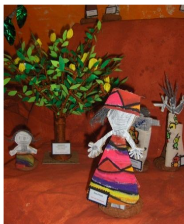
Figura 10 - Aldeia africana

O marco conclusivo desta primeira etapa do projeto consistiu na realização de uma exposição de todos os trabalhos realizados, tendo lugar no átrio de acolhimento da instituição.