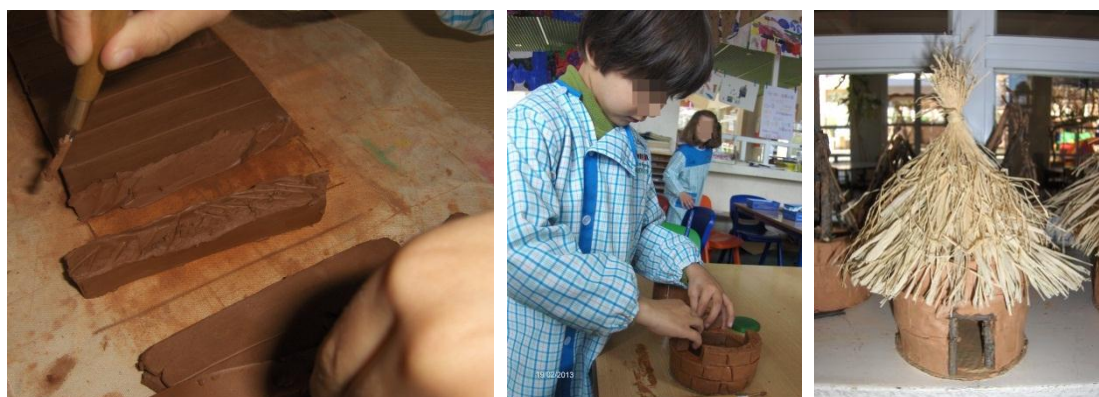
Figura 5 – Processo de construção da cubata

Este material é idêntico à palha utilizada por alguns povos africanos na construção das suas habitações. (Fig. 5)