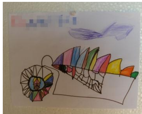
Figura 18 - "Incapacidade Sintética": 5 anos

Rodrigues (2002) afirma ainda que, “ A preferência pelas cores vivas e contrastantes é uma característica dominante na pintura infantil (...) outras há que se concentram a desenhar, sensíveis à expressividade do traço e á definição do pormenor.” (p. 40) (Fig. 18)