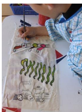
Figura 3 - Pinturas no tecido

Colocaram-se os cabelos, moldados em palha-de-aço, tendo em conta os penteados típicos do povo africano. Por último, os bonecos foram vestidos com os panos pintados pelas crianças. (Fig. 4)