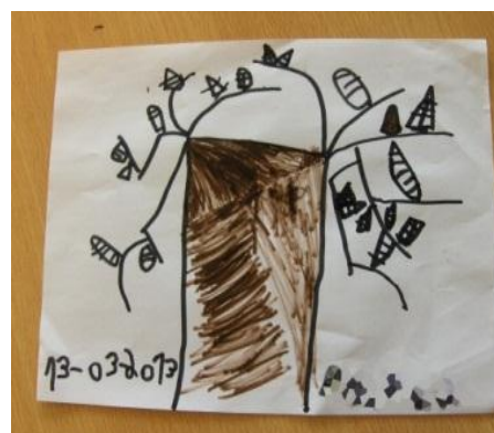
Figura 13 - 2.ª Representação do imbondeiro