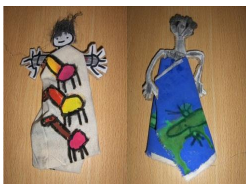
Figura 4 - Bonecas africanas

Seguiu-se a exploração dos tipos de habitação adotada pelo povo africano. Neste contexto, foi implementada uma atividade que permitiu que as crianças pudessem comparar os tipos de habitação de diversos países.