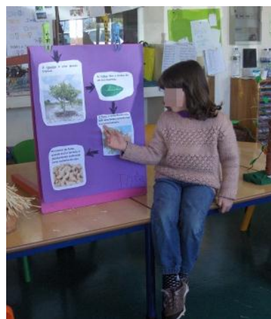
Figura 9 - Apresentação do trabalho realizado em parceria com os pais: Cajueiro