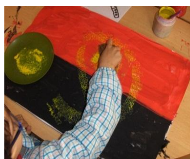
Figura 2 - Elaboração da bandeira angolana

Nesta exploração geográfica, as crianças situaram Angola dentro do continente africano e Luanda dentro do país, tendo proporcionado a aquisição de novos conceitos, tais como: continente, país e cidade. Uma vez conhecido o país, houve a necessidade de explorar a bandeira que o representa. Assim, as crianças identificaram as cores e os símbolos da bandeira e reproduziram-nos através de duas técnicas de pintura distintas: o esponjado e o stencil . (Fig. 2). A atividade permitiu ainda explorar algumas noções matemáticas e de orientação espacial, tais como: em cima, em baixo, a metade, o todo, retângulo, quadrado, entre outros.