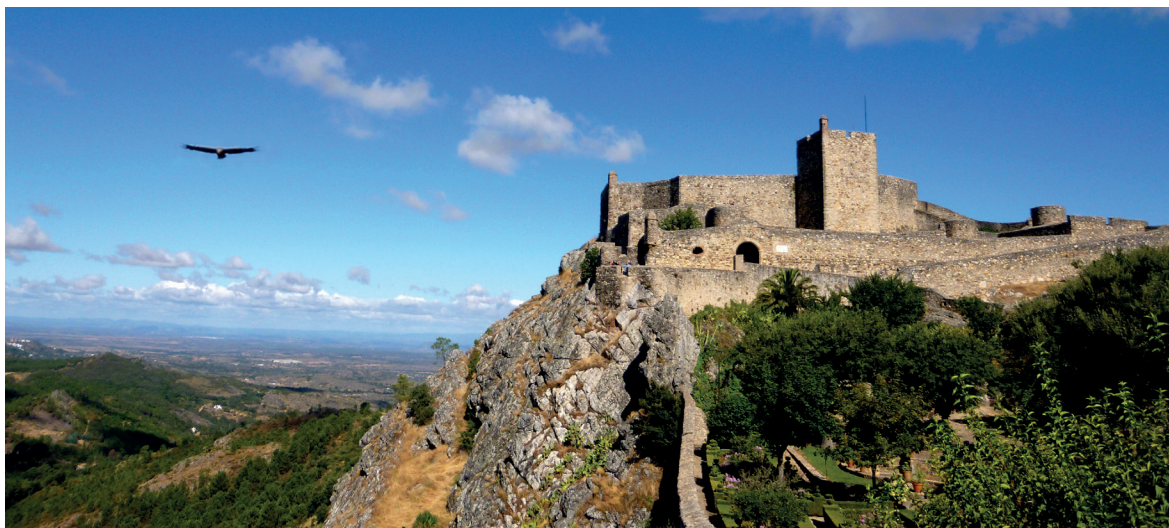
Fig. 1. De Marvão vê-se tudo , “Marvão ninho de águias”