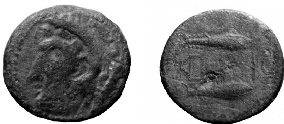
Fig. 3 Moeda romana com caracteres púnicos e cabeça de Hércules, cunhada em Salácia (Alcácer do Sal), século II aC, encontrada no povoado de Vidais – Marvão