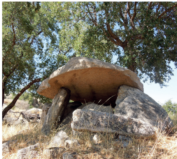
Fig. 2 Dólmen da Laje dos Frades, Marvão

Os distintos complexos geológicos que caracterizam esta área, associados aos aspetos orográficos e consequentemente aos climáticos que se projetam nas características florísticas e faunísticas específicas de cada um deles, devem ter condicionado duas economias