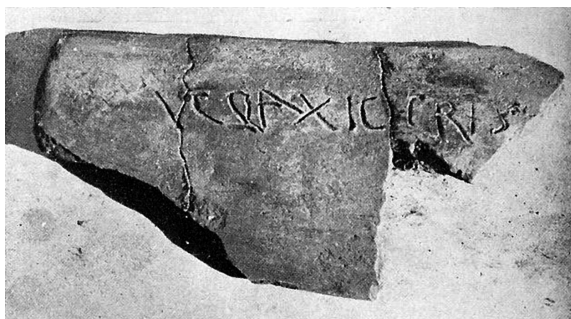
Fig. 4 Telha do povoado alto-medieval do Monte Velho, em Marvão, com a inscrição cristã HIC PAX HIC CRISTVS (Paço, 1949)