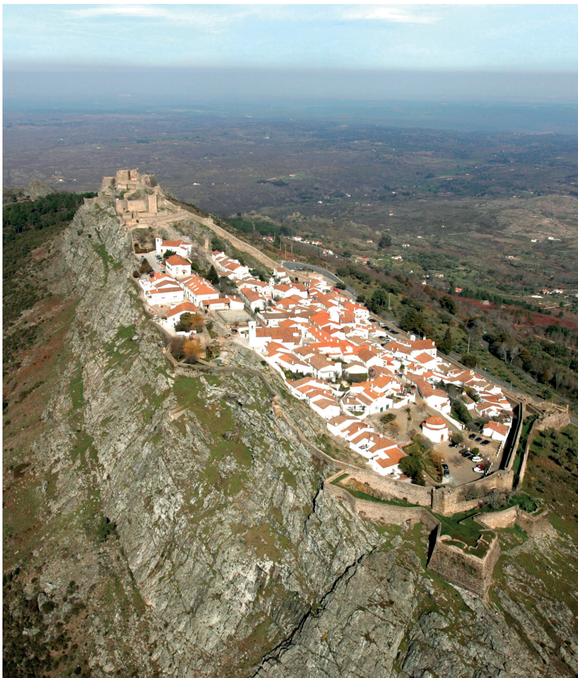
Fig. 8 Vista aérea de Marvão do lado norte