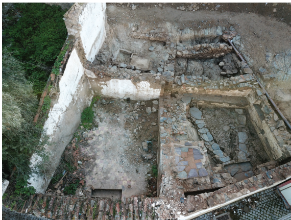
Fig. 3 Vista aérea das duas unidades habitacionais, cuja gênese está atribuída ao século XVI, identificadas na extremidade noroeste do terreno (Alexandra Gradim e João Carlos Simões)

compartimentos separados, um na extremidade nordeste do logradouro, em taipa, e outro, a sudeste do logradouro, em alvenaria de xisto ligada com terra. Este último compartimento mantém-se em uso até ao século XVII, sendo desativado na centúria seguinte. Na área central do logradouro também surgem nesta fase dois alinhamentos, orientados entre noroeste-sudeste, sendo o mais a nordeste em alvenaria de xisto ligada com terra, enquanto que o localizado mais a sudoeste era construído em alvenaria de xisto ligada com argamassa de cal.