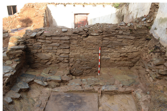
Fig. 4 Entaipamento do vão de acesso entre a casa de fora e a casa de dentro de uma das habitações localizadas na extremidade noroeste do terreno

Os trabalhos arqueológicos revelaram o que seria, certamente, uma tipologia recorrente no início do período moderno, coerente com os princípios genéricos descritos