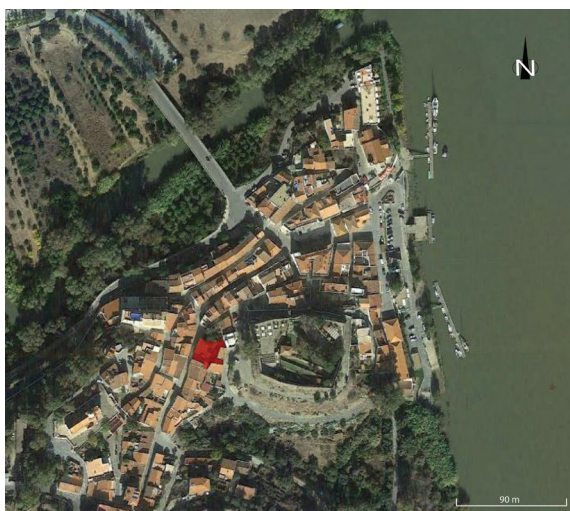
Fig. 1 Localização do edifício dos antigos CTT de Alcoutim, assinalado a vermelho

Dada a proximidade do castelo, esta área está abrangida pela Zona Geral de Proteção (ZGP) da “Fortaleza de Alcoutim”, pelo que a Direção Regional de Cultura do Algarve exigiu a realização de trabalhos arqueológicos. Estes foram efetuados pela equipa do Campo Arqueológico de Mértola, entre agosto de 2019 e fevereiro de 2020, tendo sido organizados em duas fases. Na primeira fase, num momento pré-empregada, foram executadas quatro sondagens de diagnóstico, num total de 26 m 2 . Na segunda fase, iniciada com o princípio das obras, foi realizado o acompanhamento arqueológico da demolição mecânica do prédio existente, assim como da escavação, igualmente por meios mecânicos, dos níveis de cronologia de formação contemporânea. A partir dos níveis de cronologia moderna, foi feita uma escavação arqueológica manual até ao substrato rochoso ou até ao nível de afetação previsto pelo projeto.