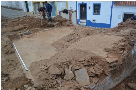
Fig. 5 Pavimento de argamassa do final do século XVIII

para o urbanismo da vila, correspondendo à pequena habitação de casa dianteira e câmara disposta em profundidade (a que, por vezes, se acrescentavam ainda outros cômodos), com ou sem logradouro. Este estudo permitiu, assim, atribuir uma configuração e materialidade a um modelo de habitação recorrente na documentação tardo-medieval e moderna portuguesa, em diferentes geografias, que, sem prejuízo da emergência de outros modelos, acabou por se conservar, na região, até ao presente (Costa, 2014, pp. 286-288). A implantação em declive, em que a cada um destes espaços corresponde a sua cota de pavimento (com degraus e poiais de transição) e a delimitação com paredes estruturais, constitui um tema de continuidade evidente, entre as habitações escavadas nos níveis mais baixos e as habitações levantadas no âmbito dos estudos sobre a arquitetura vernacular. Esta continuidade é ainda confirmada pela autonomia que cada um dos compartimentos adquiria, quando passavam frequentemente de uma habitação para outra, através da abertura e do encerramento de vãos.