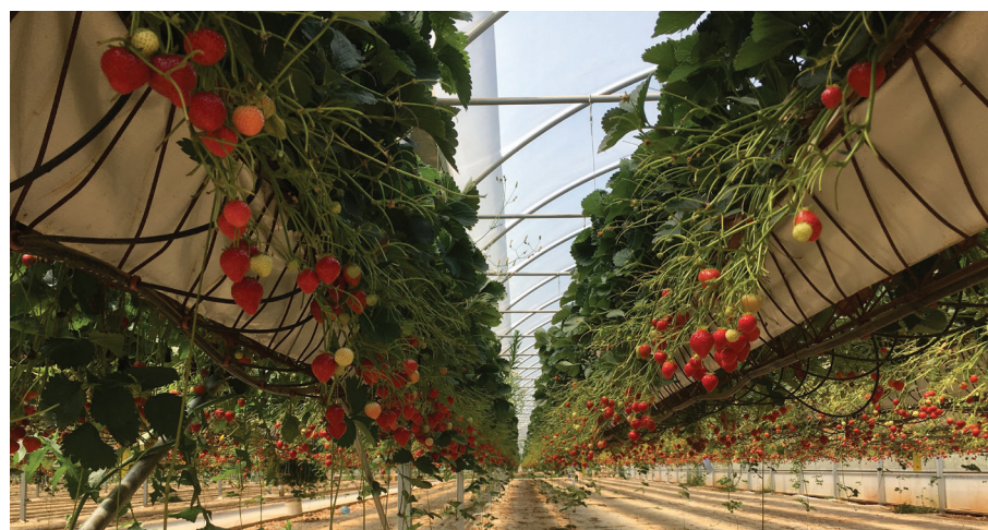
Cultivo de morango em substrato (em fase final do ciclo de produção), aliando elevada produtividade e qualidade, no Algarve.