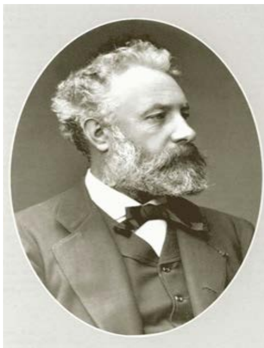
Figura 1. Jules Verne por volta de 1874