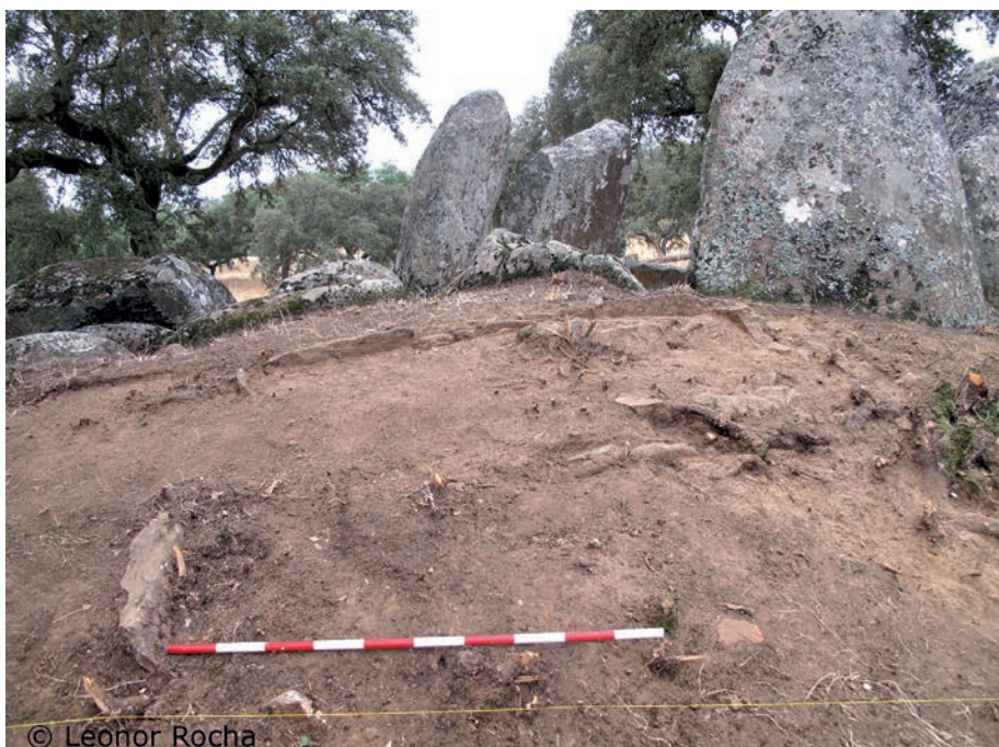
Figura 4 – Aspetto da estrutura após limpeza e marcação da quadrícula.

A mamoa [4] foi identificada no quadrado H7. Apresenta terras amarelas, muito compactas misturadas com pedras de média a pequena dimensão.