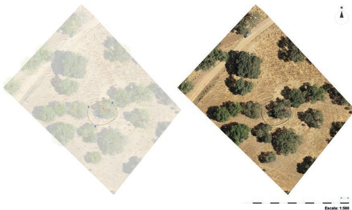
Figura 3 – Levantamento topográfico da Anta da Murteira de Cima e ortofotomapa.

A implantação privilegiada da anta da Murteira de Cima permitiu obter uma ligação a rede geodésica nacional e a elaboração da topografia 1 (Fig.3).