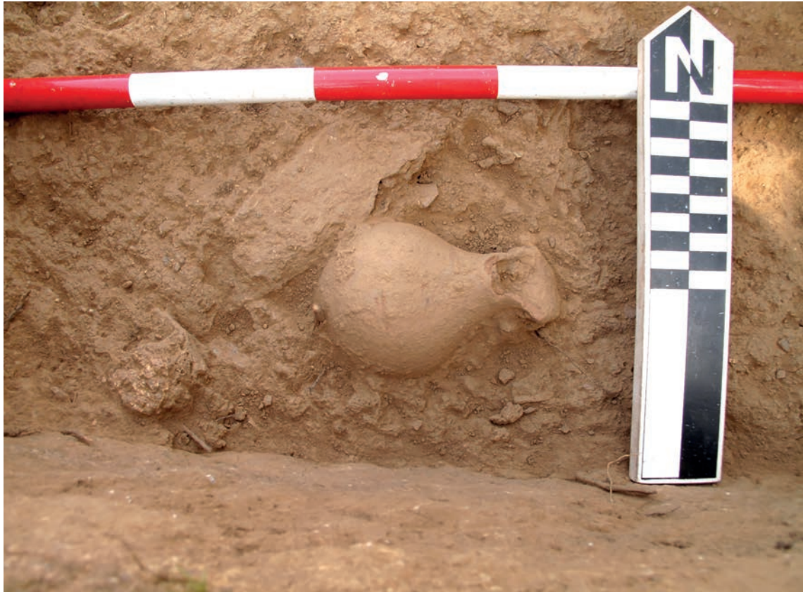
Figura 7 – Pormenor do jarro da Sepultura 2, no decurso da escavação.