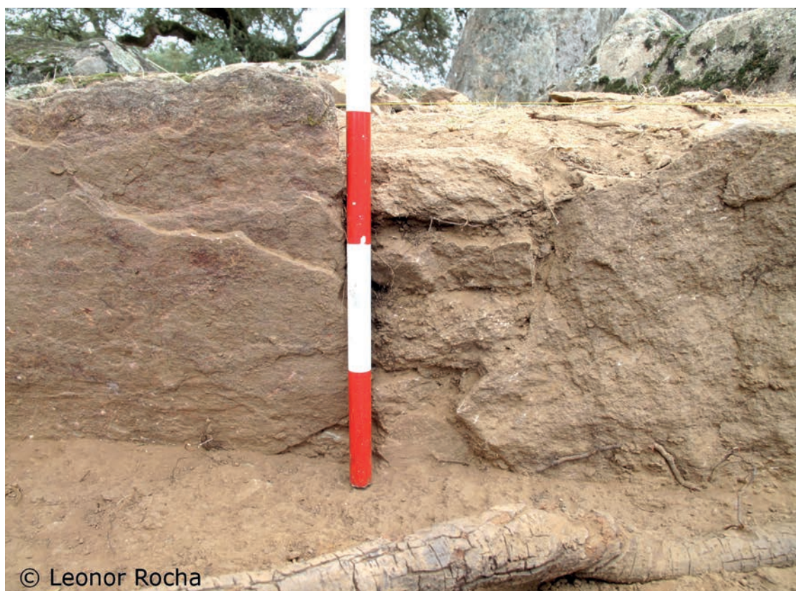
Figura 5 - Pormenor dos esteios no lado Sul da Sepultura 1.