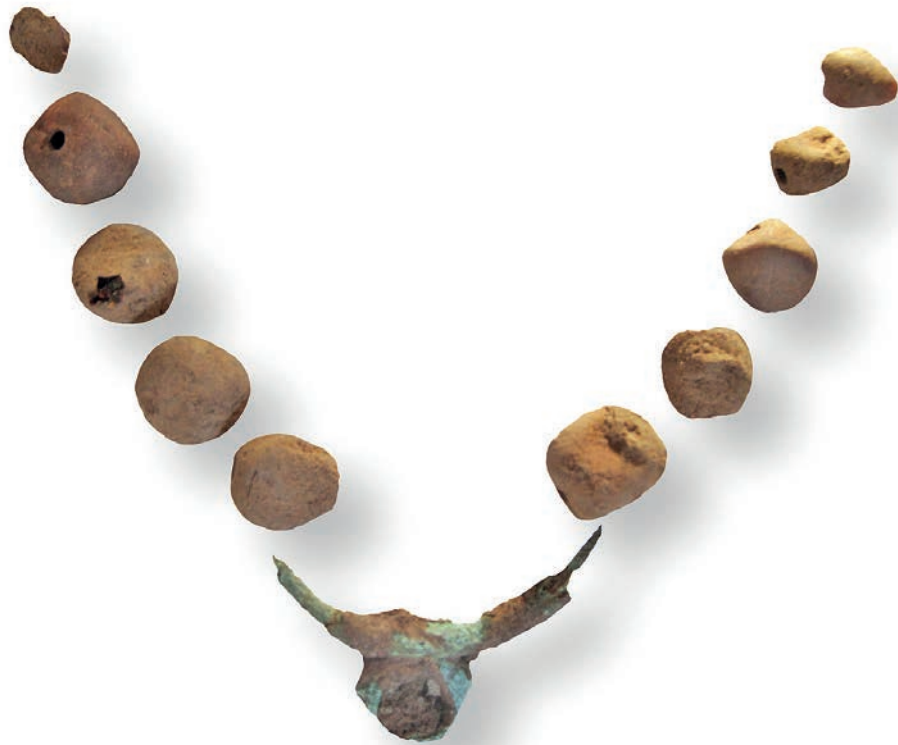
Figura 8 – Colar recolhido na Sepultura 2.