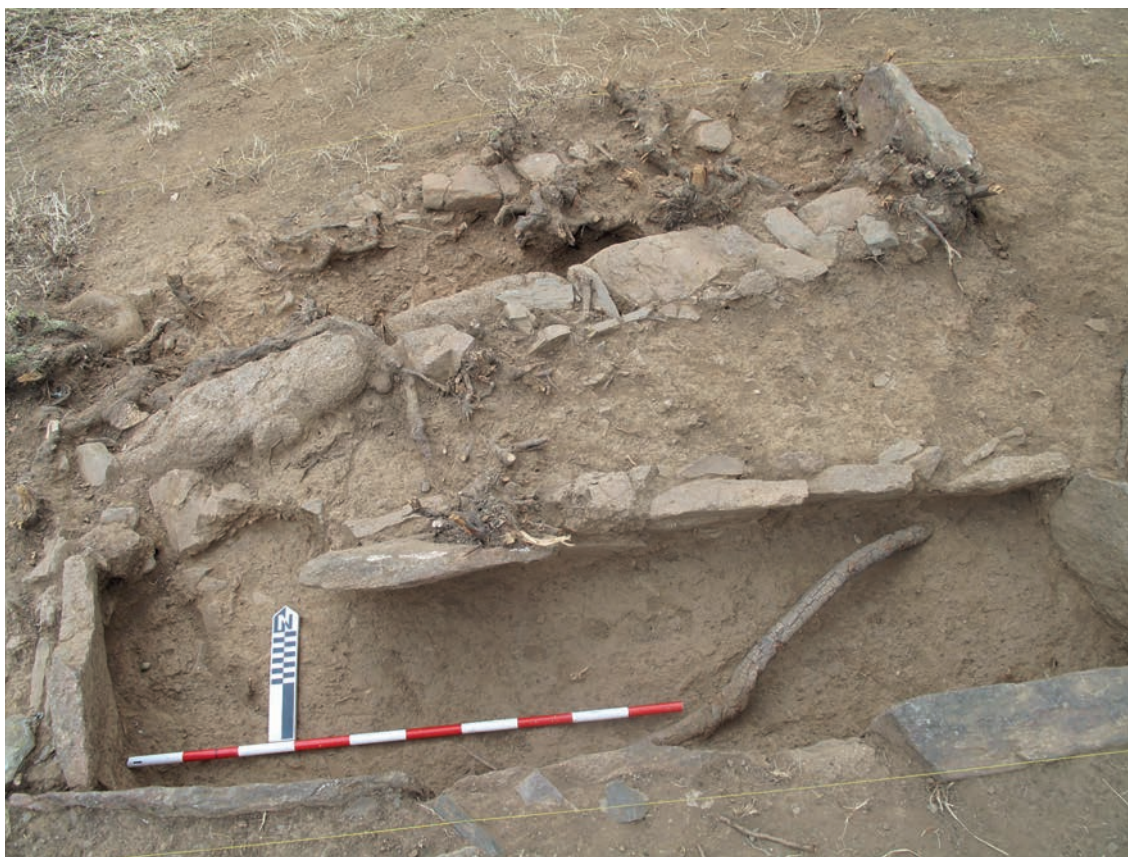
Figura 9 – Vista geral das sepulturas no final da escavação.

O espólio recolhido no decurso desta escavação integra o conjunto de oferendas funerárias típicos deste período, por um lado as oferendas funerárias, aqui representada pelo pequeno jarro de cerâmica e, por outro, os objetos de adorno, com o colar de contas de âmbar e o pequeno pendente metálico. Infelizmente o mau estado dos restos osteológicos existentes não nos permitiu obter uma datação de C14, por falta de colagénio 3 . Pese embora as restrições existentes, a tipologia destas sepulturas, conjugadas com o espólio recolhido apontam, sumariamente, para uma única cronologia, no período tardo romano (séc. VI-VII). O estudo físico químico 4 do espólio recolhido, nomeadamente o âmbar e o metal, poderão permitir afinar esta cronologia, num futuro próximo.