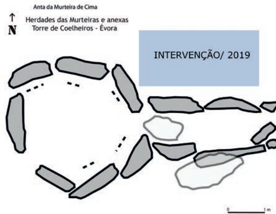
Figura 1 – Planta da anta da Murteira de Cima (sgd. Leisner, 1949, p. 59; Est.1, nº 3, adaptado).

Estas evidências conduziram a que, no âmbito de um projeto de valorização do património desta Herdade, a Fundação Eugénio d'Almeida (doravante designada apenas pela sua sigla – FEA) realizasse, em 2007, algumas ações sobre o conjunto megalítico. Este trabalho, coordenado pela signatária, tinha, no caso da anta da Murteira de Cima, previsto realizar ações pontuais de conservação que passavam pela crivagem das terras resultantes da violação e, por outro, preencher a depressão existente na câmara, de modo a assegurar a estabilidade estrutural do monumento e a sua valorização (Rocha, 2015). Foi no decurso destes trabalhos que se identificou uma estrutura no lado Norte da mamoa, junto aos esteios de corredor/ câmara e que agora se intervencionou (Fig. 1).