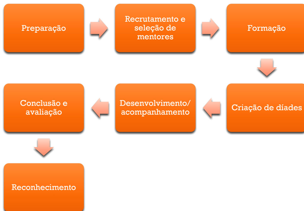
Figura 1. Fases de desenvolvimento e implementação de programa de mentoria.

Considerando os aspetos anteriormente referidos, propõe-se o desenvolvimento e a implementação de um programa de mentoria, de acordo com as seguintes fases (Figura 1):