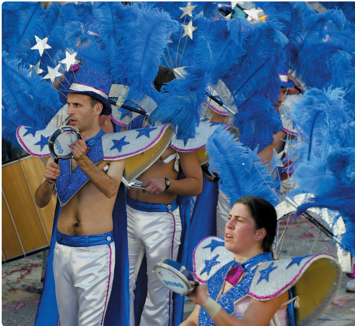
A avenida transforma-se num rio de cores.