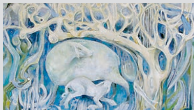
“PINTURA DE ANNA CUMMING”