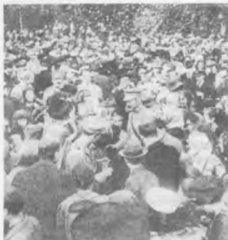
Sidónio Pais inaugurando uma das cozinhas que em Sintra e Sacavém forneciam sopa aos pobres, e numa festa no Jardim Zoológico de Lisboa dedicada às crianças da capital

sua nomeação para a Presidência da República, ocorrida a 6 de Agosto de 1923.