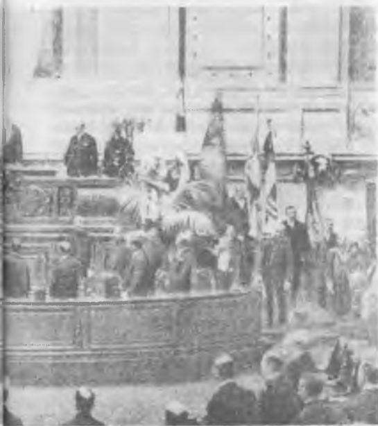
compromisso de honra como chefe do Governo que sucedia a António José de Almeida

Efectivamente, Manuel Teixeira Gomes como ministro plenipotenciário em Londres, desde 1911 a 1923, desenvolveu digníssimo trabalho, representando os interesses da República Portuguesa como até então nunca teriam sido defendidos. A sua carreira diplomática, materializada numa boa dúzia de anos ao serviço da Embaixada Portuguesa em Londres, foi apenas interrompida de 25 de Janeiro de 1918 a 11 de Fevereiro de 1919, por motivo da instauração da ditadura sidonista.