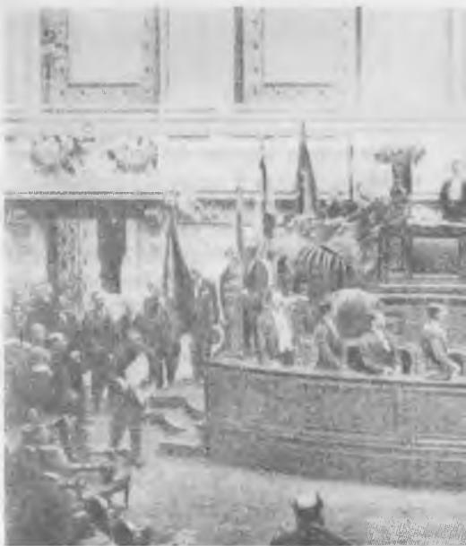
Teixeira Gomes proferindo a sua alocução ao Congresso, em Outubro de 1923, que acabava de assistir ao seu

Pacatamente radicado no Algarve, onde geria os seus negócios agrícolas, foi repentinamente sobressaltado pela Revolução do 5 de Outubro, a cujo ideário tinha desde há muito oferecido os seus serviços (4). Eufórico de alegria saúda a Revolução vitoriosa e as massas populares que heroicamente se bateram na Rotunda pela consecução da liberdade, acabando também ele por consentir sacrificar o sossego dos seus 50 anos ao reboiço da reconstrução nacional. « Tudo larguei e fui servir a República no posto de ministro em Londres, para onde jamais me passara pela ideia que iria, e terminantemente recusei quando mo propuseram » (5). Mas, a 23 de Março de 1911 acaba por aceitar o imperioso dever de servir a nação na capital inglesa.