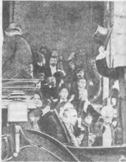
Bernardino Machado foi ministro dos Negócios Estrangeiros, chefe do Governo e Presidente da República, funções que abandonou por duas vezes, em 1917 e 1926, por força de revoluções triunfantes

«Ao cientificismo literário que pretendia assimilar o romance a um inquérito da vida vão suceder o subjectivismo, o interesse pelo subconsciente, o império da personalidade cultivada» (22). De facto a nova geração literária sofria a influência filosófica e estética de grandes pensadores como Freud, Nietzsche e Bergson que incutiram no espírito destes a importância que se deve dar ao inconsciente, ao intuicionismo, ao culto da beleza e ao orgulho da auto-afirmação (23).