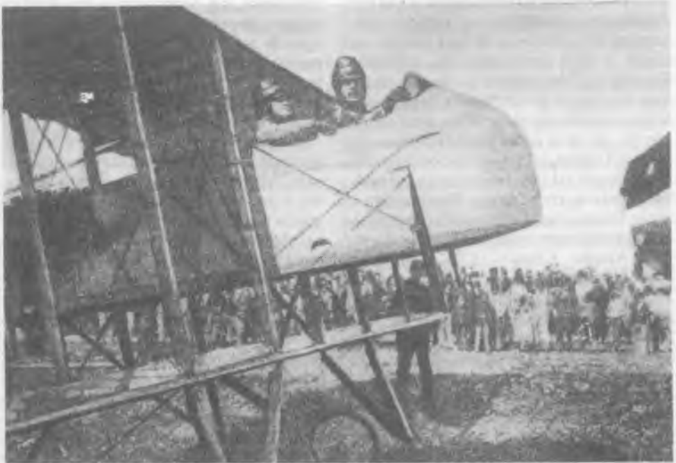
Afonso Costa, ministro das Finanças e chefe do Governo a bordo de um avião e durante um visita à Escola de Aviação criada em 1914, no começo da guerra

Dois dias depois, Teixeira Gomes despediu-se dos amigos mais próximos e na presença da Imprensa desejou ao País e à República as maiores prosperidades. Partiu na manhã do dia 17 de Dezembro de 1925, a