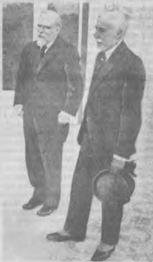
Teixeira Gomes, sobre quem recairá a escolha do Partido Democrático para chefiar o novo Governo de Portugal (à esquerda de António José de Almeida), logo após o seu regresso de Londres, onde desempenhava funções de ministro de Portugal

outros nomes famosos das letras e das artes (1).