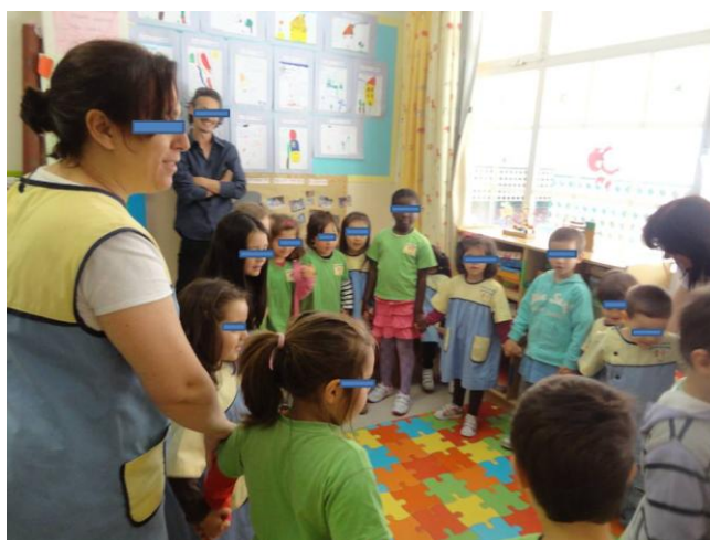
Ilustração 3 - O grupo prepara-se para dançar

Com esta atividade foi visível a evolução da criança ao estar presente perante o grande grupo e conseguir falar para todos, pois no início do ano esta não comunicava com ninguém; além do entrave em conseguir falar a língua dominante do país em que vive, esta sentia-se envergonhada quando falava para o grupo. Verificou-se um desenvolvimento satisfatório por parte da criança. Pôde-se dizer que a mesma já consegue ter uma boa conversa só em português, e que é capaz de interagir com todo o grupo respondendo às questões que lhe colocavam.